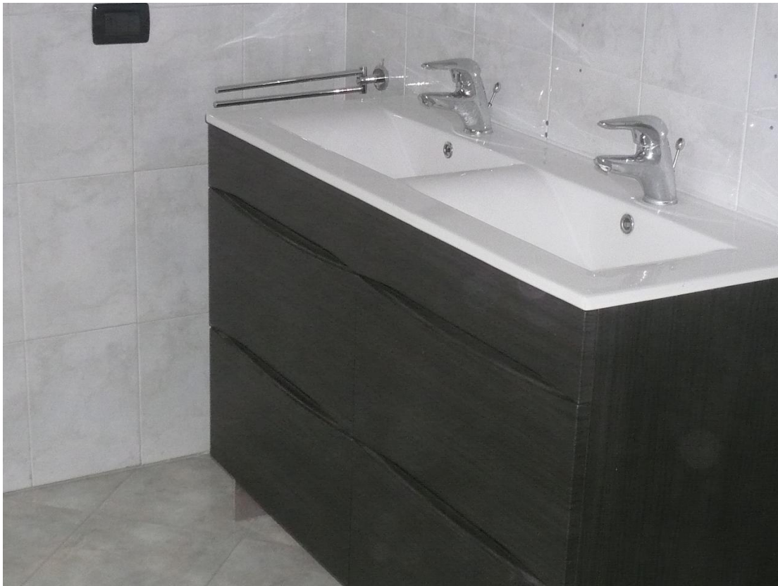
Figura 15 - Particolare locali interni alloggio