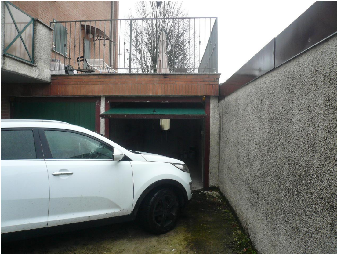
Figura 19 - Particolare locale autorimessa