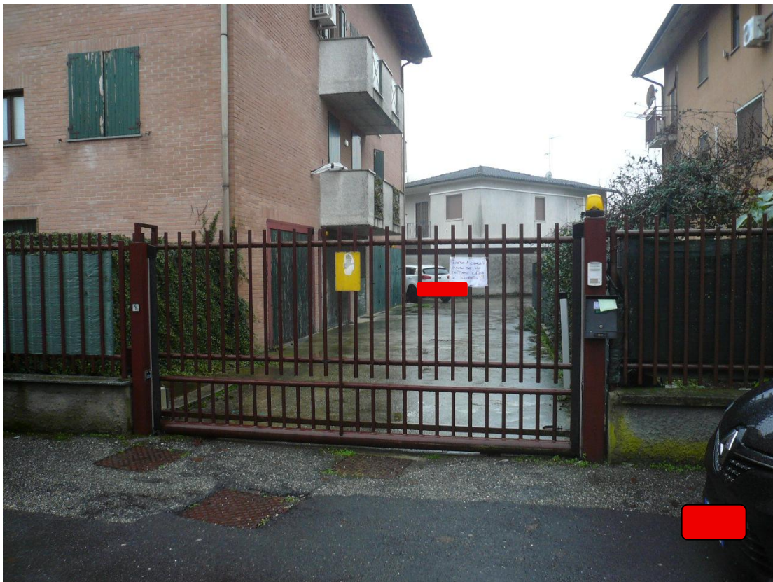
Figura 4 - Particolare cancello carrabile per ingresso al fabbricato