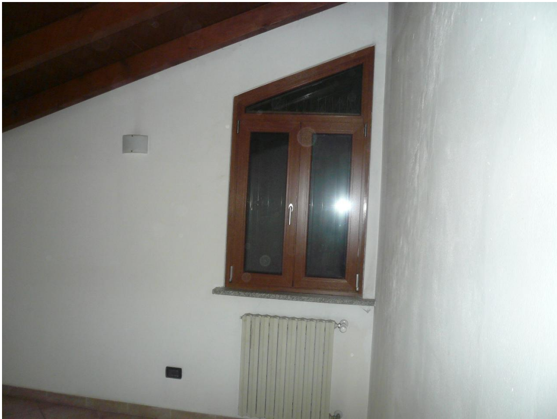
Figura 13 - Particolare locali interni alloggio