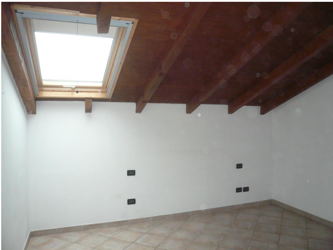
Figura 14 - Particolare locali interni alloggio