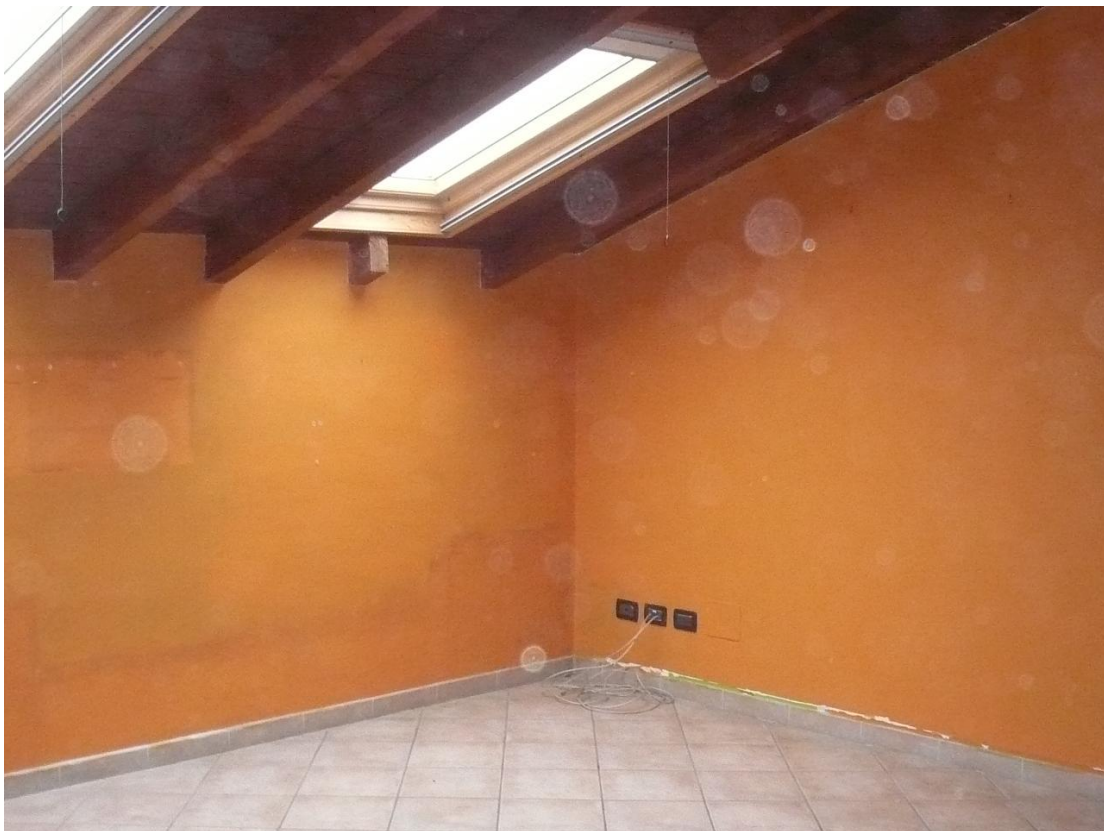
Figura 10 - Particolare locali interni alloggio