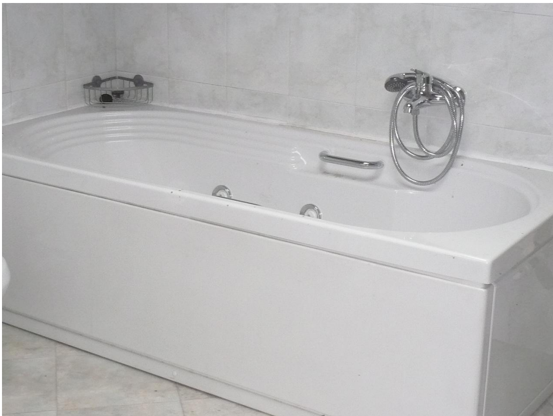
Figura 16 - Particolare locali interni alloggio