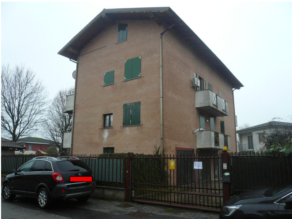
Figura 2 - Vista dalla strada pubblica del fabbricato in cui sono ubicati i beni oggetto di stima