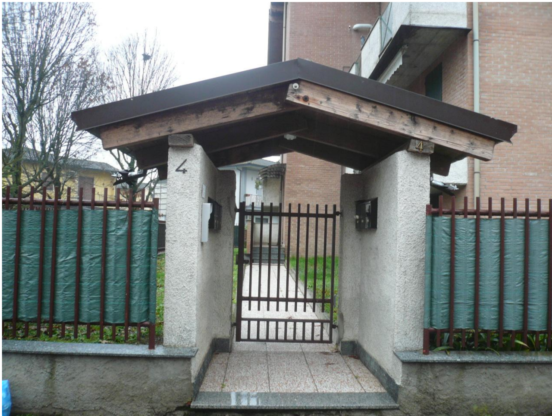
Figura 3 - Particolare cancello pedonale per ingresso al fabbricato