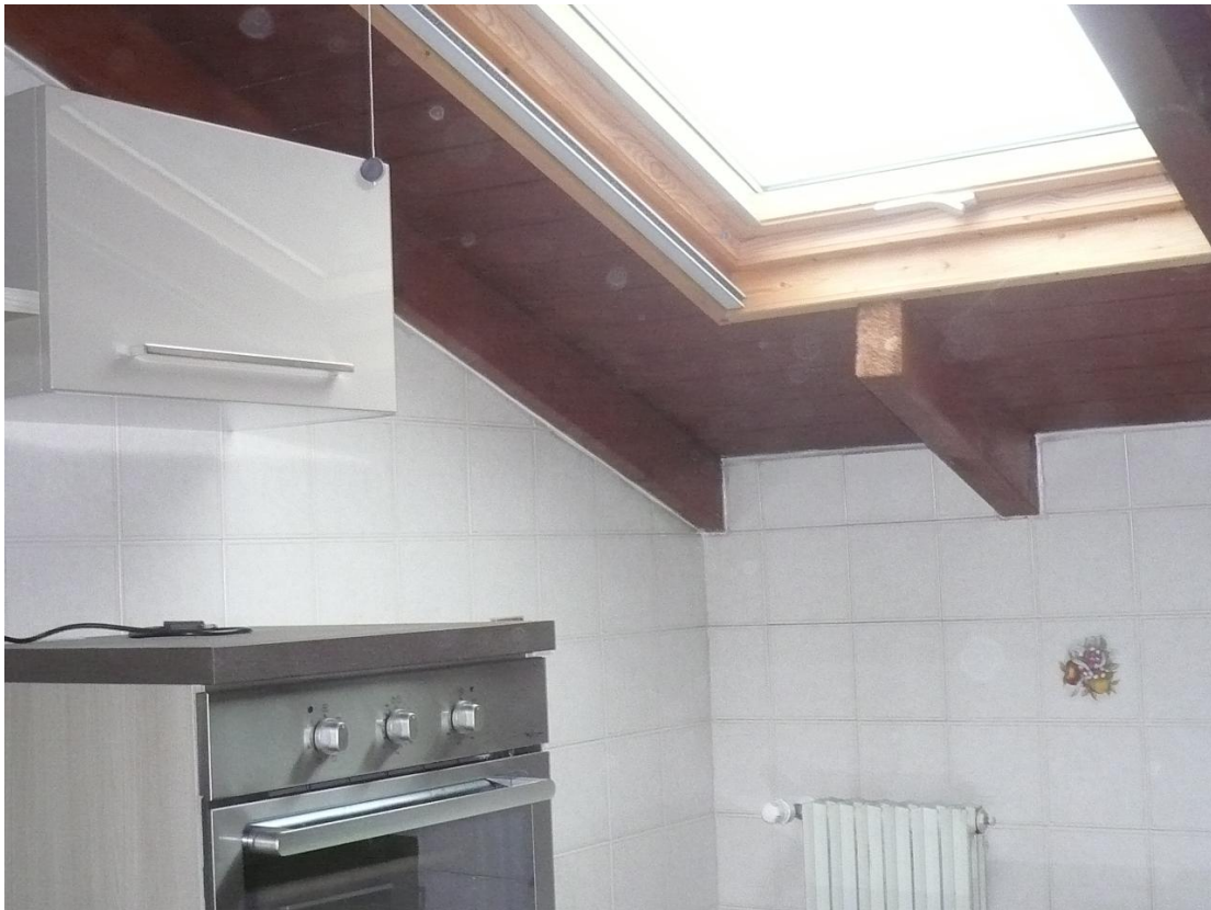
Figura 18 - Particolare locali interni alloggio