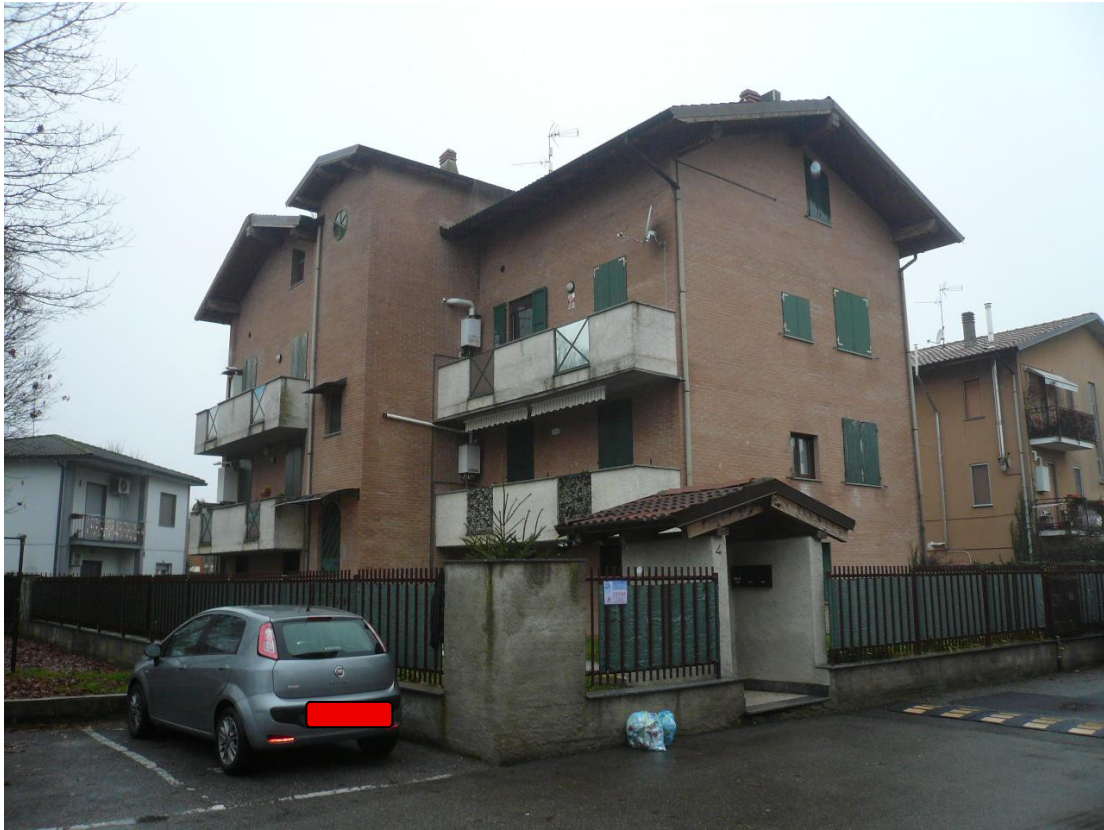
Figura 1- Vista dalla strada pubblica del fabbricato in cui sono ubicati i beni oggetto di stima