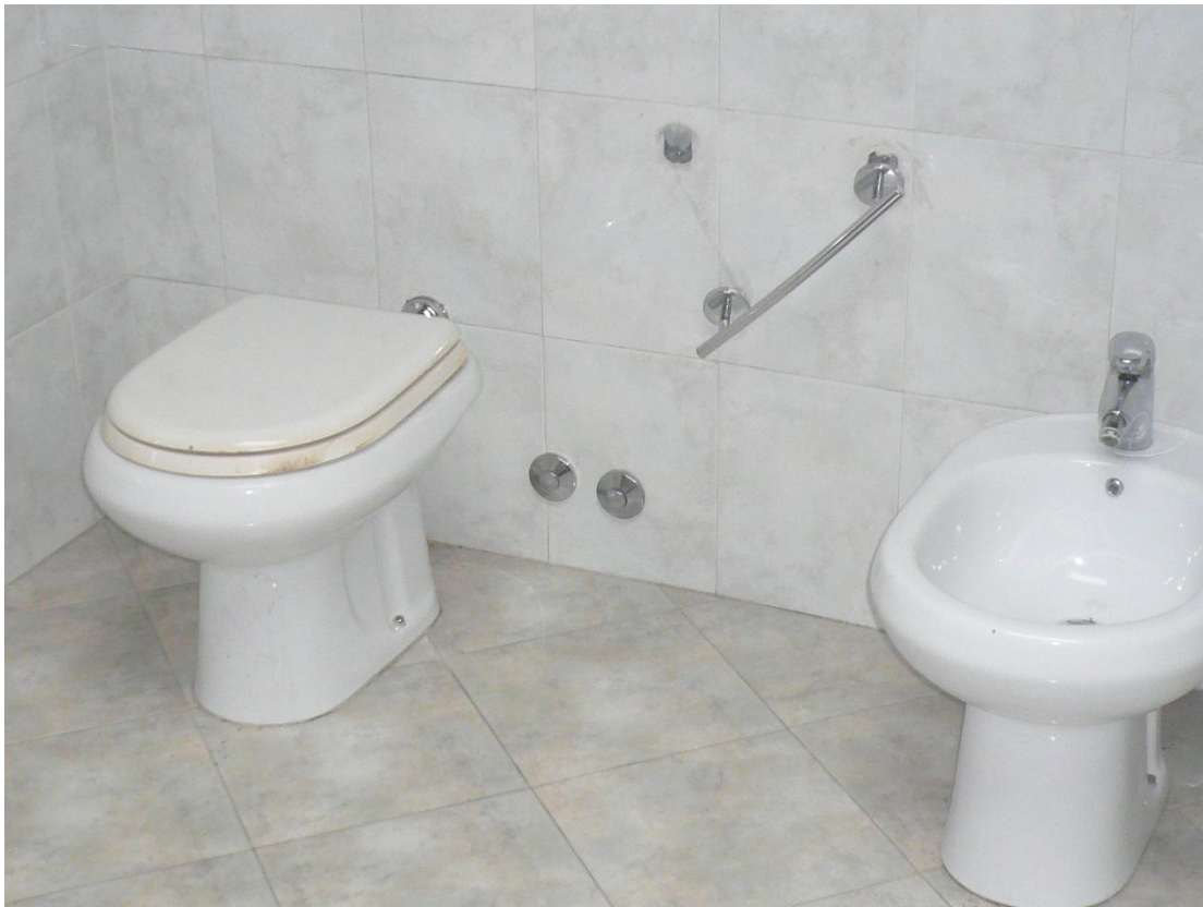
Figura 17 - Particolare locali interni alloggio