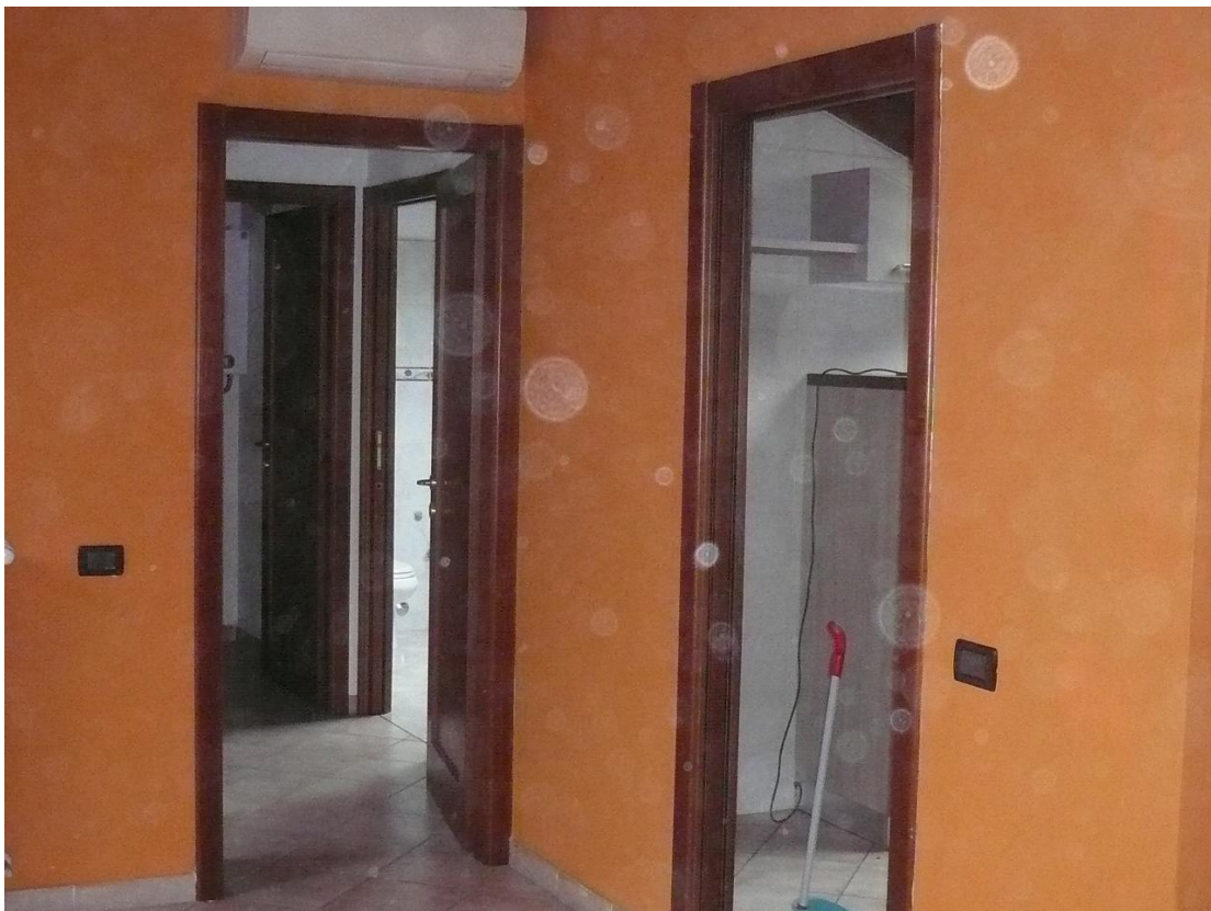
Figura 12 - Particolare locali interni alloggio