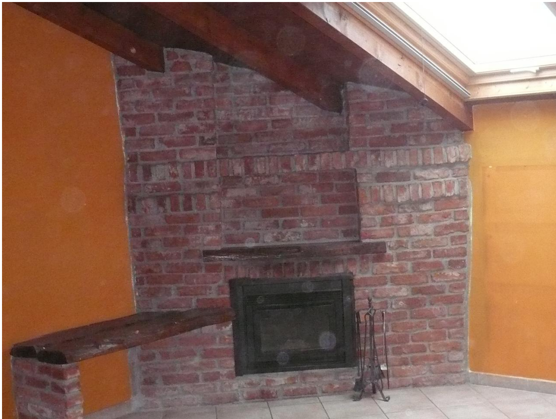
Figura 11 - Particolare locali interni alloggio