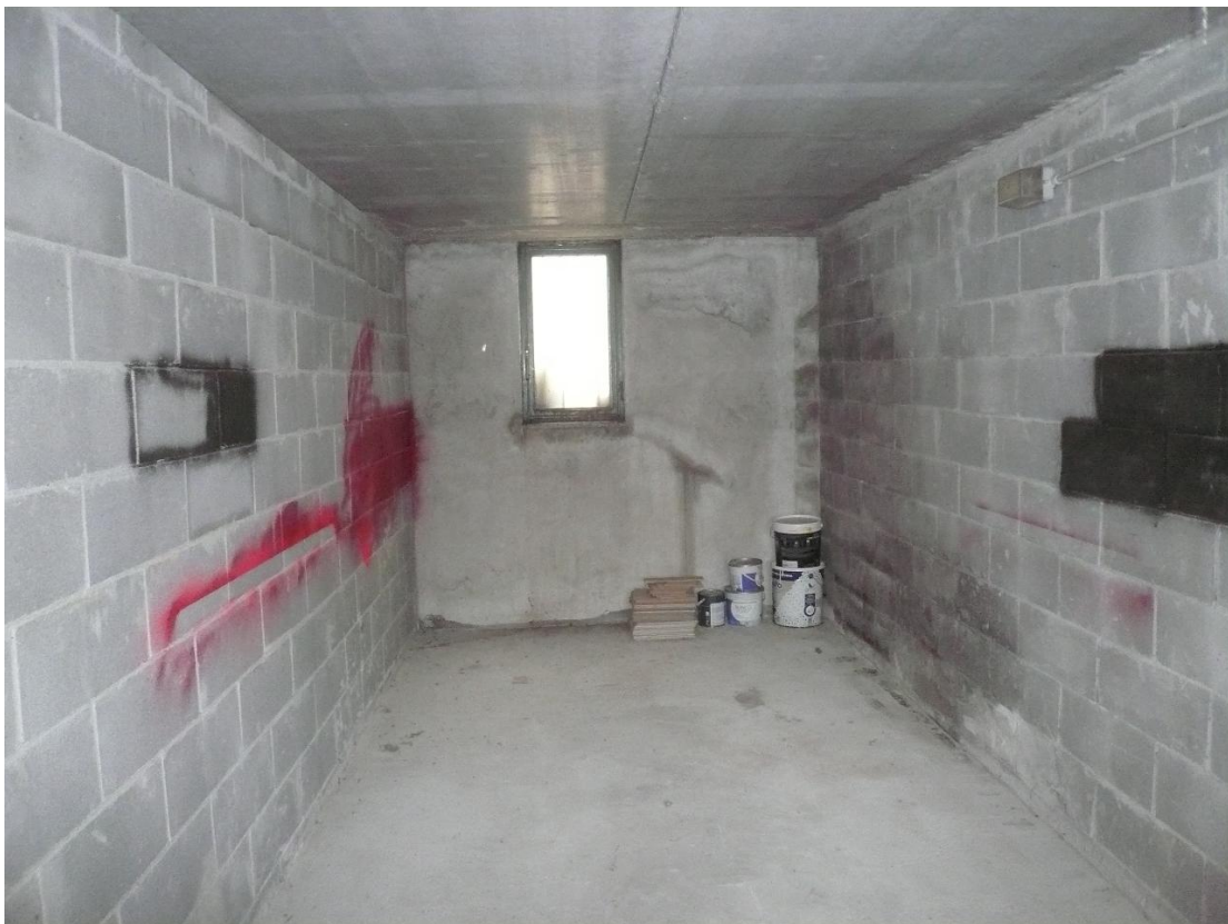
Figura 20 - Particolare locale autorimessa