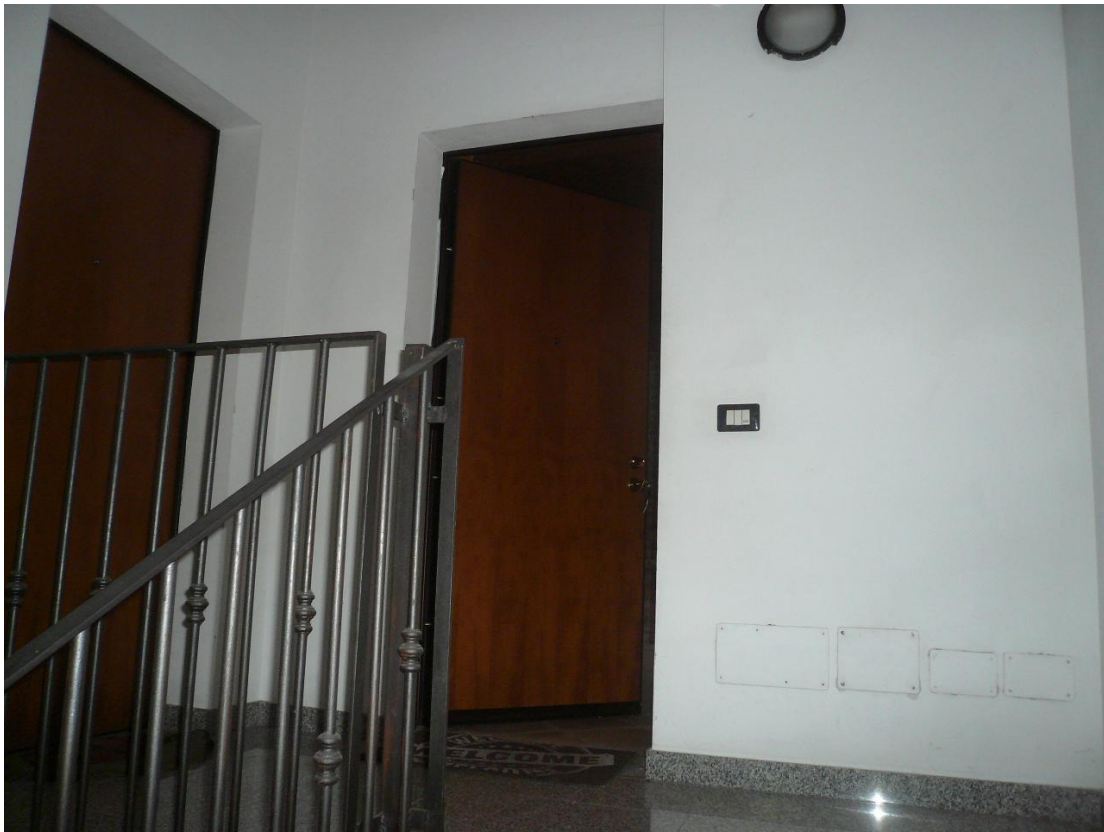
Figura 7 - Particolare ingresso all'alloggio oggetto di stima