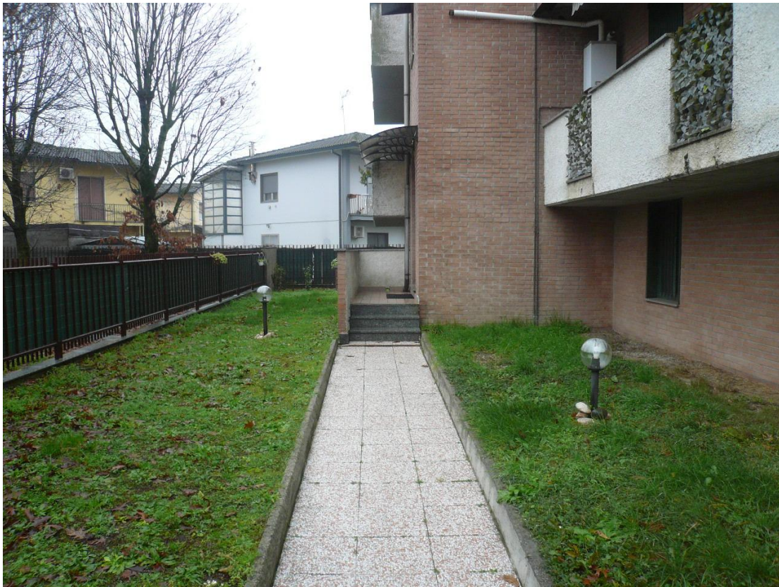
Figura 5 - Particolare parti comuni esterne al fabbricato