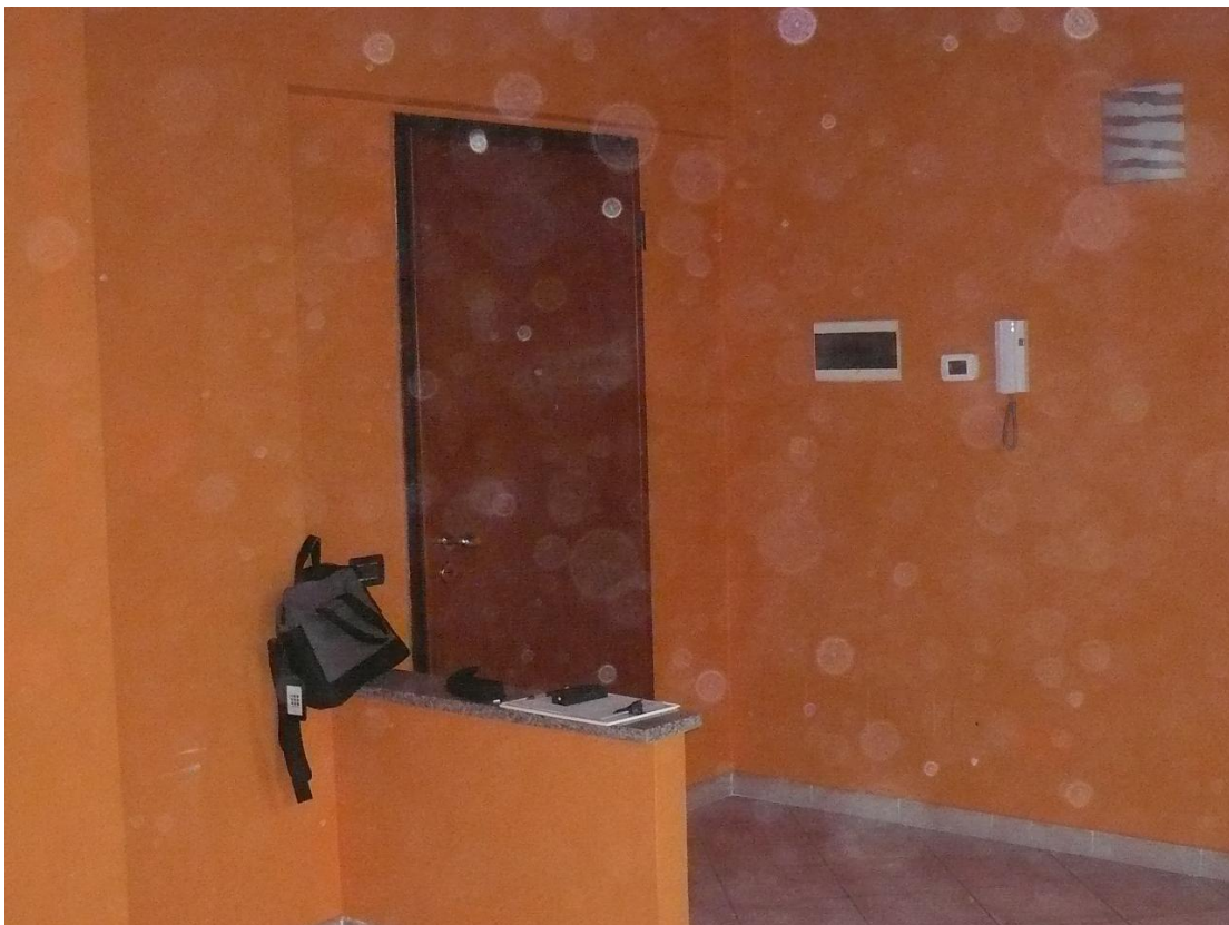
Figura 8 - Particolare locali interni alloggio