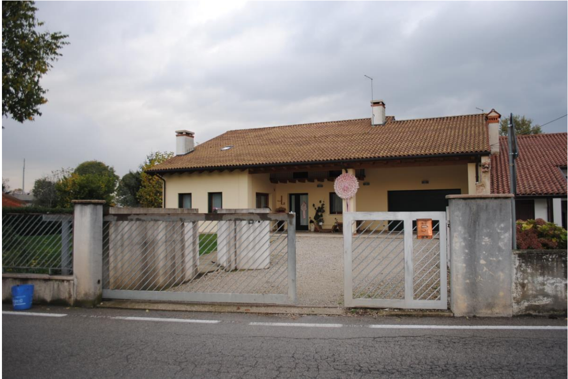
Foto n. 1 - vista da via Ca' Vico