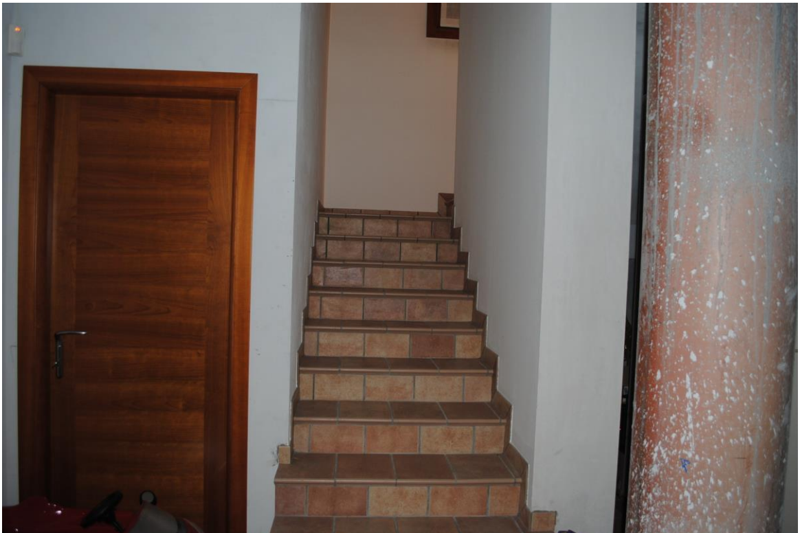
Foto n. 18 – vista interna – scala di collegamento piano terra-interrato