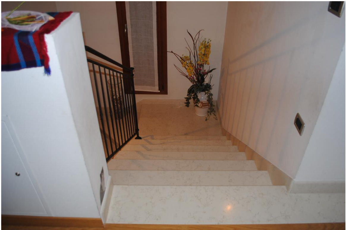
Foto n. 12 – vista interna – scala di collegamento piano terra-primo