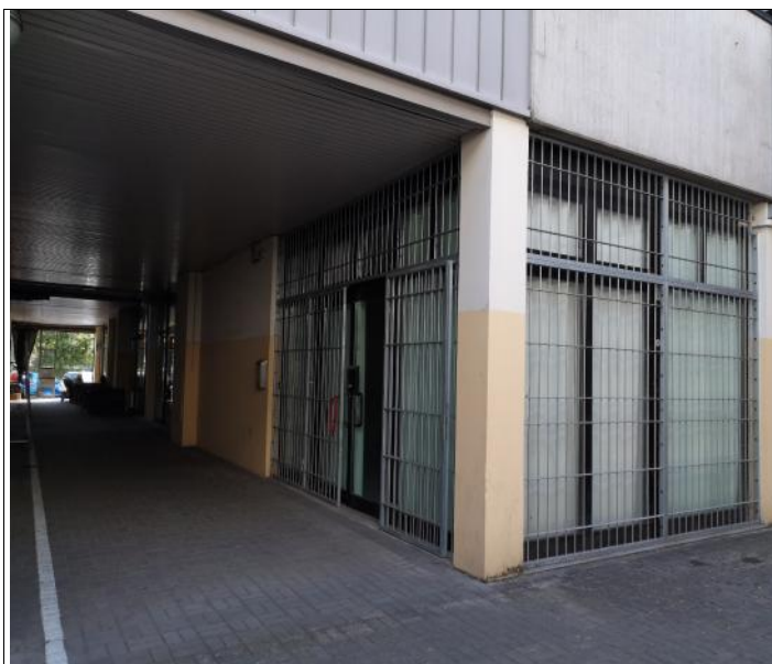
Esterno 1 lotto 1