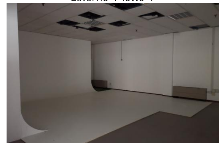
Interno 2 lotto 1