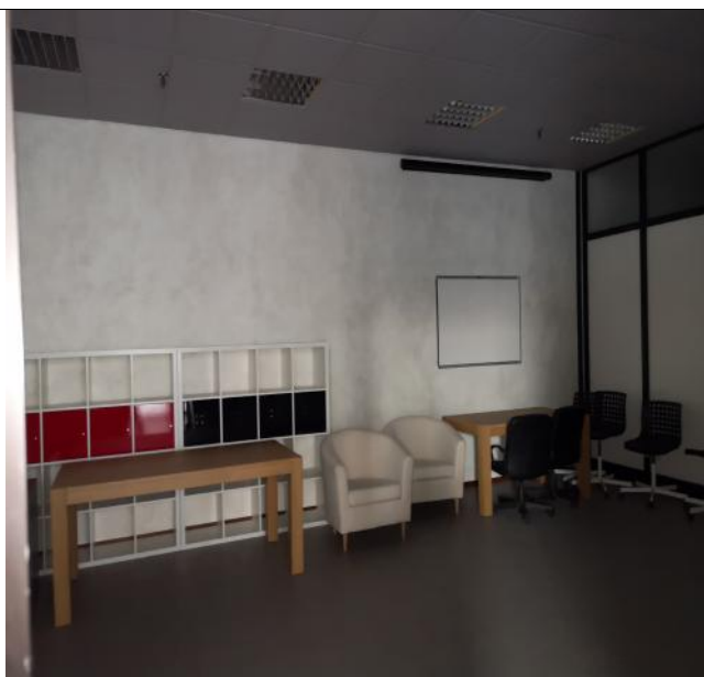
Interno 1 lotto 1