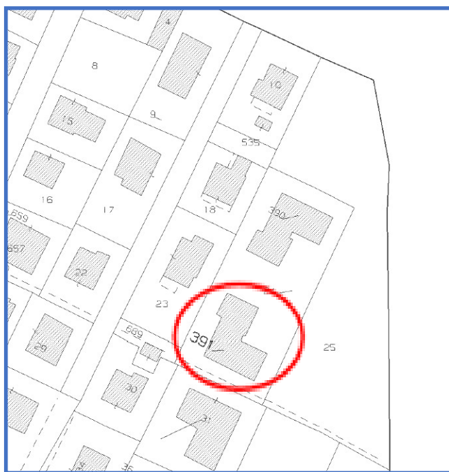
estratto di mappa catastale – fuori scala

L'unità immobiliare oggetto della presente, risulta planimetricamente identificata correttamente nella sua estensione complessiva; si rileva la presenza di tamponamento in muratura lato interno cantina per inibire l'accesso dalla porta dal vano scala (civ. 12).