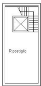
PIANO SEMINTERRATO h = 250 cm