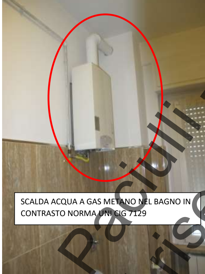
SCALDA ACQUA A GAS METANO NEL BAGNO IN CONTRASTO NORMA UNI CIG 7129