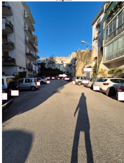
Figura 3 accesso all'immobile pignorato situato nel largo Sanità snc in Capua