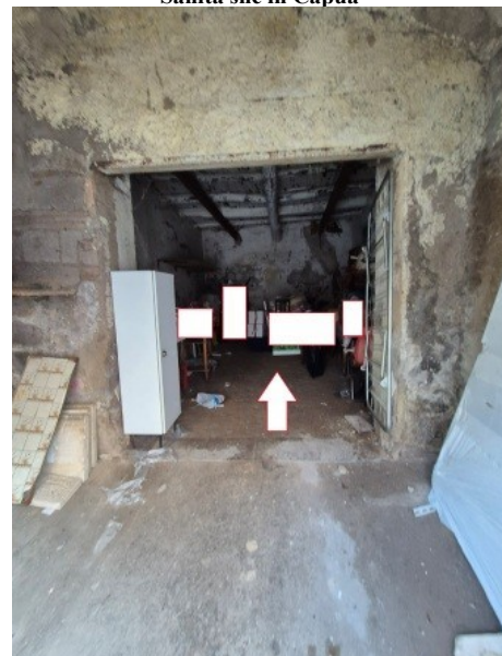
Figura 6 parte anteriore del deposito (ex porticato)