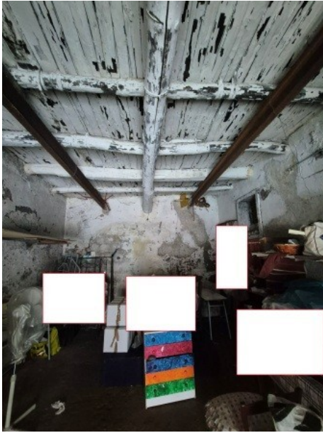
Figura 7 parte più interna del deposito