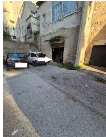
Figura 4 accesso all'immobile pignorato situato nel largo Sanità snc in Capua