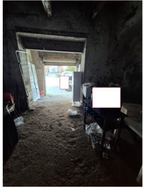
Figura 8 interno del deposito