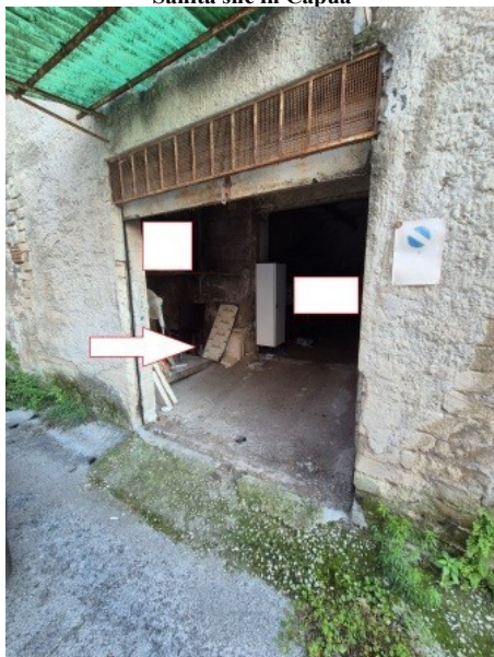
Figura 5 accesso al deposito dal largo Sanità snc in Capua