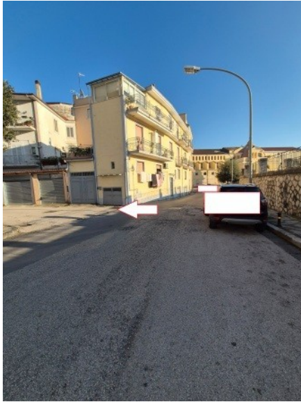
Figura 1 accesso a largo Sanità da via Riviera Casilina in Capua