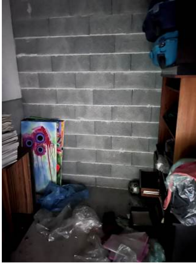
Vista interna subalterno 26