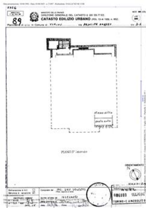
planimetria catastale agli atti del NCEU