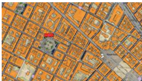
sovrapposizione mappa-carta tecnica, la freccia di colore rosso indica qualitativamente la posizione del fabbricato in cui è ubicata l'u.i. di interesse

I beni sono ubicati in zona centrale (centro storico) in un'area mista residenziale/commerciale, le zone limitrofe si trovano in un'area mista residenziale/commerciale (i più importanti centri limitrofi sono il fabbricato è posto nelle vicinanze delle principali piazze della città (Piazze Castello, San Carlo, Vittorio Veneto, Carlo Alberto e Carlo Emanuele II) e del Museo Egizio). Il traffico nella zona è limitato (zona traffico limitato), i parcheggi sono scarsi. Sono inoltre presenti i servizi di urbanizzazione primaria e secondaria.