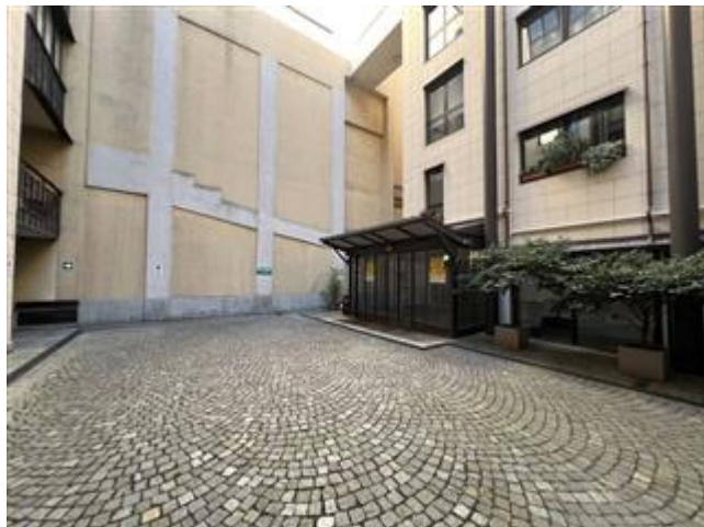
vista del cortile comune e dell'ingresso all'autorimessa