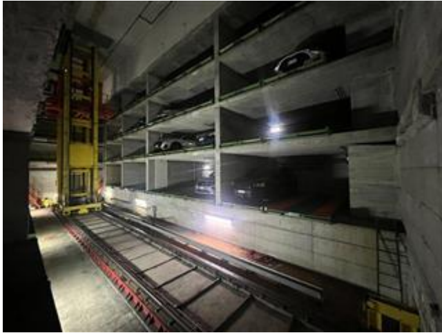
vista generale dell'autosilo