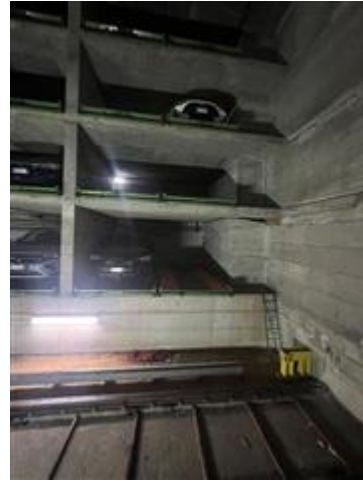
vista del fondo dell'autosilo dove, al piano più basso, si trova l'unità immobiliare oggetto di pignoramento