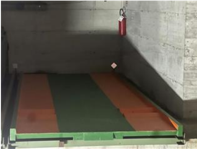
vista del posto auto