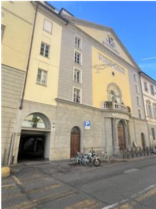
vista della facciata sulla via Principe Amedeo