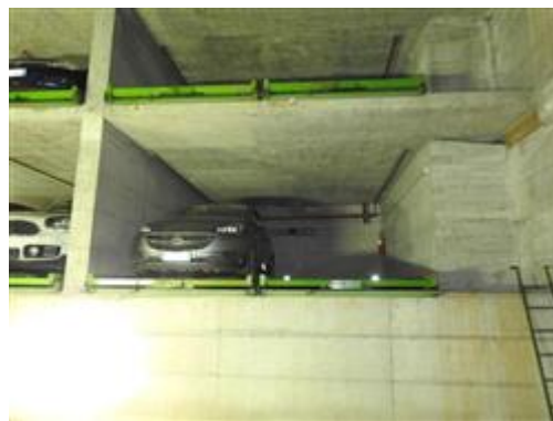
altra vista del posto auto