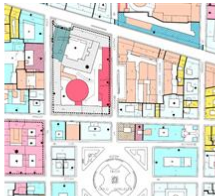
estratto tavola 6 - ZUCS: il fabbricato di interesse è indicato con campitura di colore rosa cipria scuro (edifici costruiti dopo il 1945) e azzurro chiaro in corrispondenza della facciata verso la via Principe Amedeo (edifici residenziali del 700)