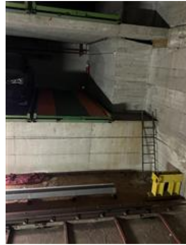
altra vista del posto auto