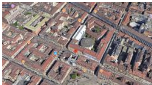
estratto mappa satellitare: la freccia di colore rosso indica qualitativamente la posizione del fabbricato in cui è ubicata l'u.i.