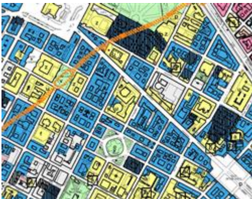
estratto tavola 1 foglio 9a - azzonamento; il fabbricato di interesse è indicato con retino di colore blu che identifica gli edifici appartenenti all'area normativa denominata "Residenza R4"