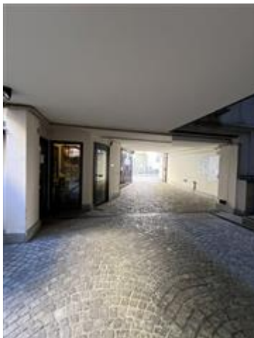
vista dell'androne di ingresso dalla via Principe Amedeo e del locale portineria posto sulla sinistra