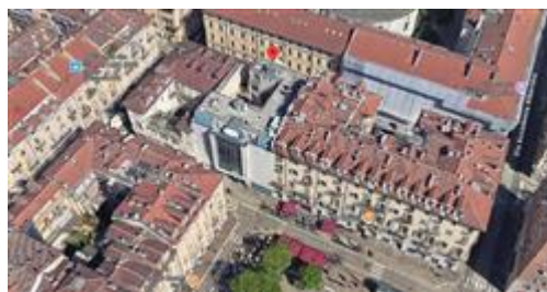
estratto mappa satellitare 3D: la freccia di colore rosso indica qualitativamente la posizione del fabbricato in cui è ubicata l'u.i. di interesse