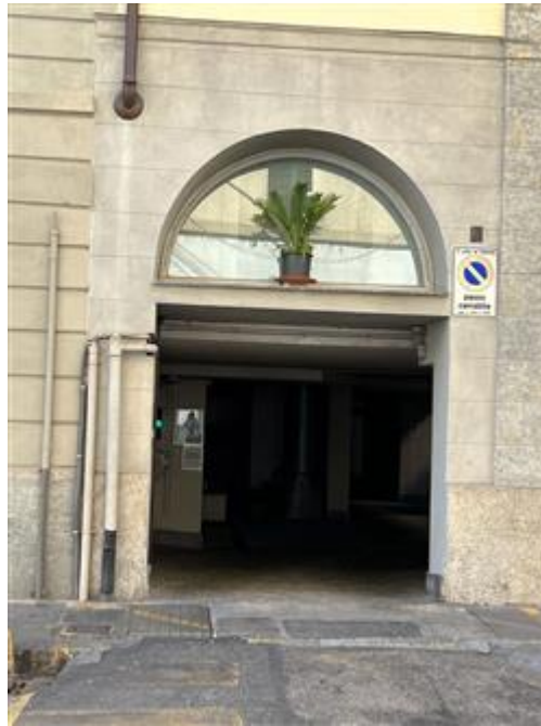
vista del portone di ingresso al cortile comune ed all'autorimessa