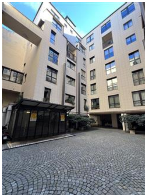
altra vista del cortile comune e dell'ingresso all'autorimessa