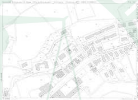
Foto - Estratto di mappa