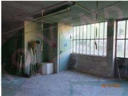
Foto - Piano seminterrato