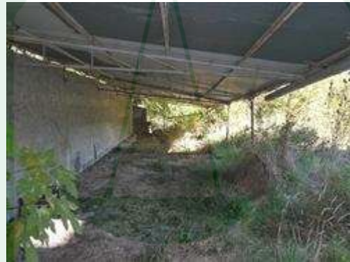
Foto - Tettoia