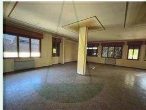
Foto - Piano terra