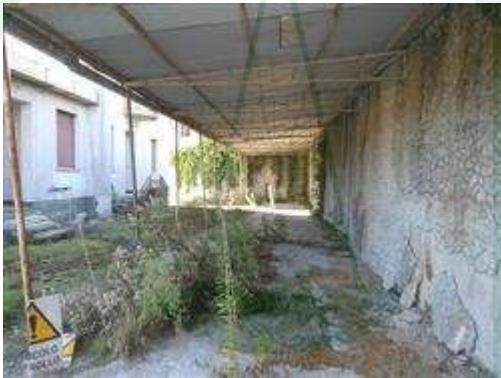
Foto - Tettoia