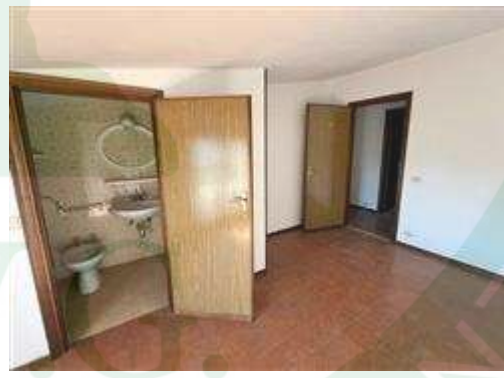
Foto - Camere hotel