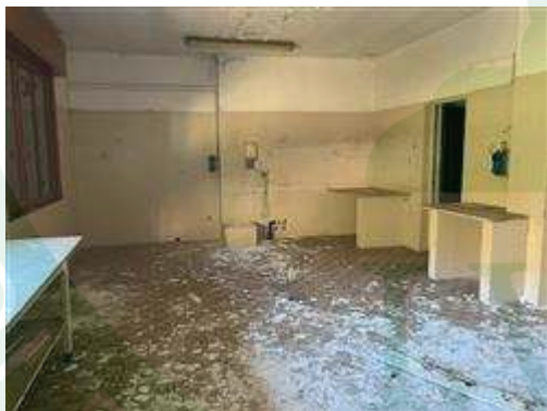
Foto - Piano terra