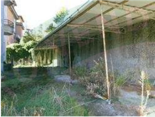
Foto - Tettoia