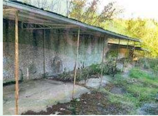
Foto - Tettoia