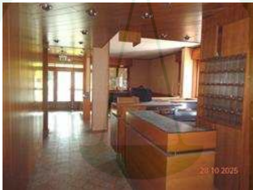
Foto - Piano terra