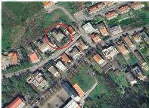
Foto - Vista satellitare compendio

La località di Bagni di Tabiano si trova a circa 40 Km da Parma ed è situata sulle colline nella zona sud-est della provincia a pochi km dal confine con la limitrofa provincia di Piacenza. Posta a circa una decina di Km da Salsomaggiore Terme, il capoluogo di Comune, la cittadina è famosa per le proprietà terapeutiche delle sue acque, gode di tutti i servizi ed è dotata di numerose strutture ricettive. La frazione è facilmente raggiungibile con mezzi propri oppure utilizzando i servizi di trasporto urbano che la collegano più volte al giorno, sia con i comuni limitrofi, che con la città di Parma. Il bene oggetto di stima si trova in prossimità del centro del paese e di tutti i servizi ivi presenti.