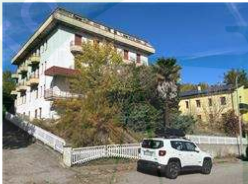
Foto - Vista fronte strada

Come desumibile dall'estratto di mappa, i beni oggetto di relazione comprensivi dell'area cortiliva esterna di pertinenza considerati nel loro insieme confinano: a nord con i mappali 643 e 642, a ovest con il mappale 252, a sud con la pubblica via (v.le Maria Luigia), a est con i mappali 642, 251 e 714.