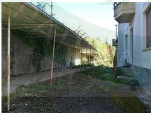
Foto - Tettoia

Tettoia a SALSOMAGGIORE TERME Viale Maria Luigia 27, frazione Bagni di Tabiano per la quota di 1/1 di piena proprietà ( *** DATO OSCURATO *** ). Il bene è così censito al Catasto Fabbricati: foglio 37 particella 250 sub. 4, categoria C/7, superficie 147, classe U, consistenza 147 mq, rendita 91,10 Euro, indirizzo catastale: VIALE MARIA LUIGIA n. 27 SALSOMAGGIORE TERME, piano: T.