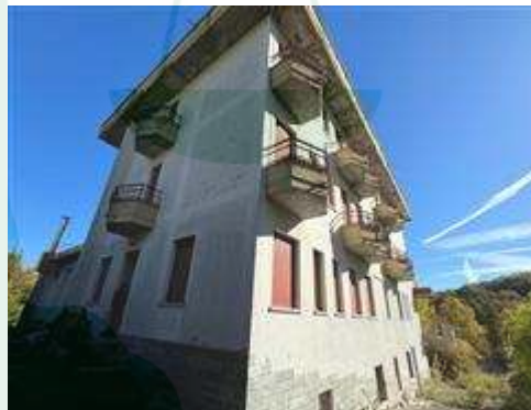
Foto - Prospetto nord-ovest