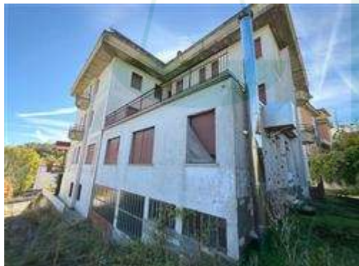
Foto - Prospetto est