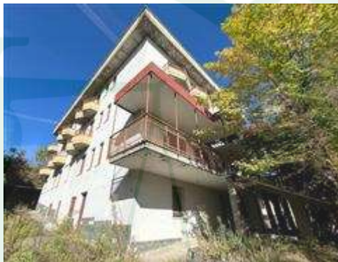
Foto - Vista fronte strada