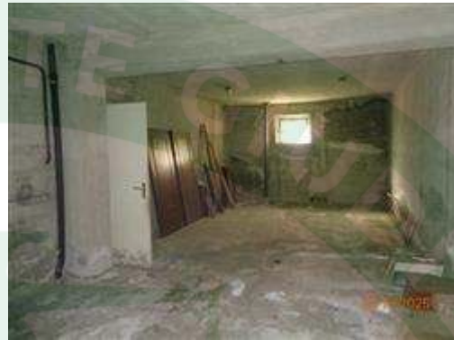
Foto - Piano seminterrato