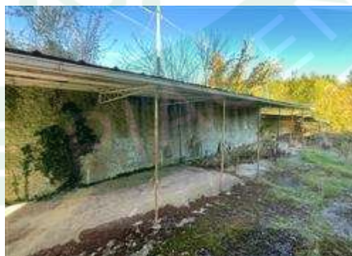
Foto - Tettoia