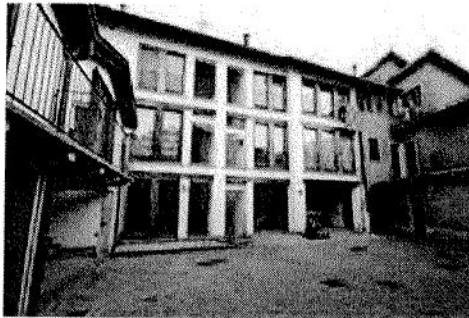
Vista da cortile condominiale