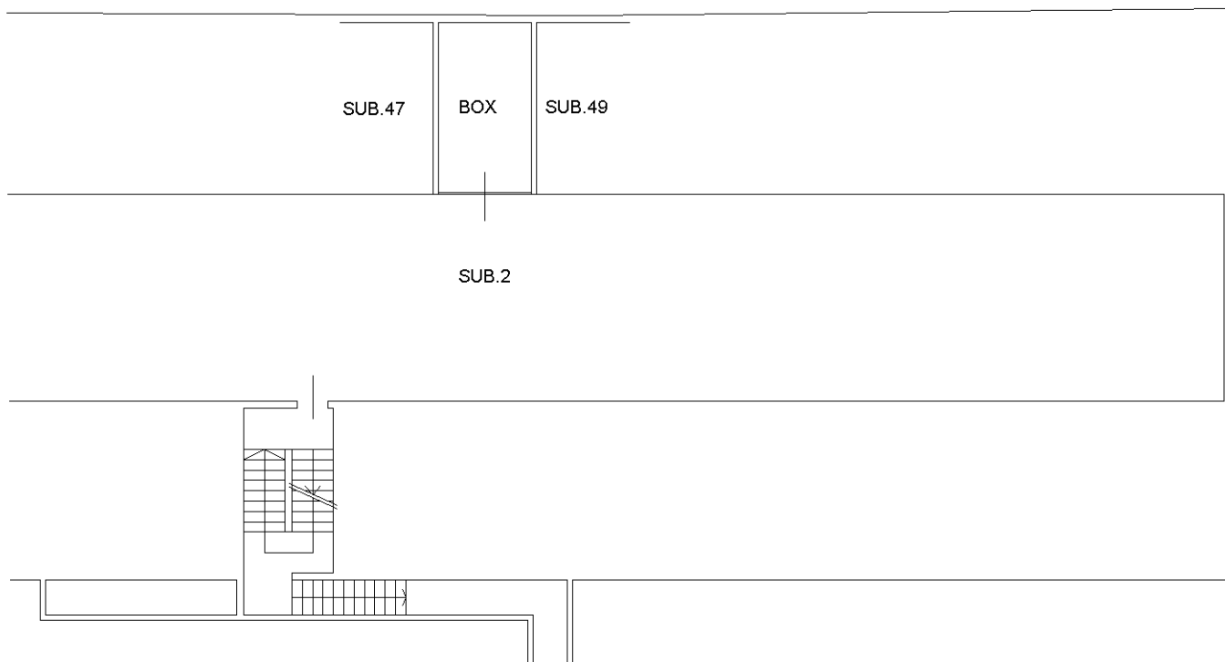
PIANTA PIANO PRIMO INTERRATO H.=Mt.2.40