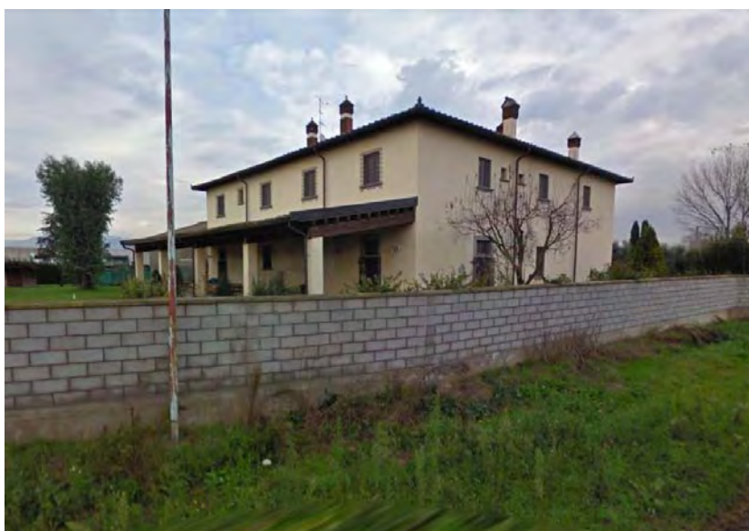
Casa colonica di via Giramonte

Scorcio da via di Giramonte - Fronti orientale e meridionale