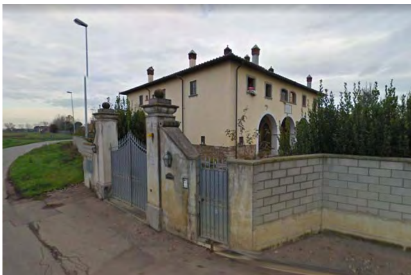
Casa colonica di via Giramonte

Scorcio da via di Giramonte - Fronti orientale e meridionale