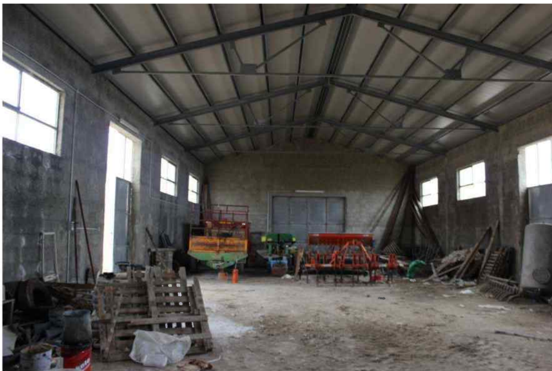
Foto 22 - Interno Fabbricato Censito al mappale 603 sub.1 - Porzione G