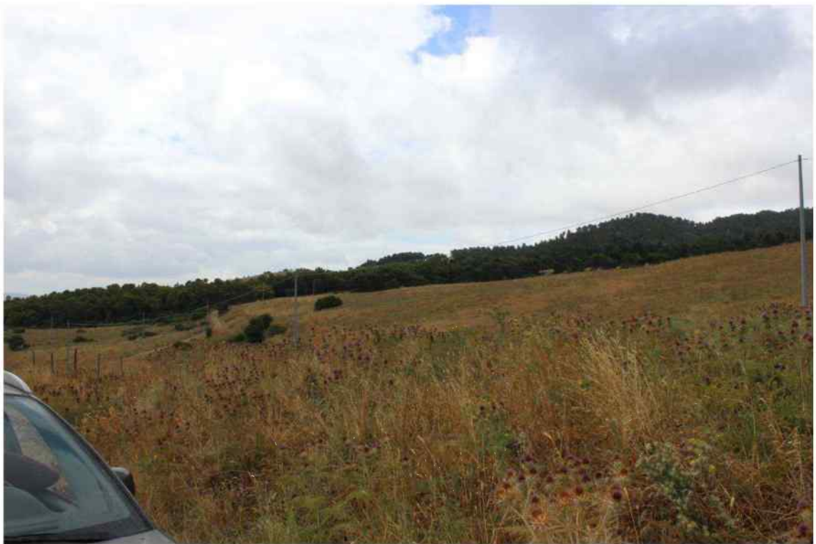
Foto 3-Terreno Censito al foglio 5 mappale 69