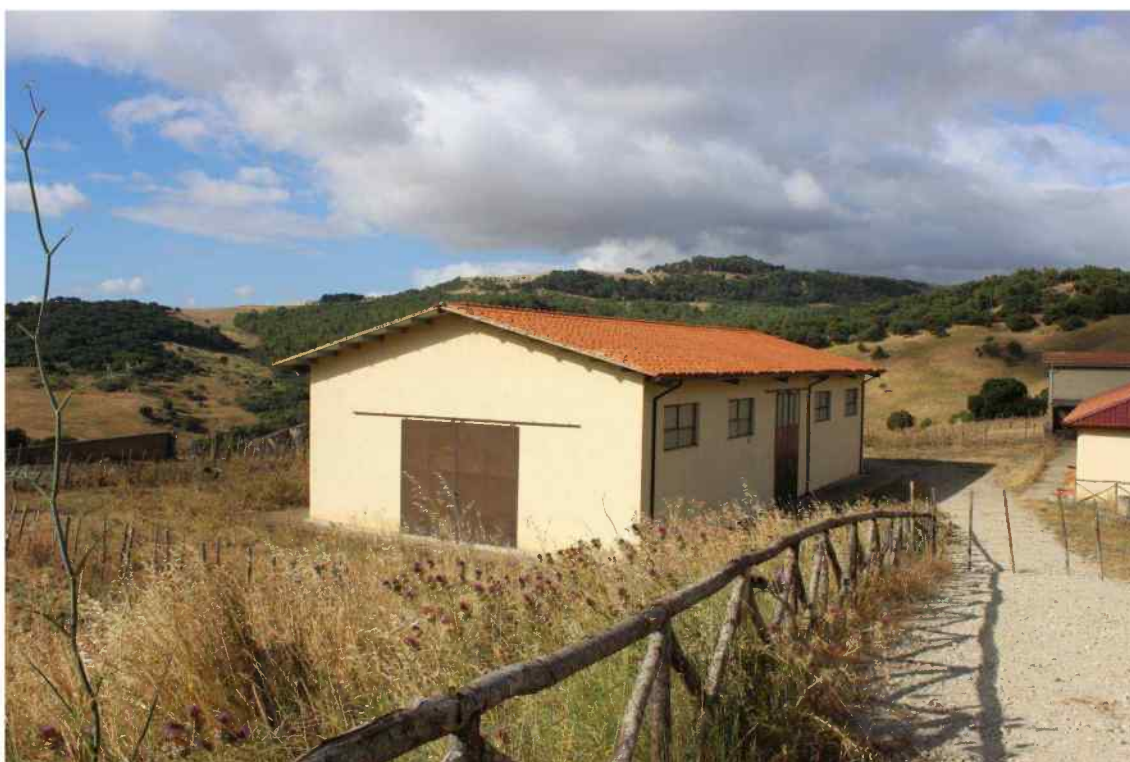
Foto 21 - esterno Fabbricato Censito al mappale 603 sub.1 - Porzione G