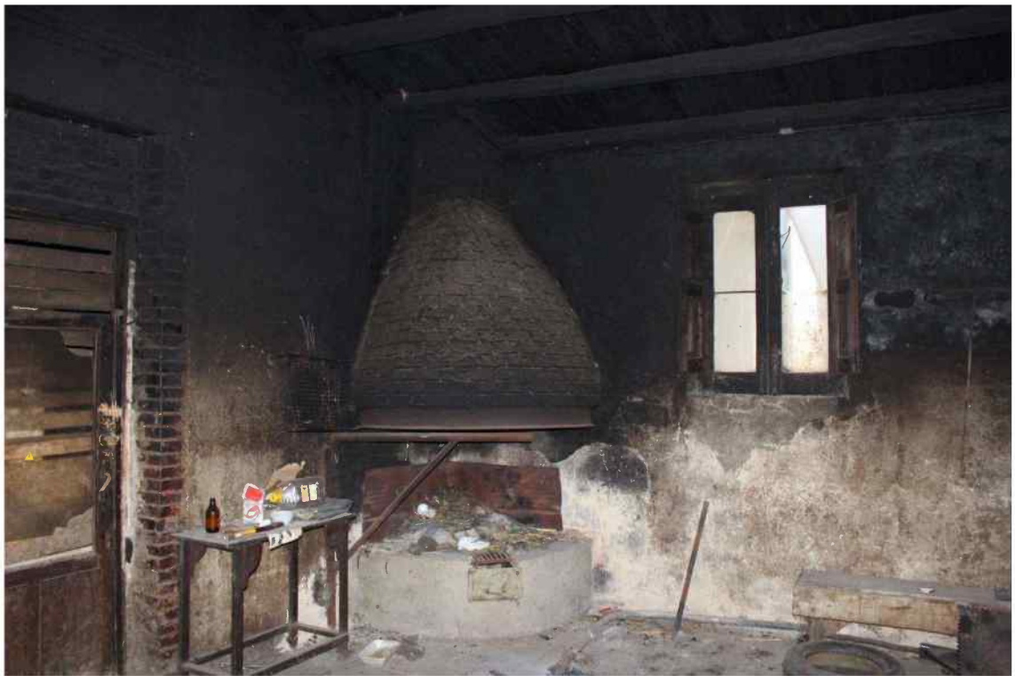
Foto 9 - Interno Fabbricato Censito al mappale 603 sub.1 - Porzione C