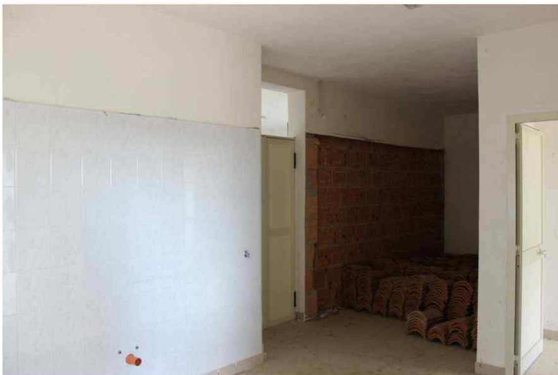
Foto 26- Interno Fabbricato Censito al mappale 603 sub.1 - Porzione H - Minicaseificio