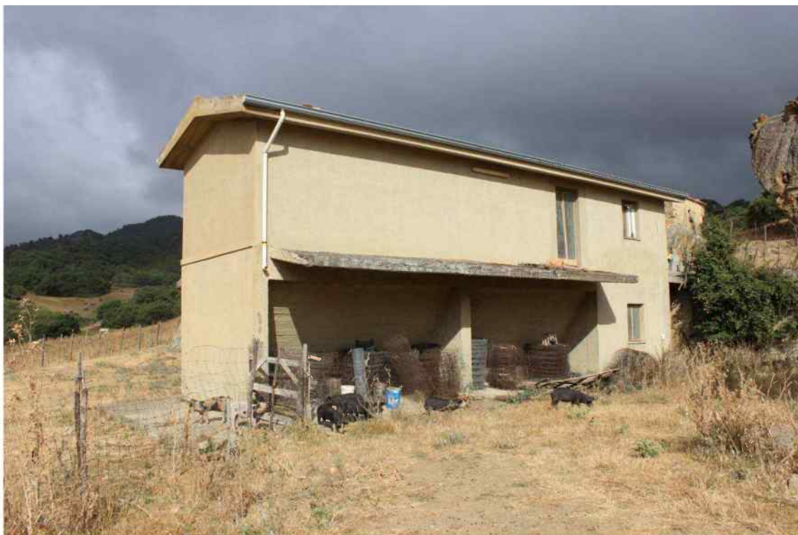
Foto 43 -Esterno Fabbricato Censito al mappale 603 sub.1 - Porzione L – Ovile