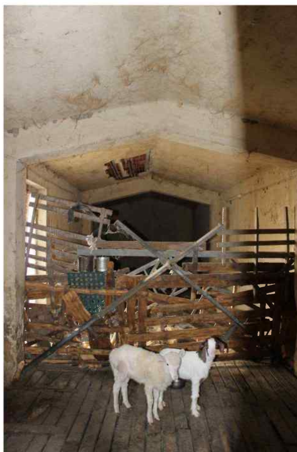
Foto 46 -Interno Fabbricato Censito al mappale 603 sub.1 - Porzione L – Ovile