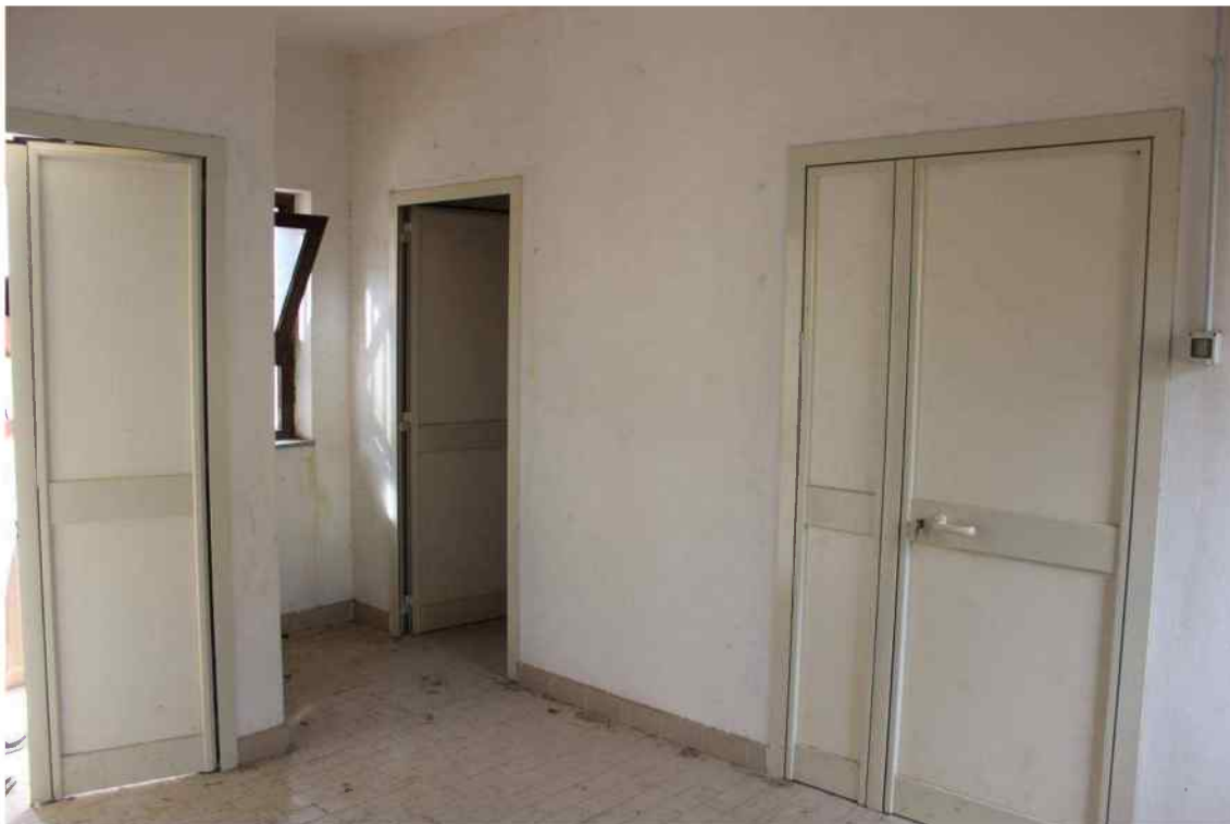
Foto 34 - Interno Fabbricato Censito al mappale 603 sub.1 - Porzione H – Minicaseificio