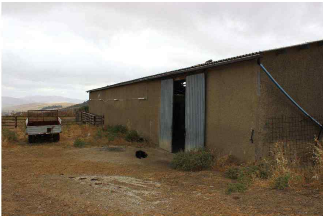
Foto 1-Esterno Fabbricato Censito al mappale 603 sub.1 - Porzione B