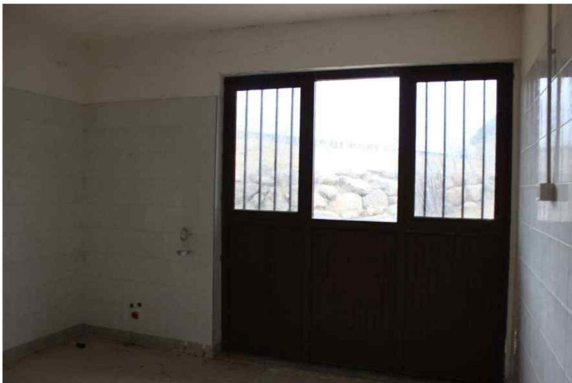
Foto 36 - Interno Fabbricato Censito al mappale 603 sub.1 - Porzione H – Minicaseificio