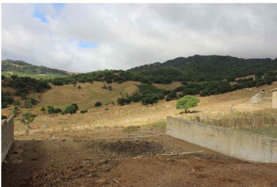
Foto 17 - Immobile Censito al mappale 603 sub.1 - Concimaia - Porzione D