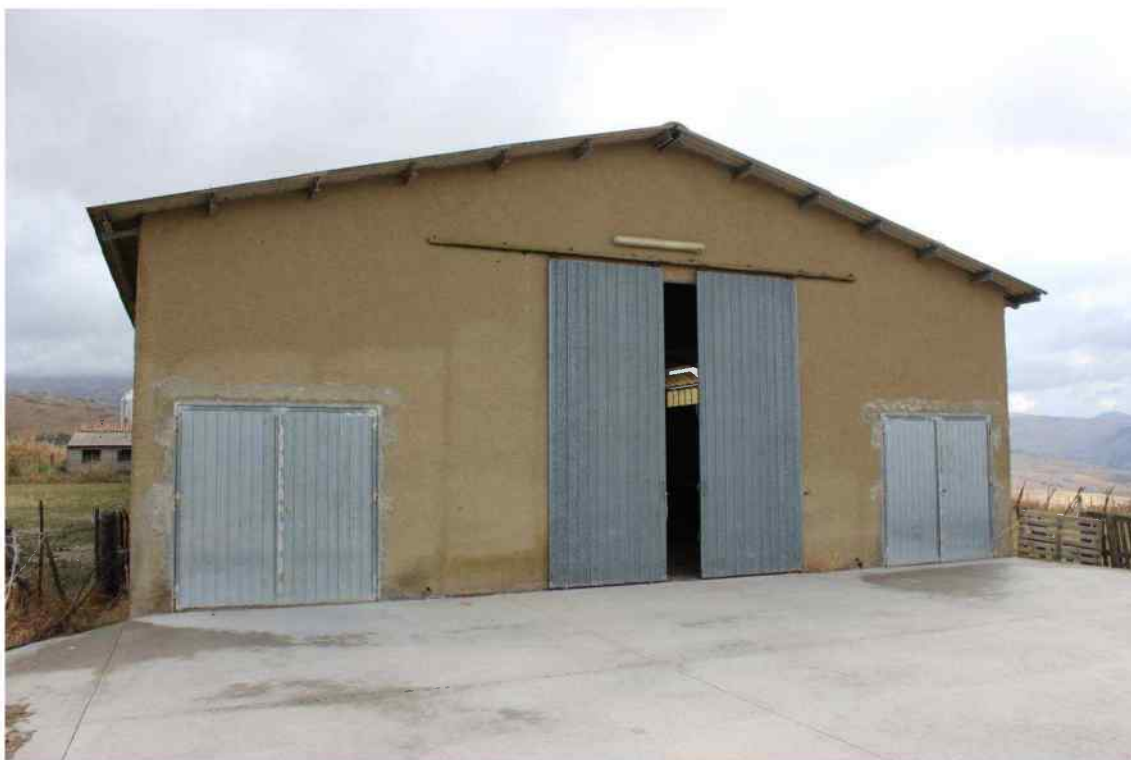
Foto 12 - Esterno Fabbricato Censito al mappale 603 sub.1 - Porzione D