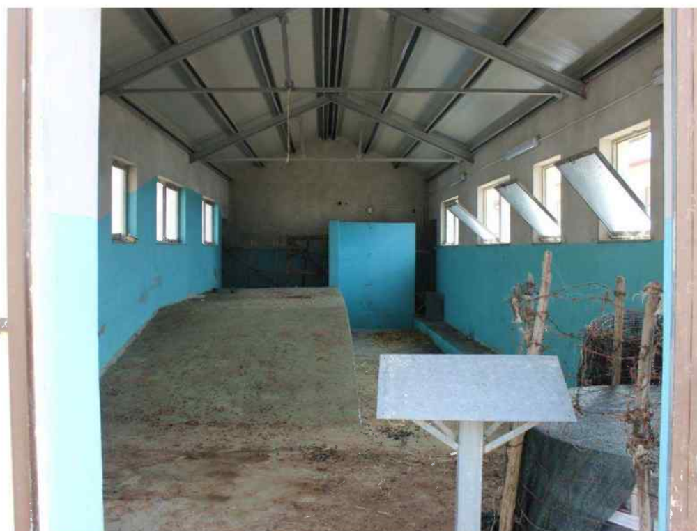
Foto 42 - Interno Fabbricato Censito al mappale 603 sub.1 - Porzione I – Sala Mungitura