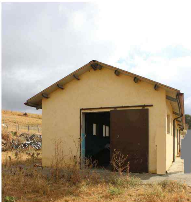
Foto 39 - Estero Fabbricato Censito al mappale 603 sub.1 - Porzione I – Sala Mungitura