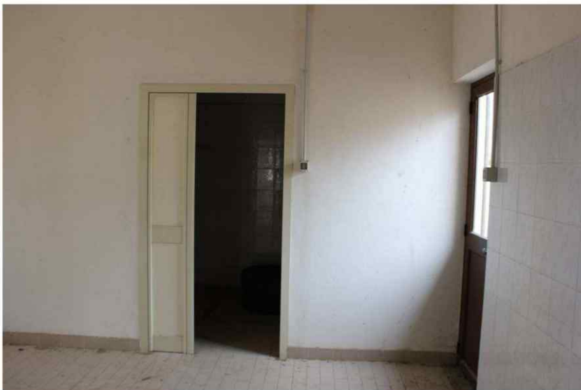
Foto 35 - Interno Fabbricato Censito al mappale 603 sub.1 - Porzione H – Minicaseificio