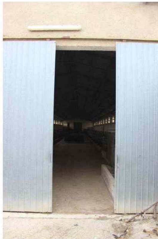
Foto 14 - Esterno Fabbricato Censito al mappale 603 sub.1 - Porzione D