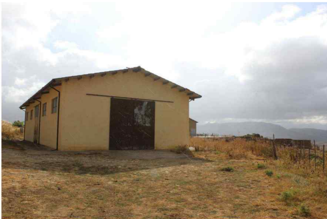
Foto 20 - Esterno Fabbricato Censito al mappale 603 sub.1 - Porzione G