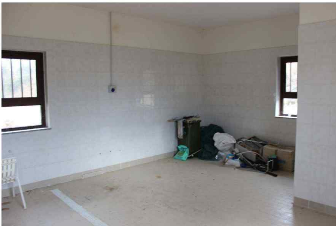
Foto 32 - Interno Fabbricato Censito al mappale 603 sub.1 - Porzione H – Minicaseificio