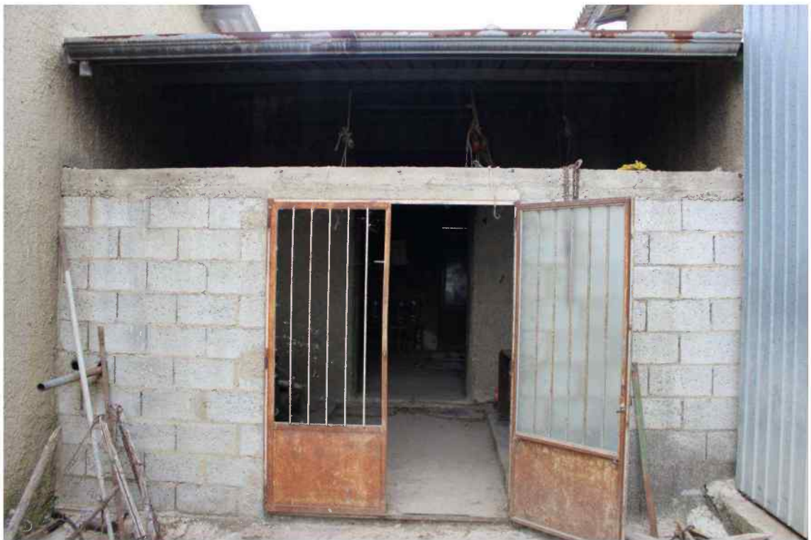
Foto 7 - Esterno Fabbricato Censito al mappale 603 sub.1 - Porzione C