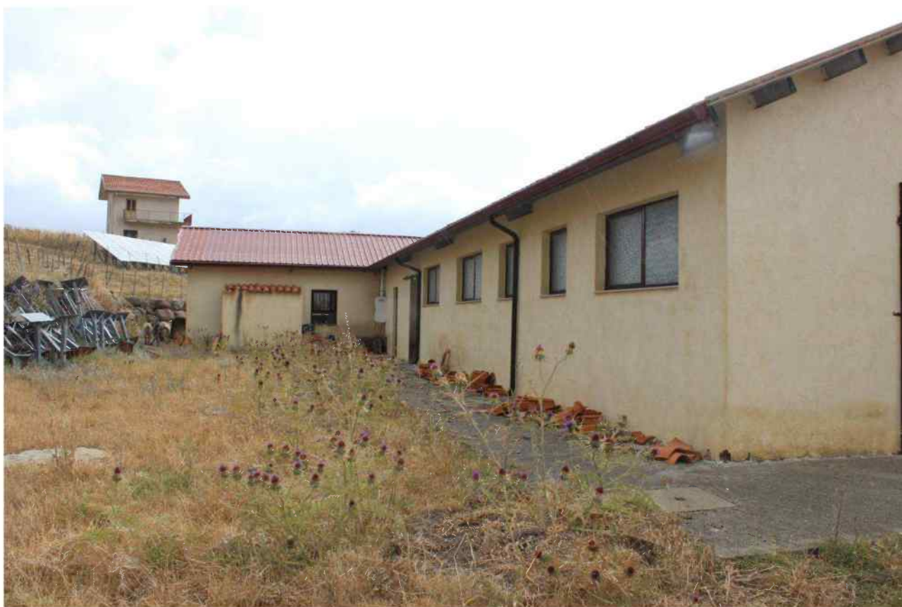
Foto 40 - Estero Fabbricato Censito al mappale 603 sub.1 - Porzione I – Sala Mungitura