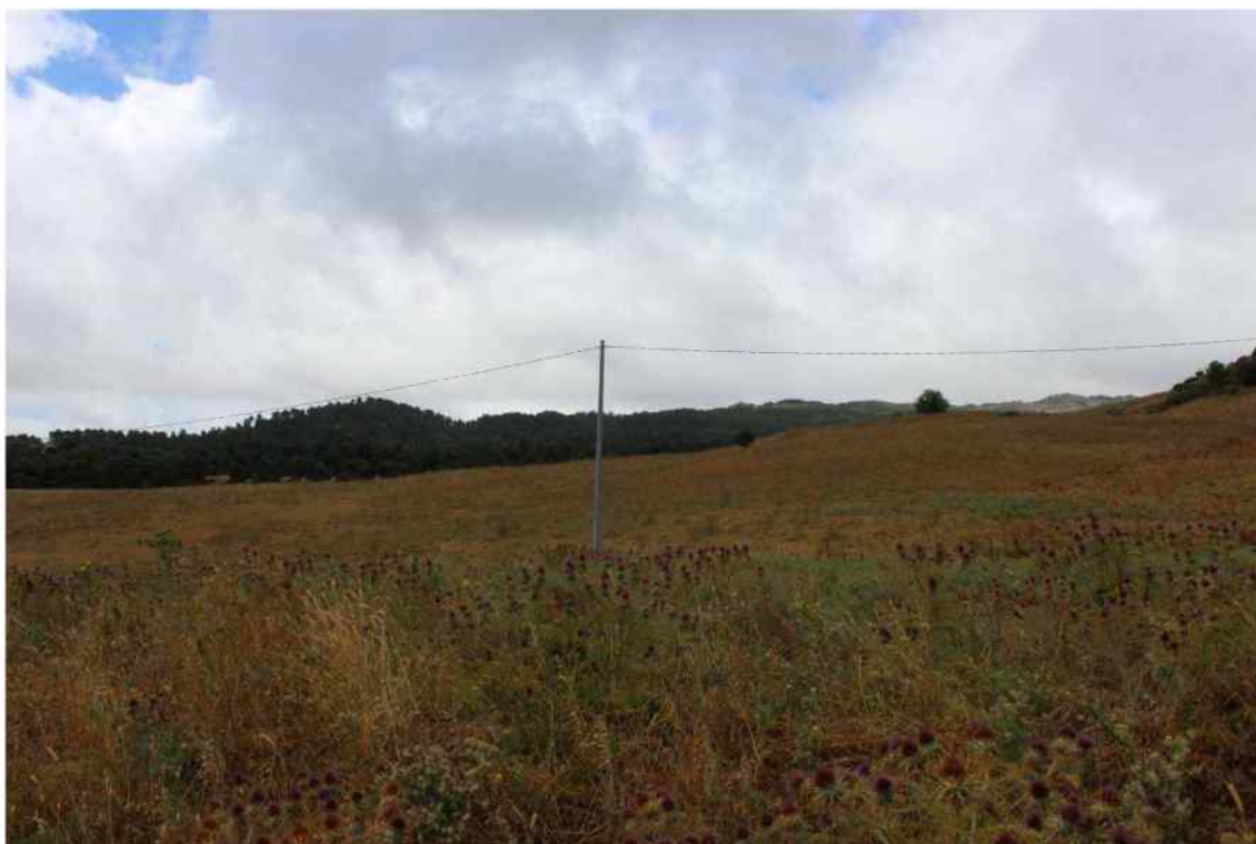
Foto 2-Terreno Censito al foglio 5 mappale 69