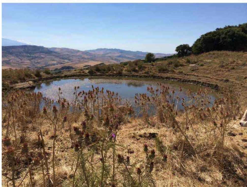
Foto 6 - Laghetto Collinare presente sulla particella 16