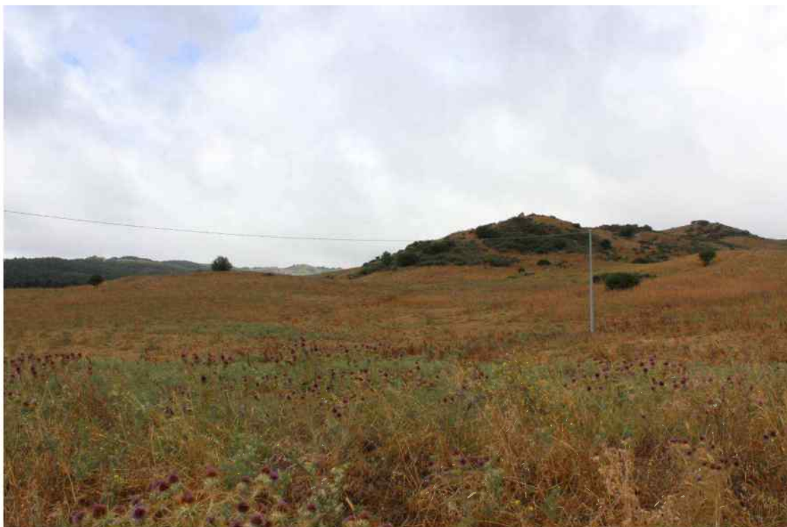
Foto 1-Terreno Censito al foglio 5 mappale 69