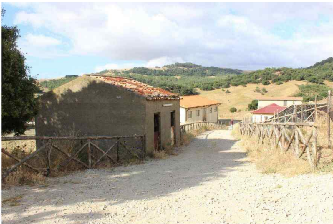
Foto 18 - Esterno Fabbricato Censito al mappale 603 sub.1 - Porzione F