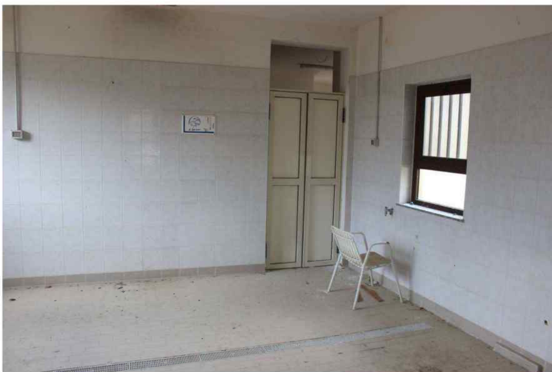
Foto 33 - Interno Fabbricato Censito al mappale 603 sub.1 - Porzione H – Minicaseificio