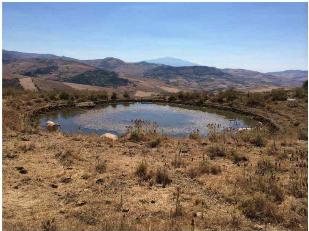
Foto 7 - Laghetto Collinare presente sulla particella 16