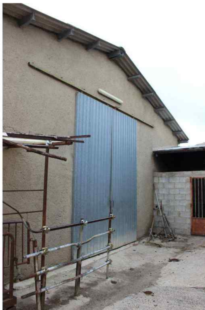
Foto 13 - Esterno Fabbricato Censito al mappale 603 sub.1 - Porzione D