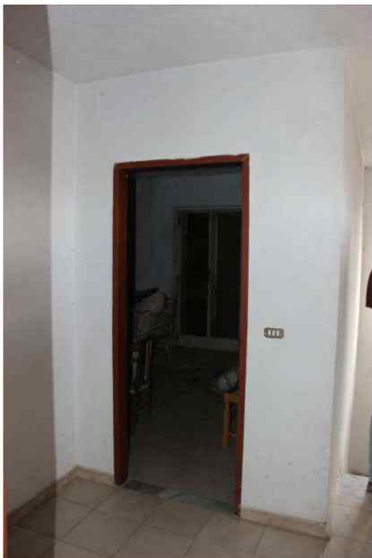
Foto -9 interno P.1.