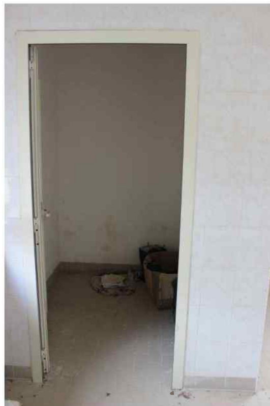
Foto 28 /29/30/31- Interno Fabbricato Censito al mappale 603 sub.1 - Porzione H – Minicaseificio