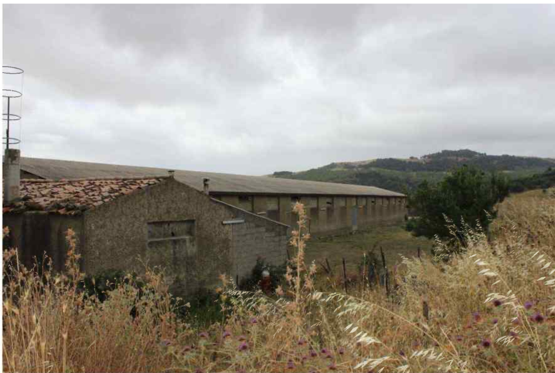
Foto 5 - Esterno Fabbricato Censito al mappale 603 sub.1 - Porzione C