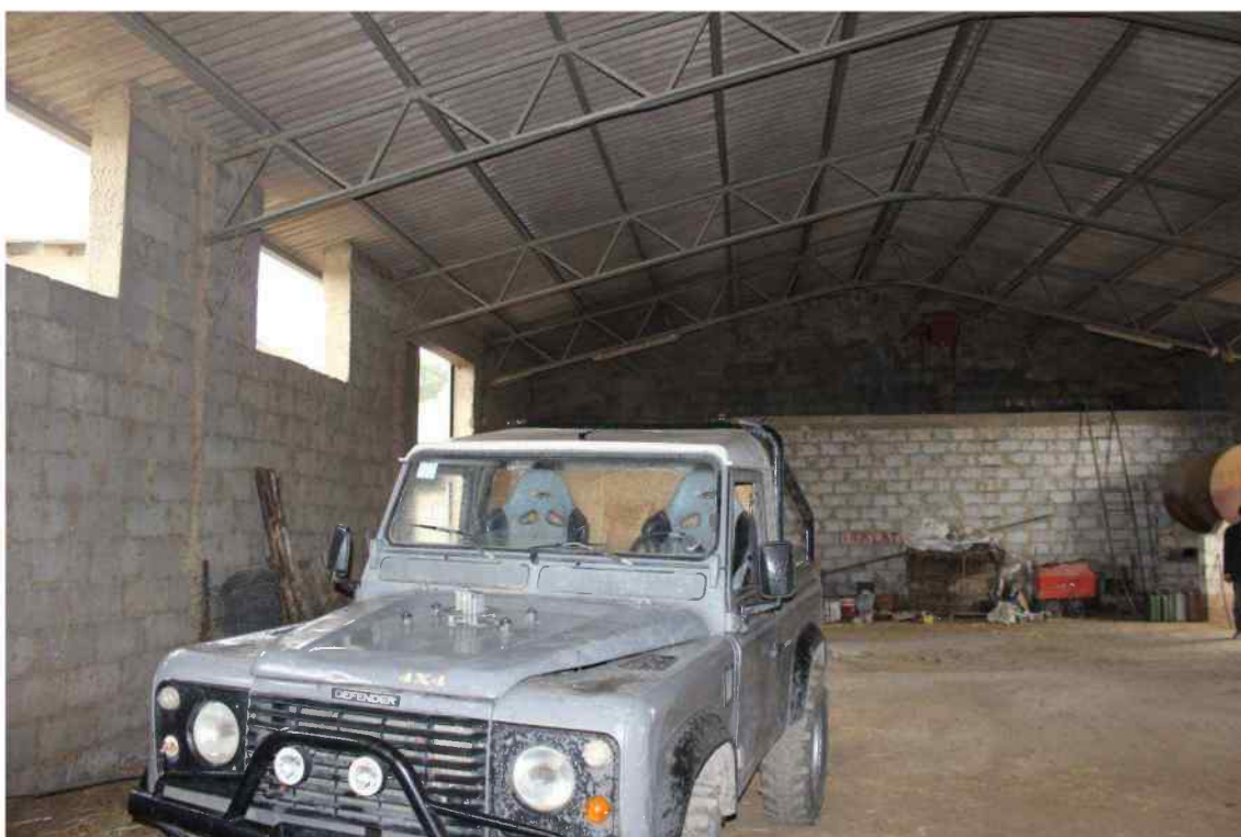
Foto 4 - Interno Fabbricato Censito al mappale 603 sub.1 - Porzione B