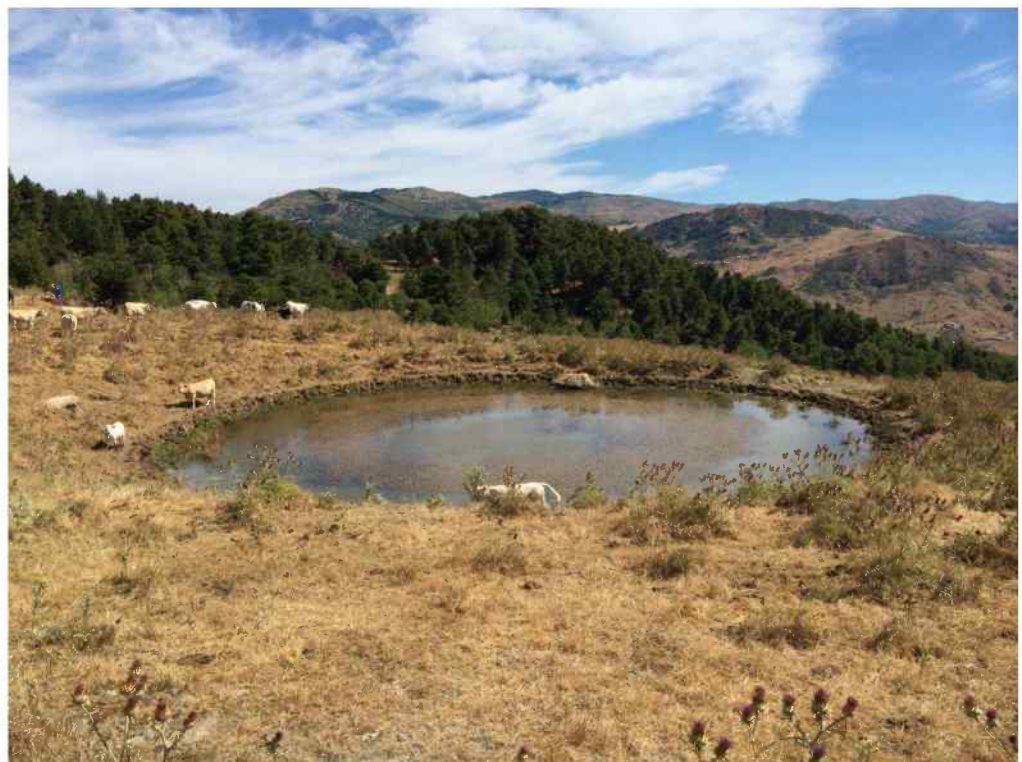
Foto 8 - Laghetto Collinare presente sulla particella 16