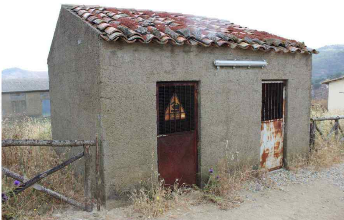
Foto 19 - Esterno Fabbricato Censito al mappale 603 sub.1 - Porzione F