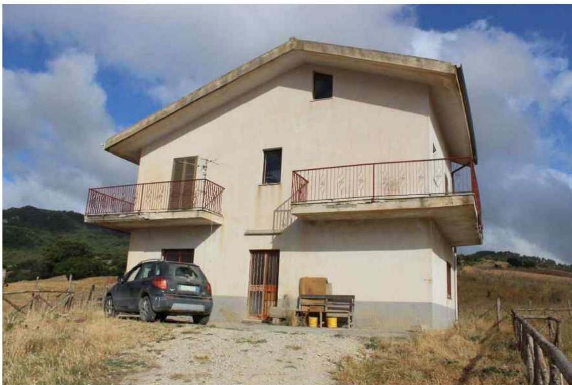
Foto 1 - esterno