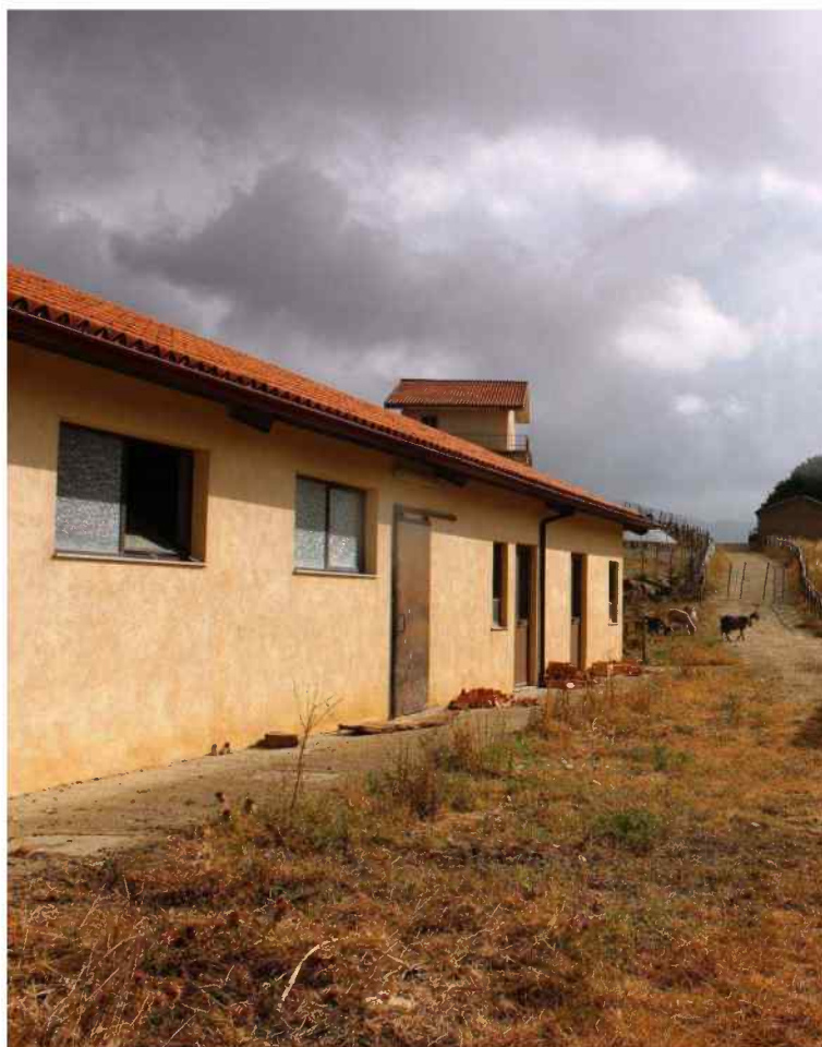
Foto 25 - Estero Fabbricato Censito al mappale 603 sub.1 - Porzione H – Minicaseificio