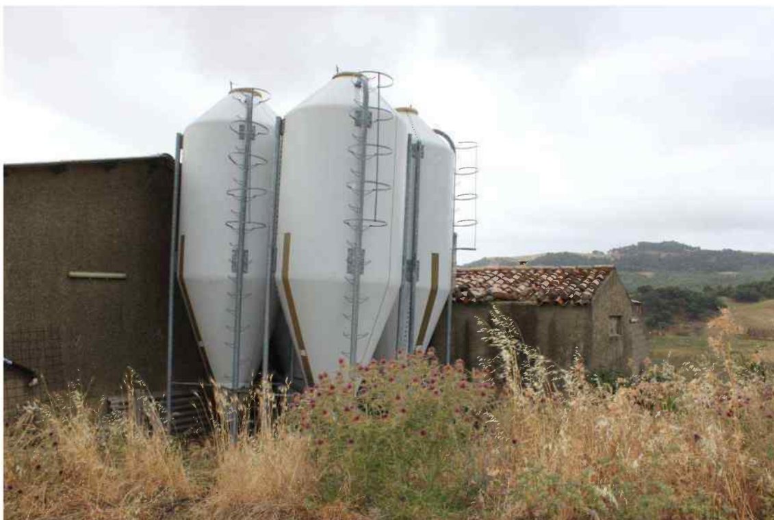
Foto 6 - Esterno Fabbricato Censito al mappale 603 sub.1 - Porzione C