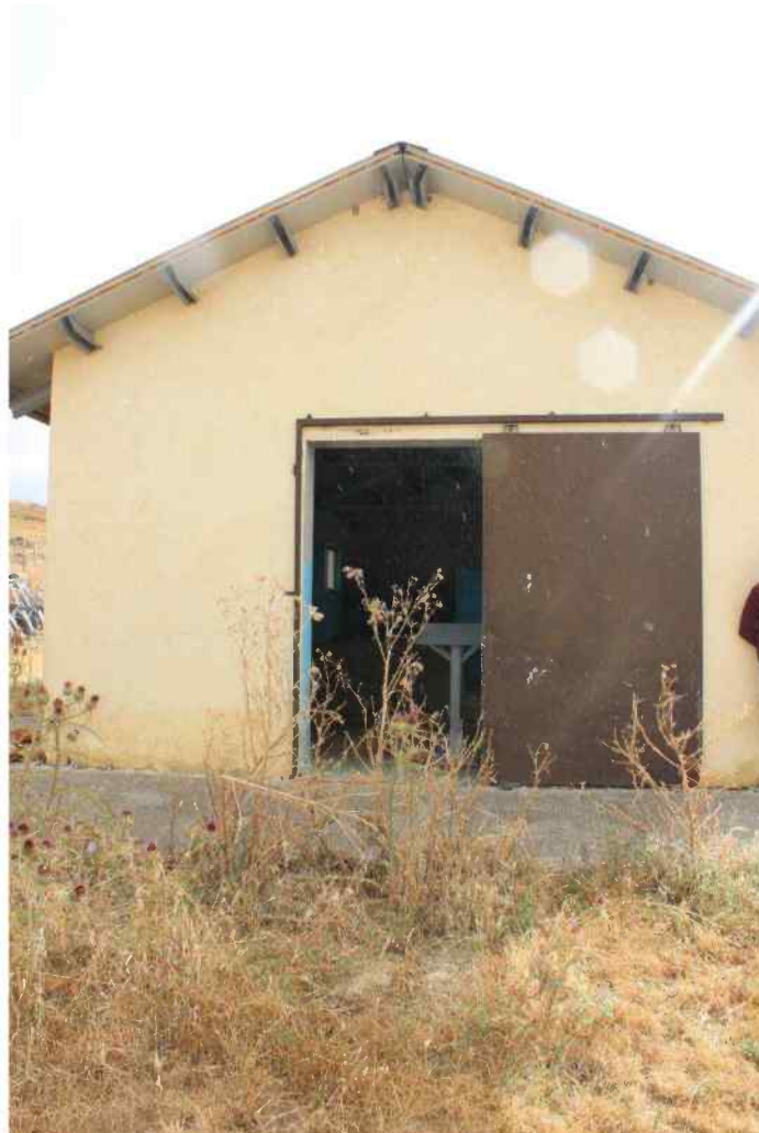
Foto 41 - Estero Fabbricato Censito al mappale 603 sub.1 - Porzione I – Sala Mungitura