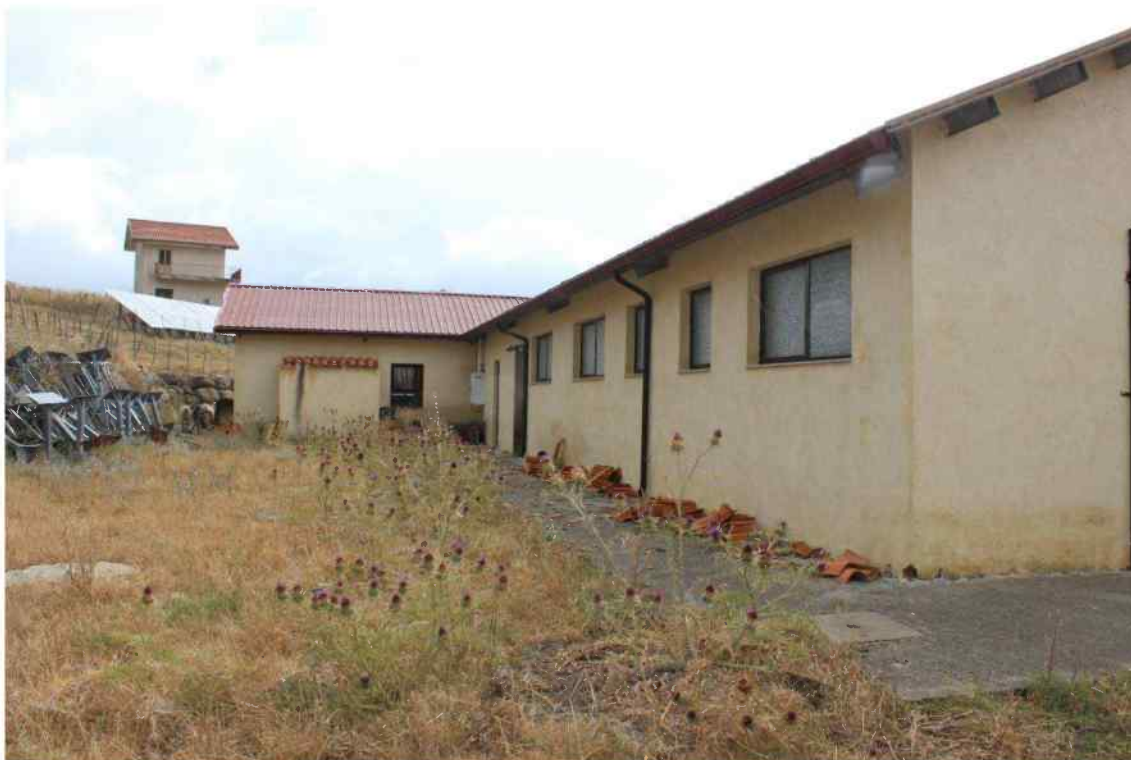
Foto 24 - Estero Fabbricato Censito al mappale 603 sub.1 - Porzione H – Minicaseificio