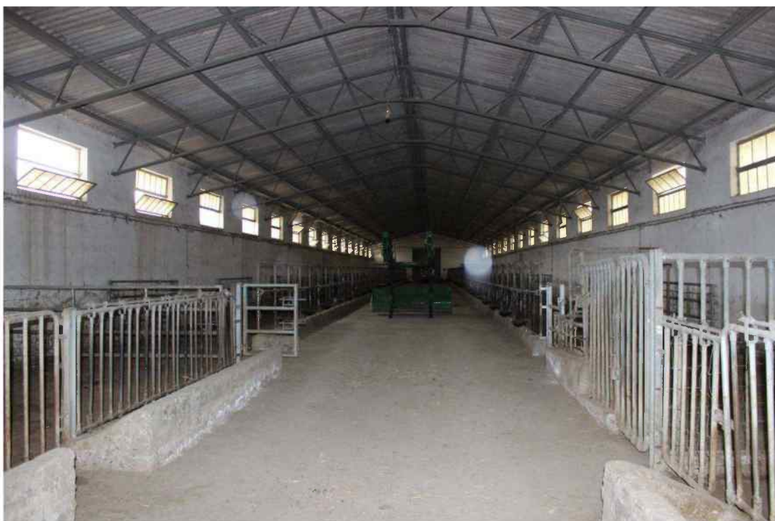
Foto 15 - Interno Fabbricato Censito al mappale 603 sub.1 - Porzione D