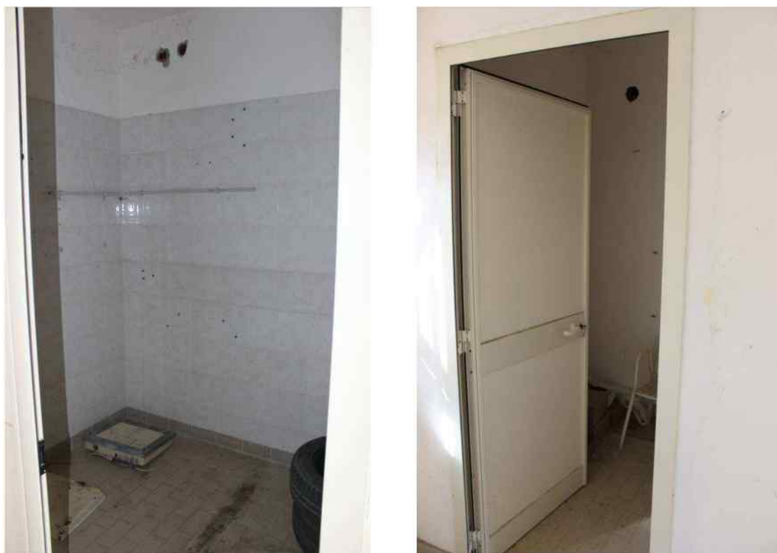
Foto 37/38 Interno Fabbricato Censito al mappale 603 sub.1 - Porzione H – Minicaseificio