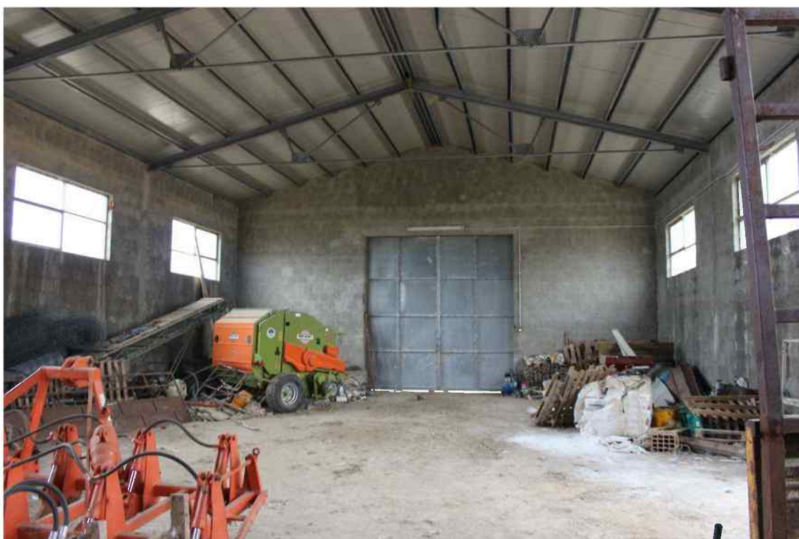
Foto 23 - Interno Fabbricato Censito al mappale 603 sub.1 - Porzione G