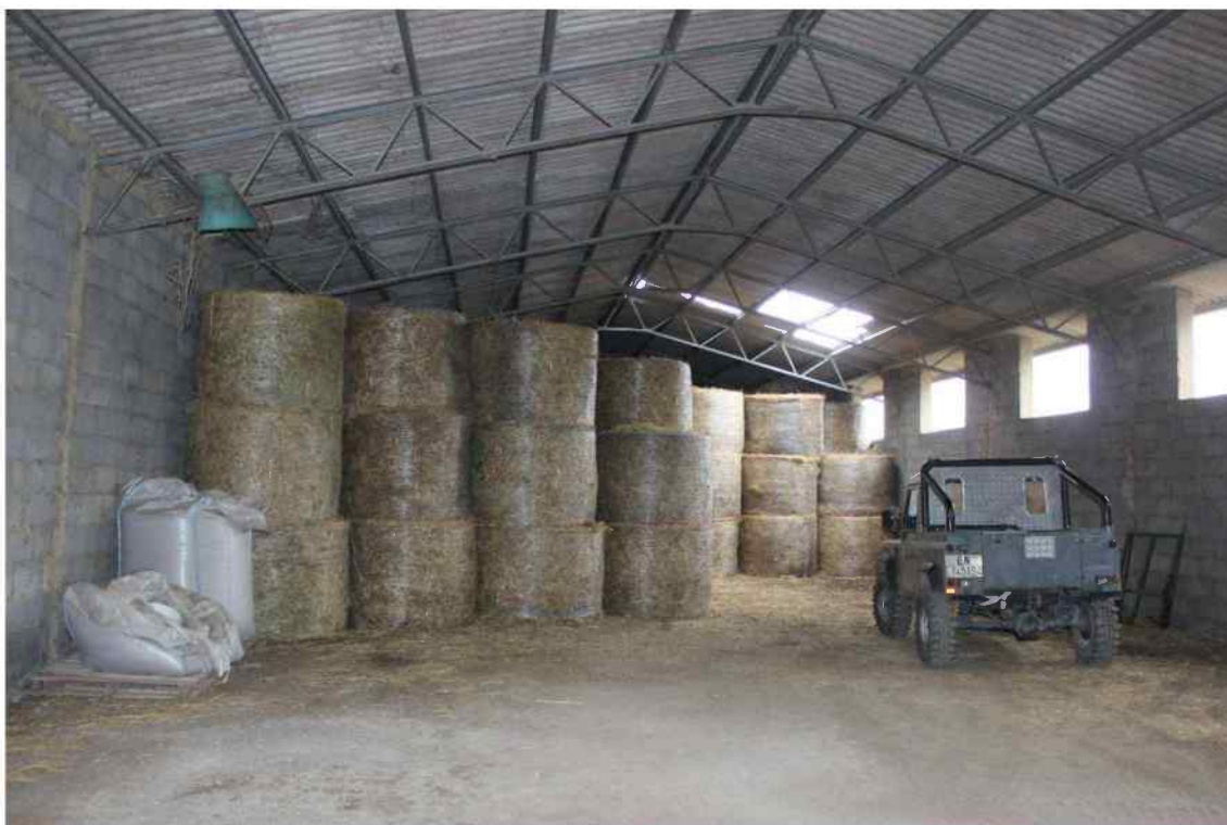
Foto 3 - Interno Fabbricato Censito al mappale 603 sub.1 - Porzione B