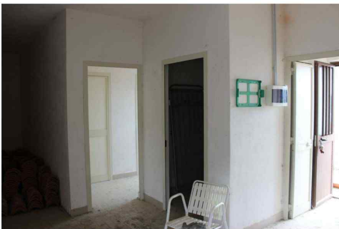
Foto 27 - Interno Fabbricato Censito al mappale 603 sub.1 - Porzione H - Minicaseificio