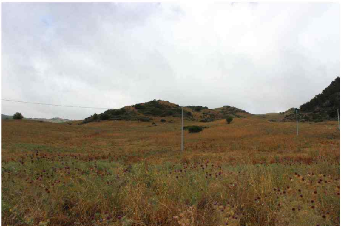
Foto 4-Terreno Censito al foglio 5 mappale 69