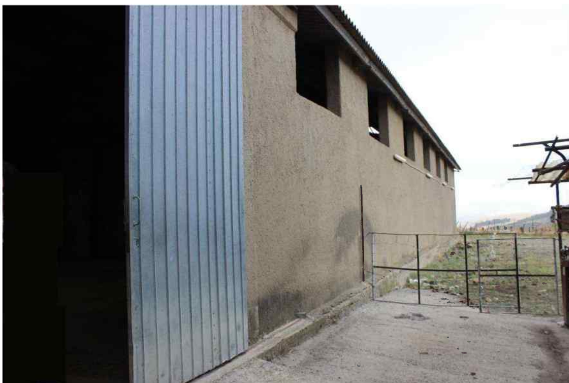
Foto 2 - Esterno Fabbricato Censito al mappale 603 sub.1 - Porzione B