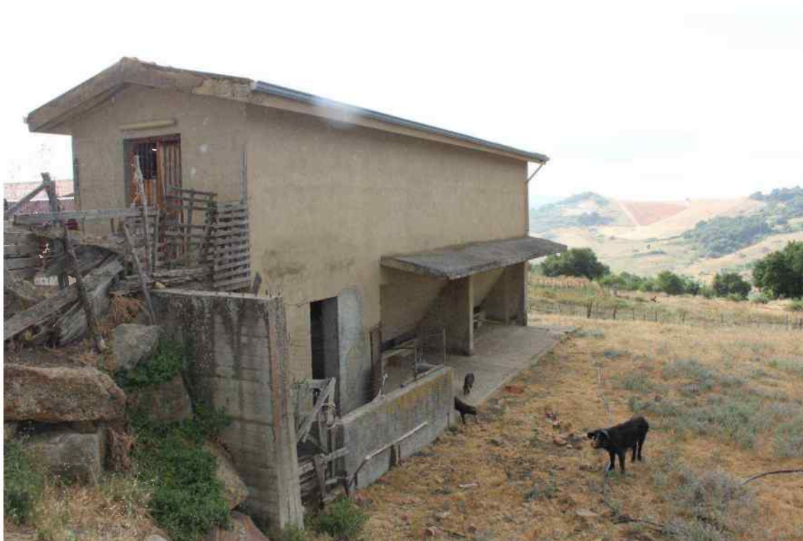
Foto 44 -Esterno Fabbricato Censito al mappale 603 sub.1 - Porzione L – Ovile