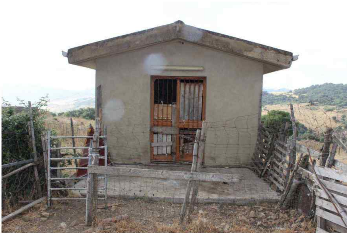
Foto 45 -Esterno Fabbricato Censito al mappale 603 sub.1 - Porzione L – Ovile