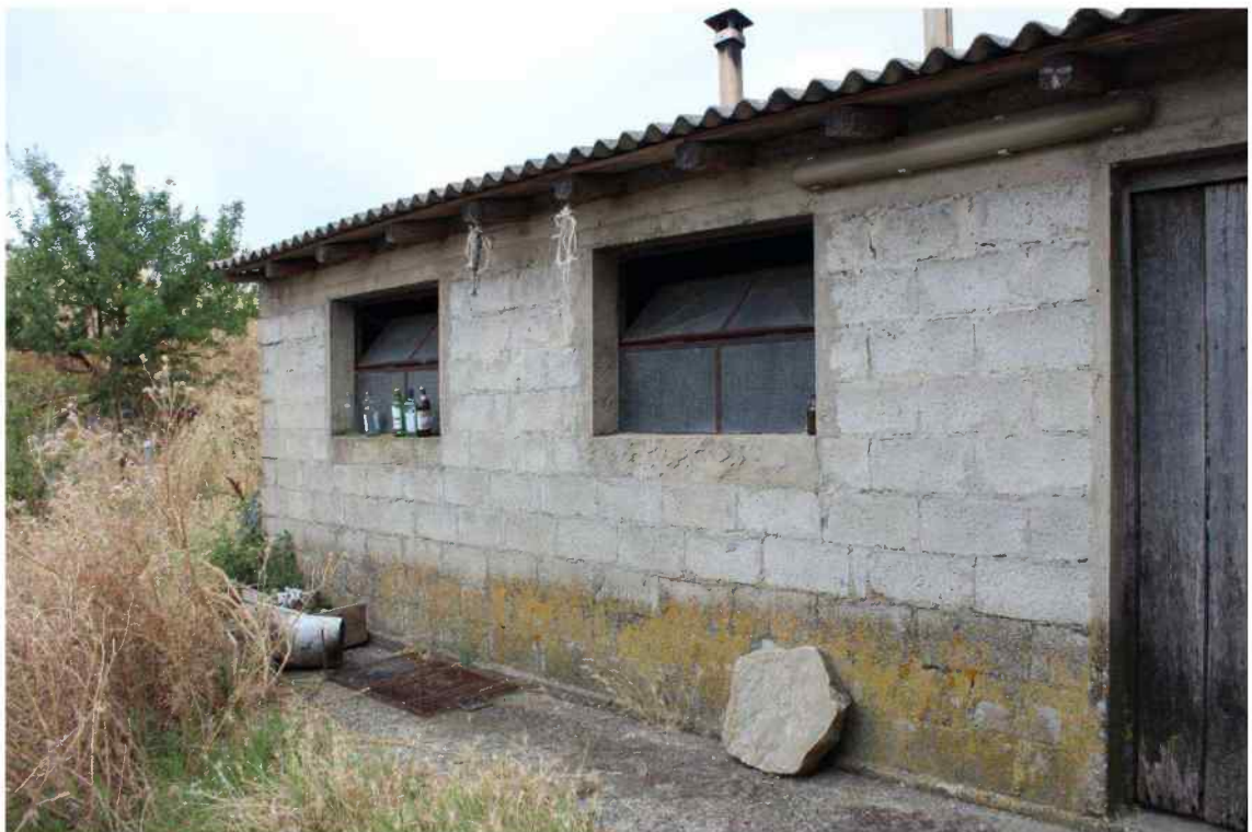
Foto 8 - Esterno Fabbricato Censito al mappale 603 sub.1 - Porzione C