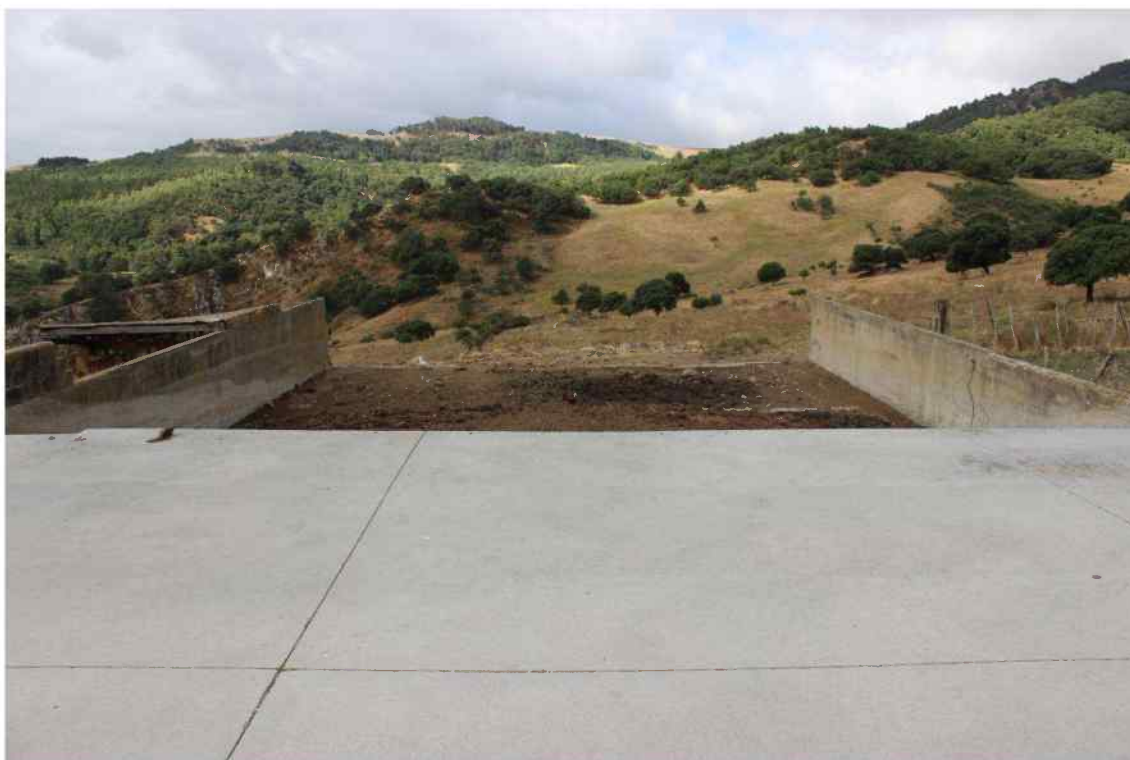
Foto 16 - Immobile Censito al mappale 603 sub.1 - Concimaia - Porzione D