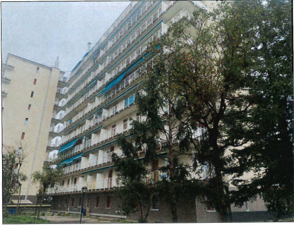
PROSPETTO EST FABBRICATO