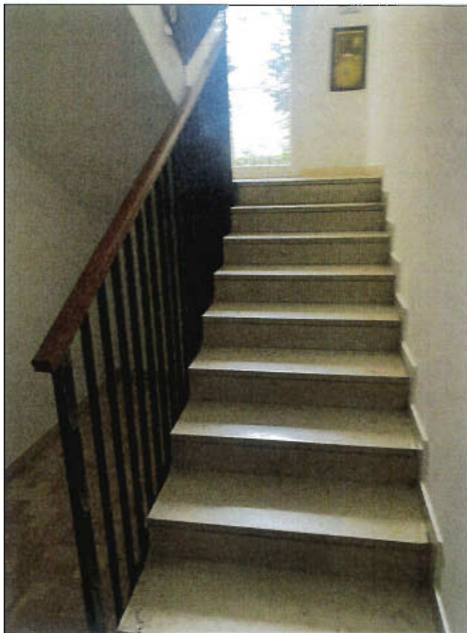
SCALE DI ACCESSO AI PIANI