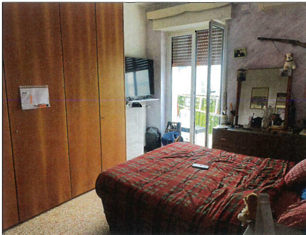
CAMERA CON BALCONE