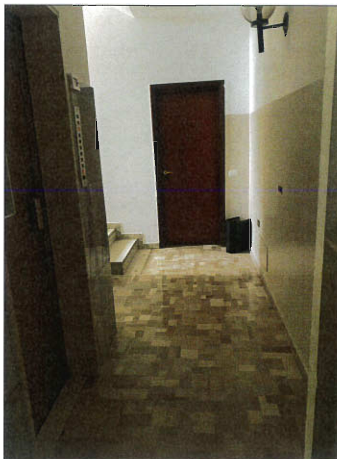
INGRESSO UNITA' IMMOBILIARE