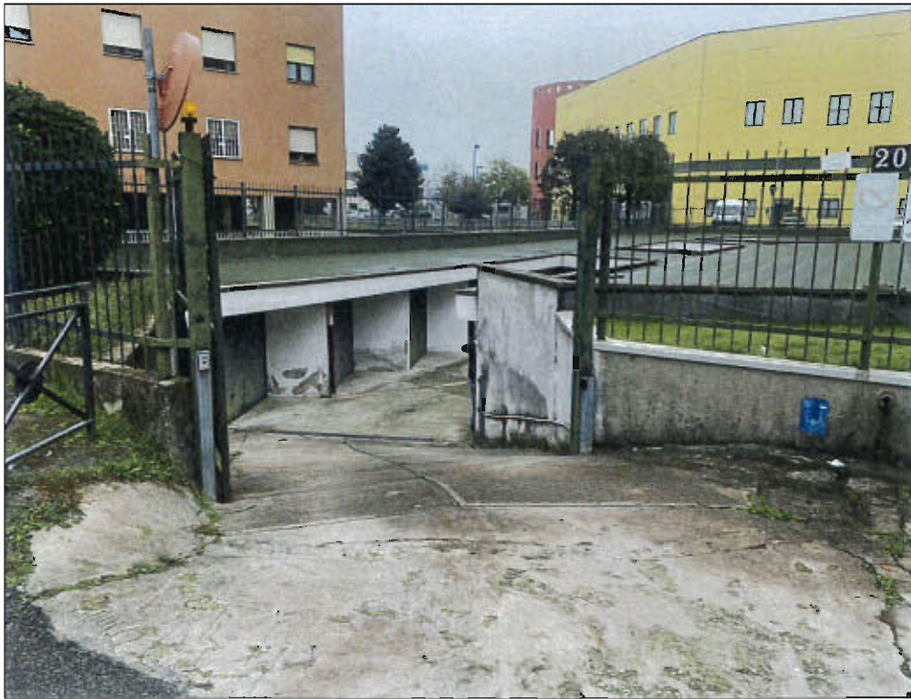
INGRESSO BOX SU VIA WAGNER