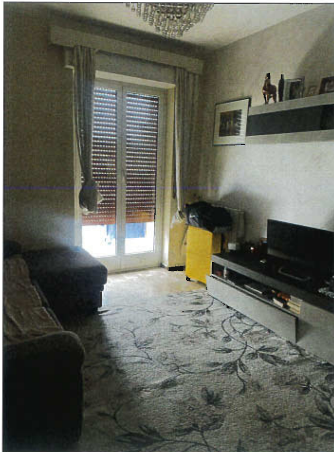
SOGGIORNO CON BALCONE