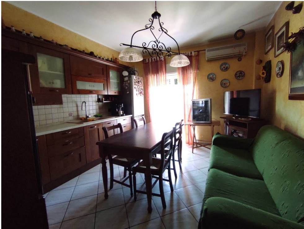
Foto 7 - Cucina