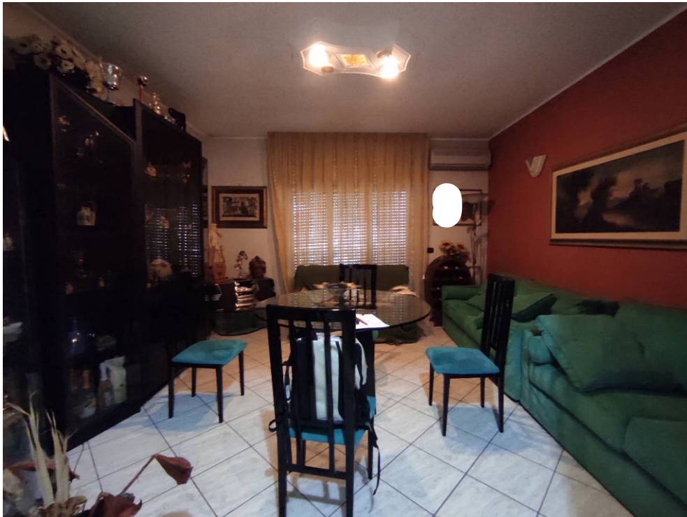
Foto 5 - Soggiorno