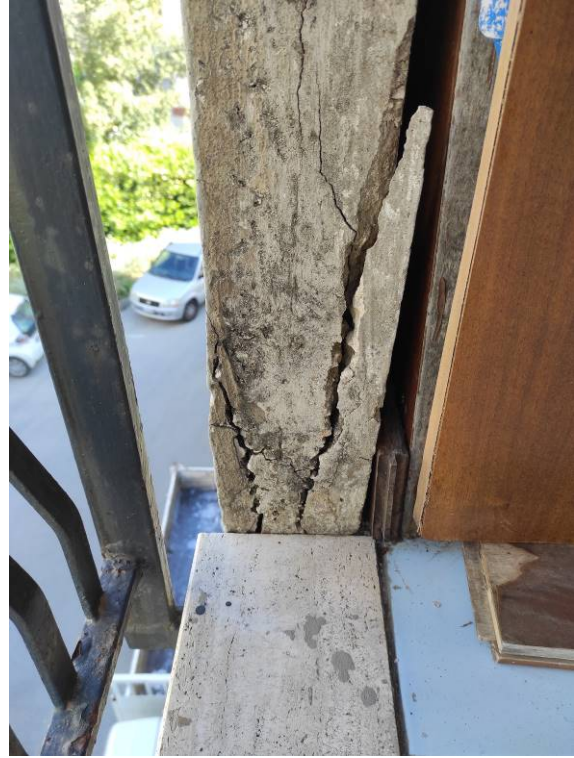
Foto 22 - balcone 2, pessime condizioni di manutenzione