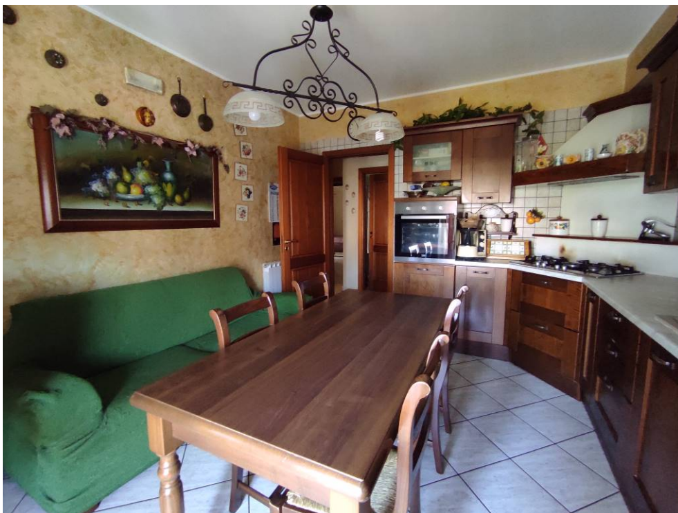
Foto 8 - Cucina