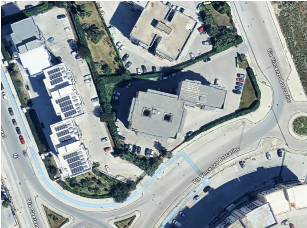
Foto 1 – Foto satellitare del complesso immobiliare che ospita l'edificio condominiale