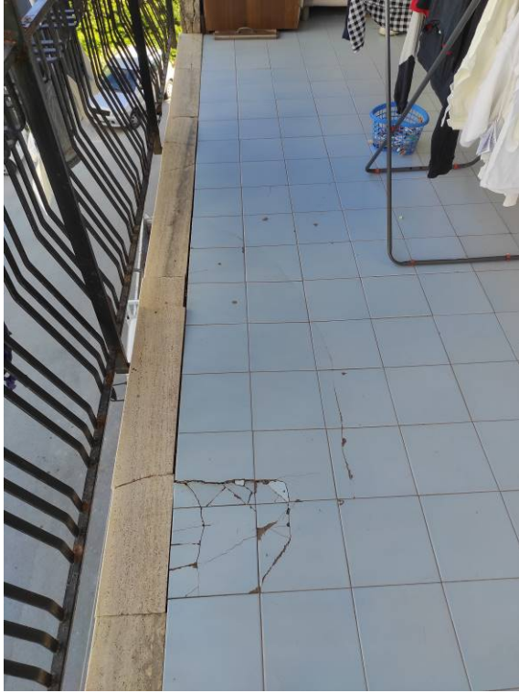
Foto 21 - balcone 2, pessime condizioni di manutenzione