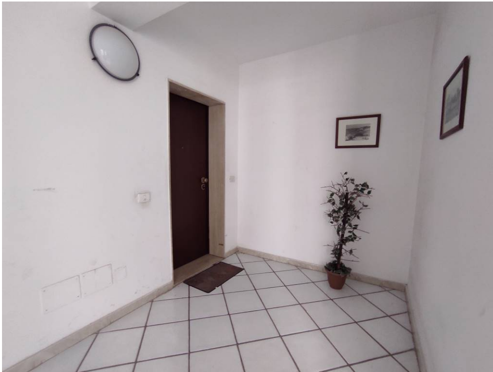
Foto 3 - Ingresso appartamento dal vano scala, particolare volume sottratto a vantaggio dell'appartamento