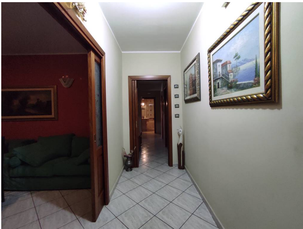
Foto 4 - Ingresso