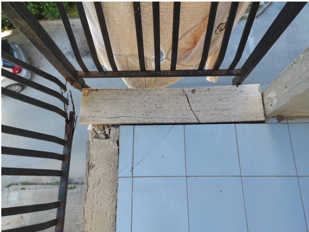
Foto 20 - balcone 2, pessime condizioni di manutenzione