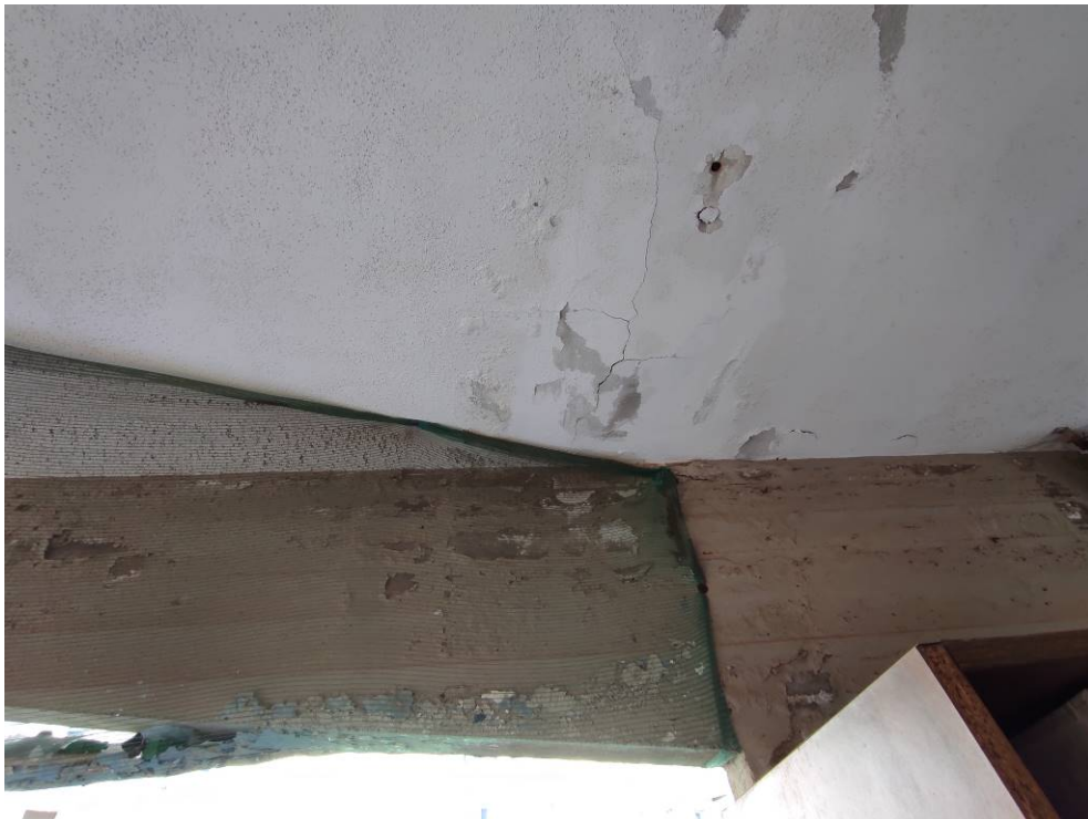
Foto 23 - - balcone 2, pessime condizioni di manutenzione