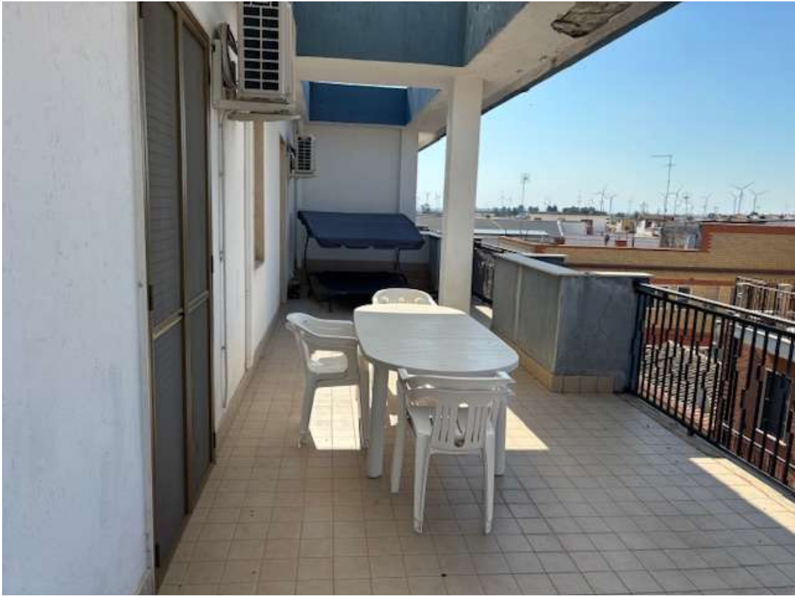
Foto n. 11 - Balcone su via Irpinia