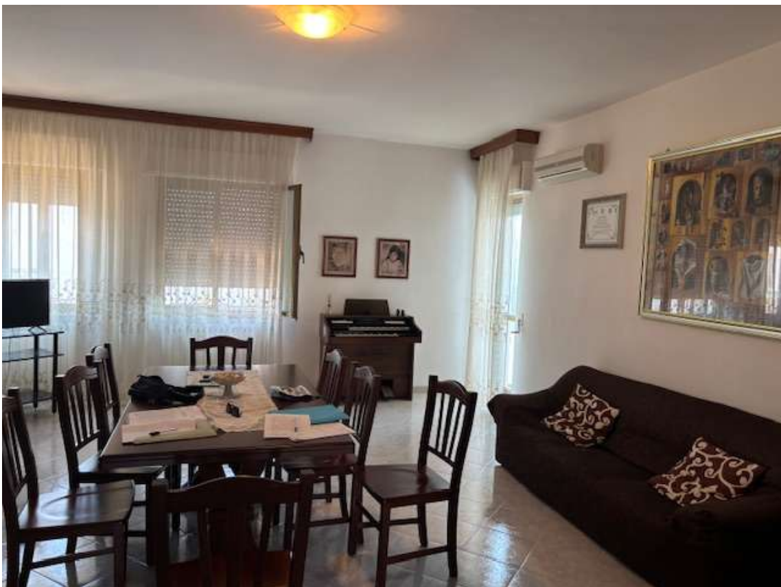
Foto n. 6 - Soggiorno pranzo