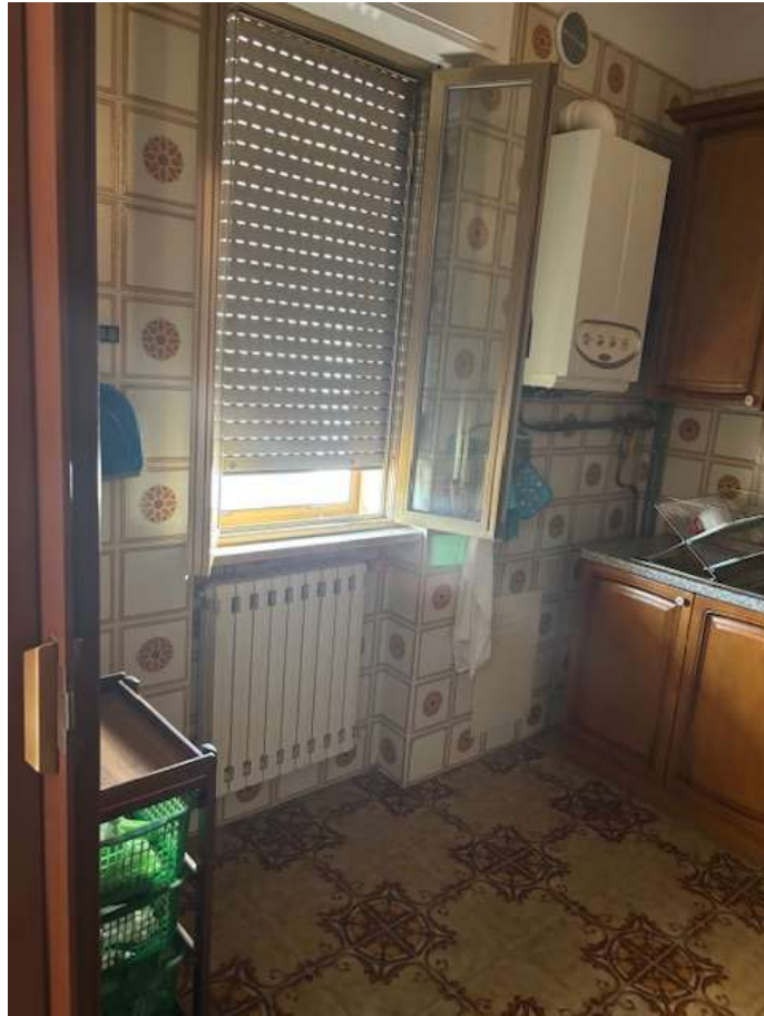
Foto n. 9 - Cucina - Angolo cottura