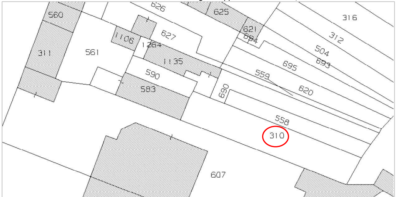
Stralcio estratto mappa CT Fg 9 mapp. 310 seminativo