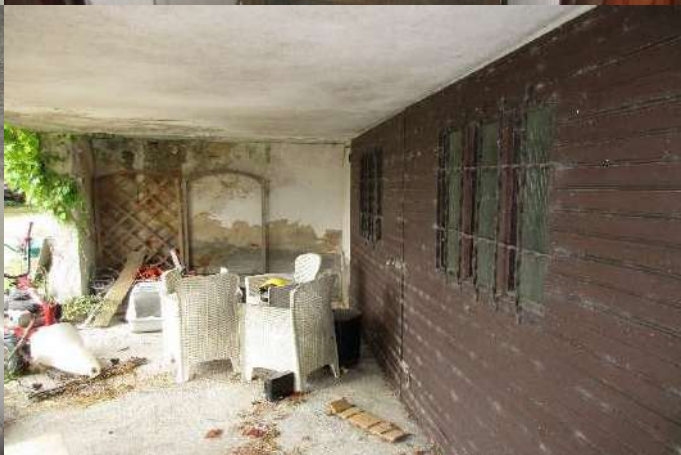
f.24 Vista terrazzo al piano primo f.26 Vista corridoio centrale piano secondo f.28 Vista camere passanti f.30 Vista bagno