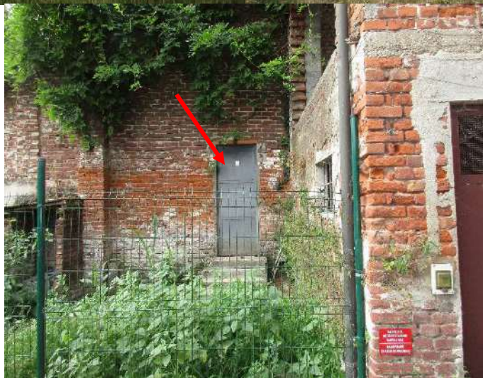
f.40 Vista portico con accesso dalla via della Quercia f.42 Vista recinzione area contigua e villa nello sfondo f.44 Vista porta di accesso dall'area pertinenziale della villa al terreno in CT Fg 9 mapp. 310