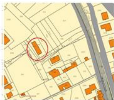
Estratto di mappa catastale

L'intero edificio sviluppa 3 piani, 3 piani fuori terra, 0 piano interrato. Immobile costruito nel 1986 ristrutturato nel 2012.