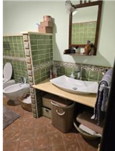
Bagno di servizio