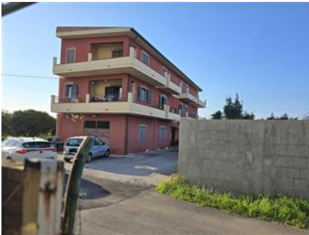
Vista esterna appartamento