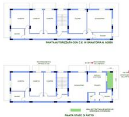
Pianta Autorizzata sanatoria n9/2009 e pianta stato di fatto