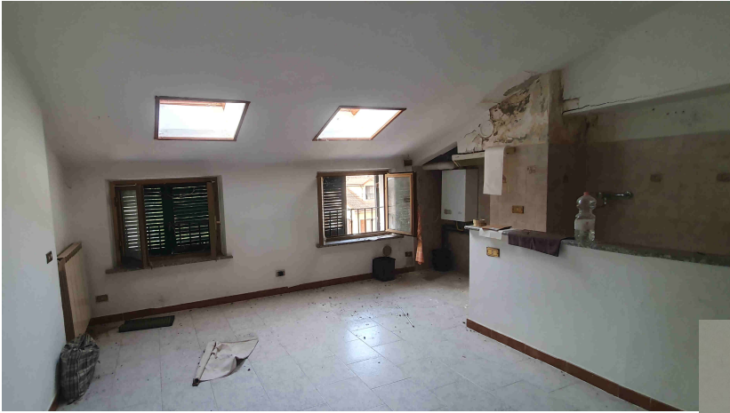
SOGGIORNO CON ANGOLO COTTURA