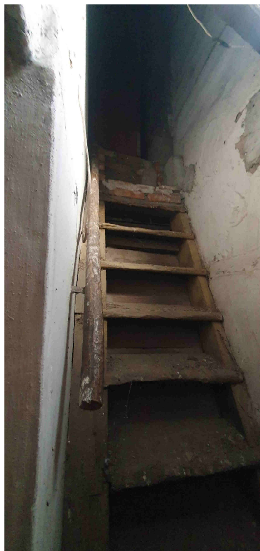
SCALA ACCESSO SOTTOTETTO