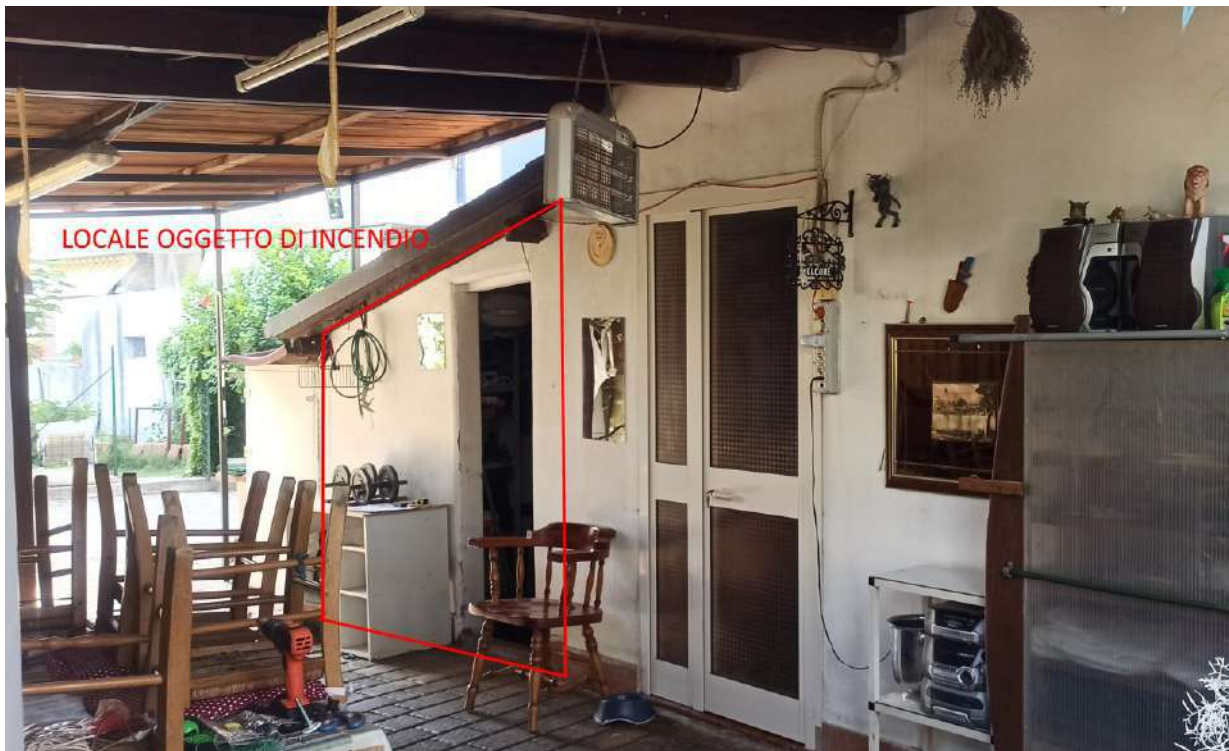
Fotografia 1: Vista del locale incendiato