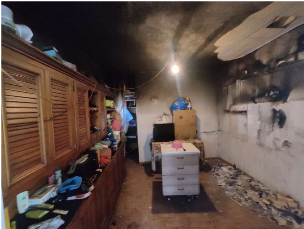
Fotografia 2: Vista del locale incendiato