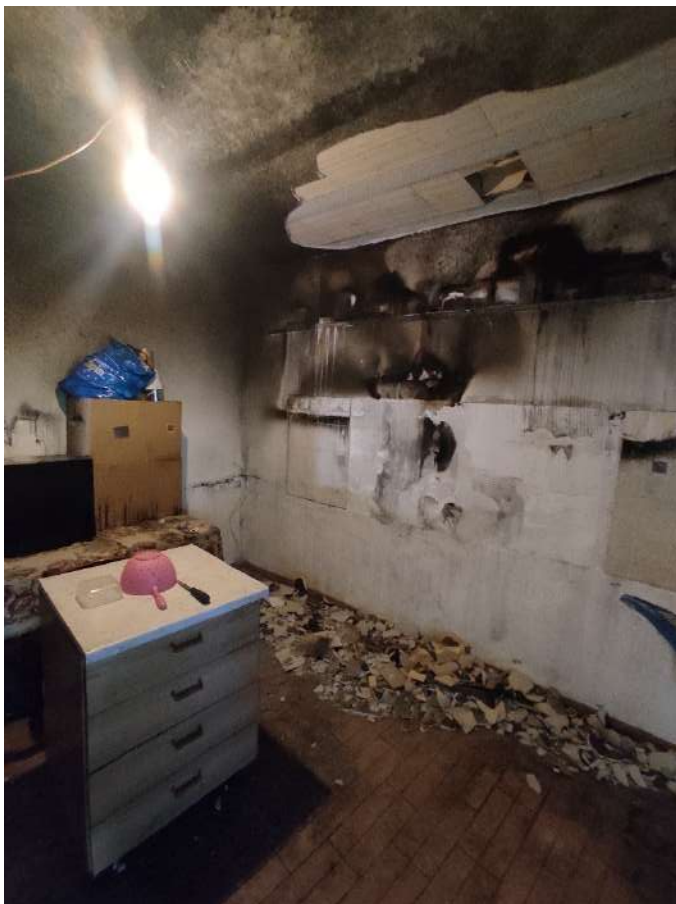
Fotografia 4: Vista parete della cucina