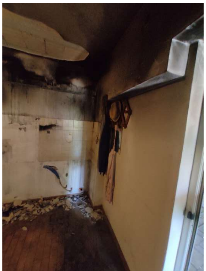
Fotografia 5: Vista della parete sul lato esterno