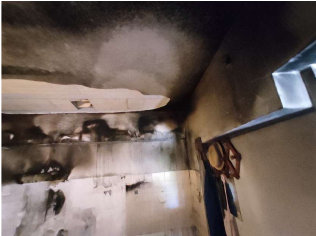
Fotografia 3: Particolare del soffitto