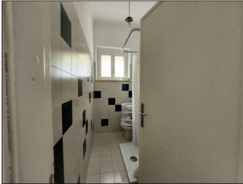
Fig. 20 - WC 2 (vista c17)