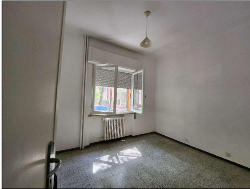
Fig. 14 – Camera 1 (vista c11)