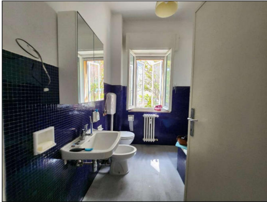
Fig. 18 – WC 1 (vista c15)