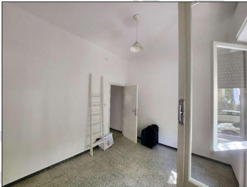
Fig. 15 – Camera 1 (vista c12)