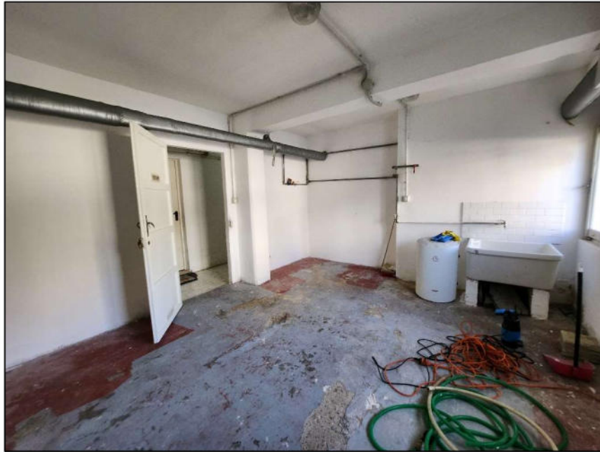
Fig. 25 – Cantina (vista c22)