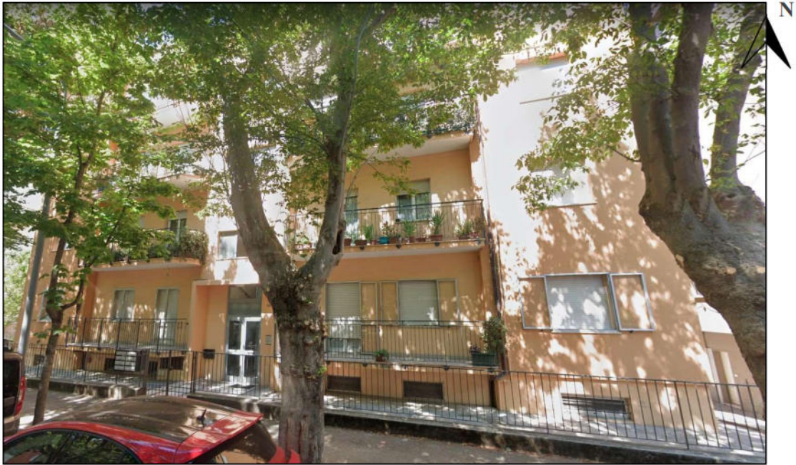
Fig. 2 – Ingresso da strada pubblica OMISSIS