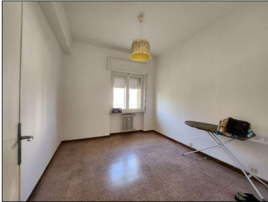
Fig. 12 – Camera 3 (vista c9)