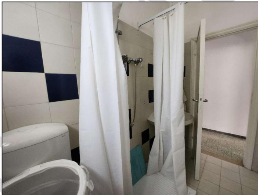
Fig. 21 - WC 2 (vista c18)