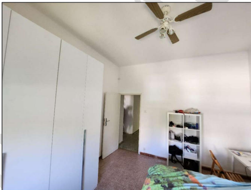
Fig. 17 – Camera 2 (vista c14)