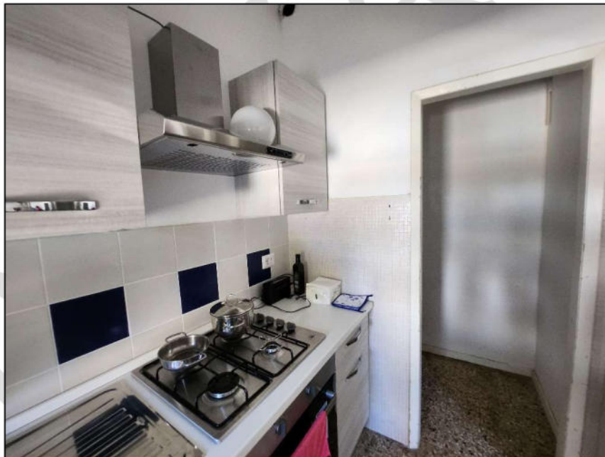
Fig. 9 – Cucinotto (vista c6)