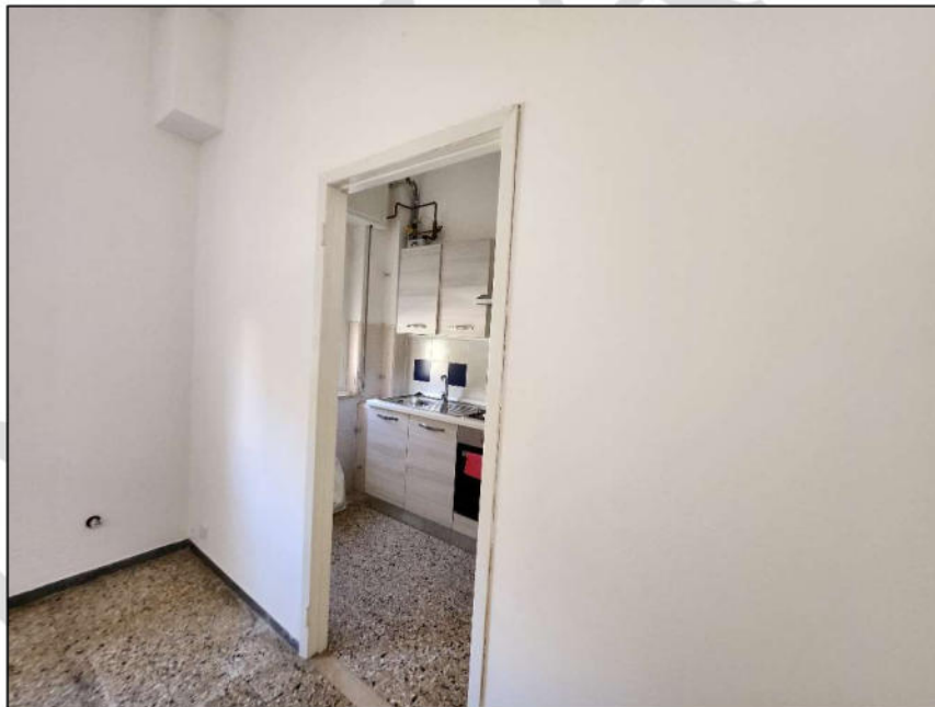
Fig. 7 – Cucina/Cucinotto (vista c4)