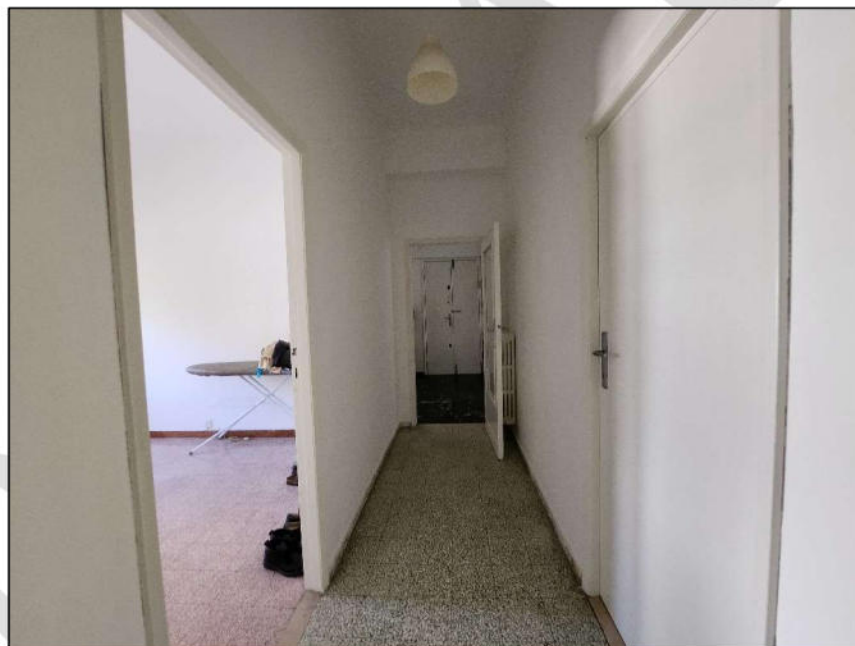
Fig. 11 – Corridoio (vista c8)