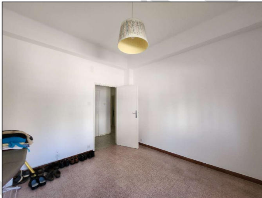
Fig. 13 – Camera 3 (vista c10)