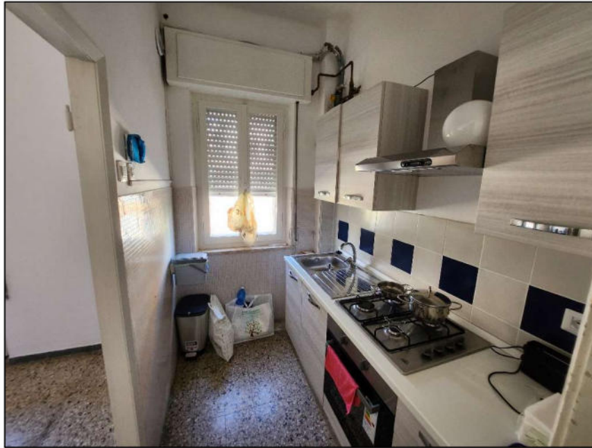
Fig. 8 – Cucinotto (vista c5)