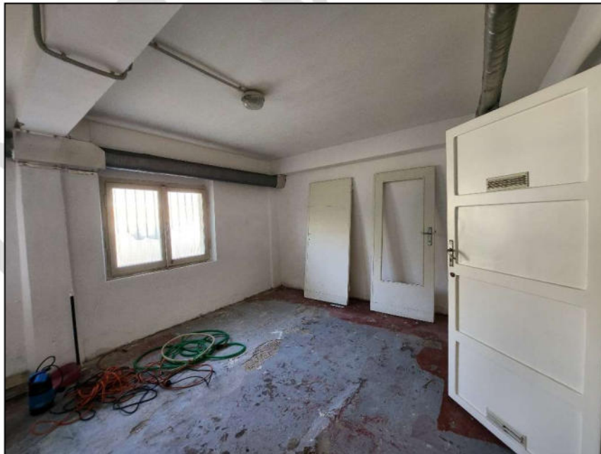
Fig. 24 – Cantina (vista c21)