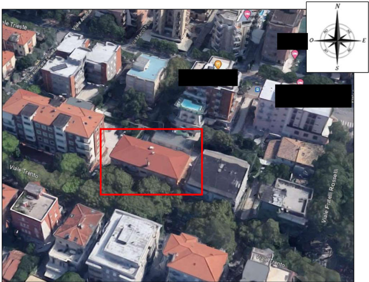
Fig. 1 – Vista aerea dello stabile in cui è collocato l'appartamento