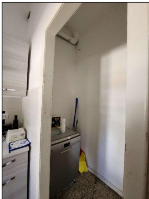
Fig. 10 – Cucinotto/dettaglio (vista c7)