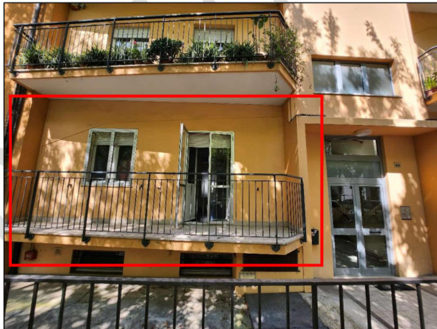
Fig. 3 – Dettaglio esterno ingresso pedonale e portone, con evidenza dell'appartamento