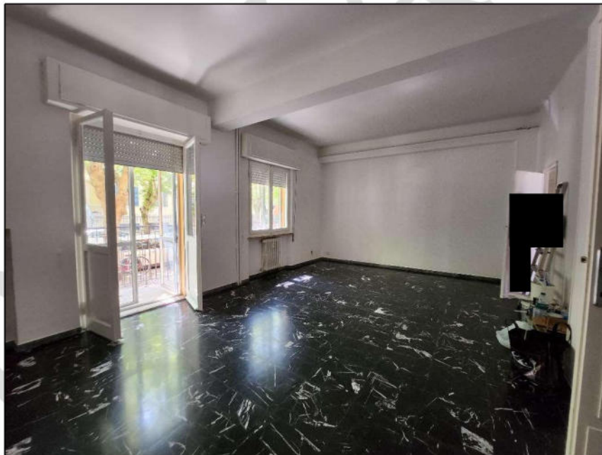
Fig. 5 – Sala (vista c2)