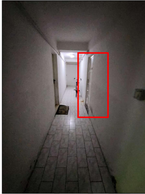
Fig. 23 – Corridoio comune (vista c20) ed evidenza dell'accesso alla cantina