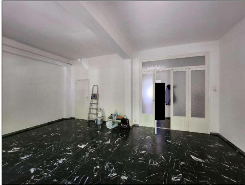
Fig. 6 – Sala (vista c3)