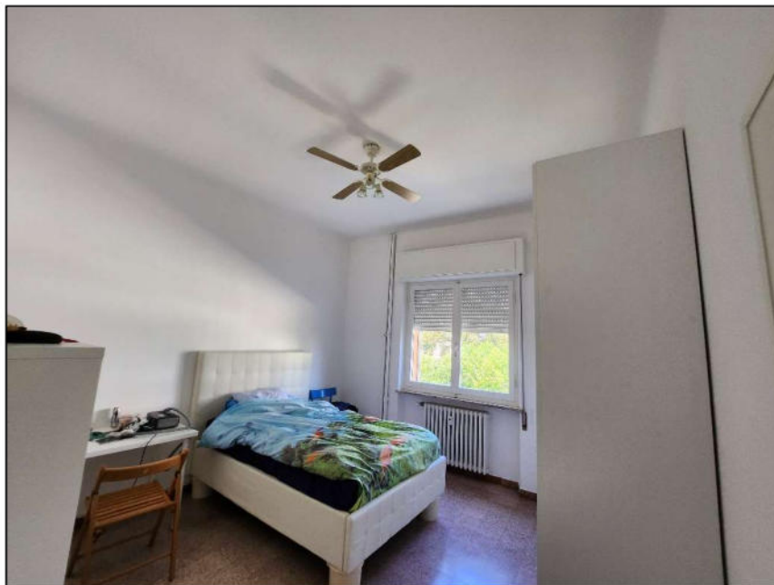
Fig. 16 – Camera 2 (vista c13)