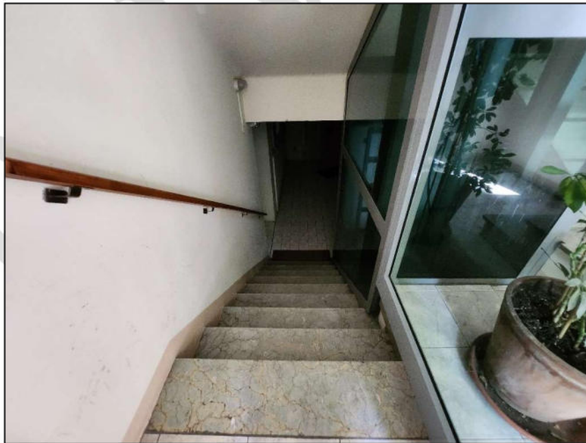
Fig. 22 – Rampa di accesso al seminterrato (vista c19)