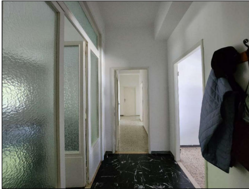
Fig. 4 – Ingresso / corridoio (vista c1)