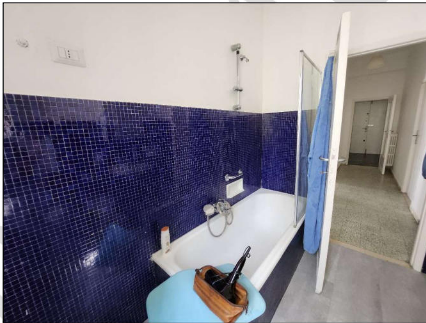
Fig. 19 – WC 1 (vista c16)