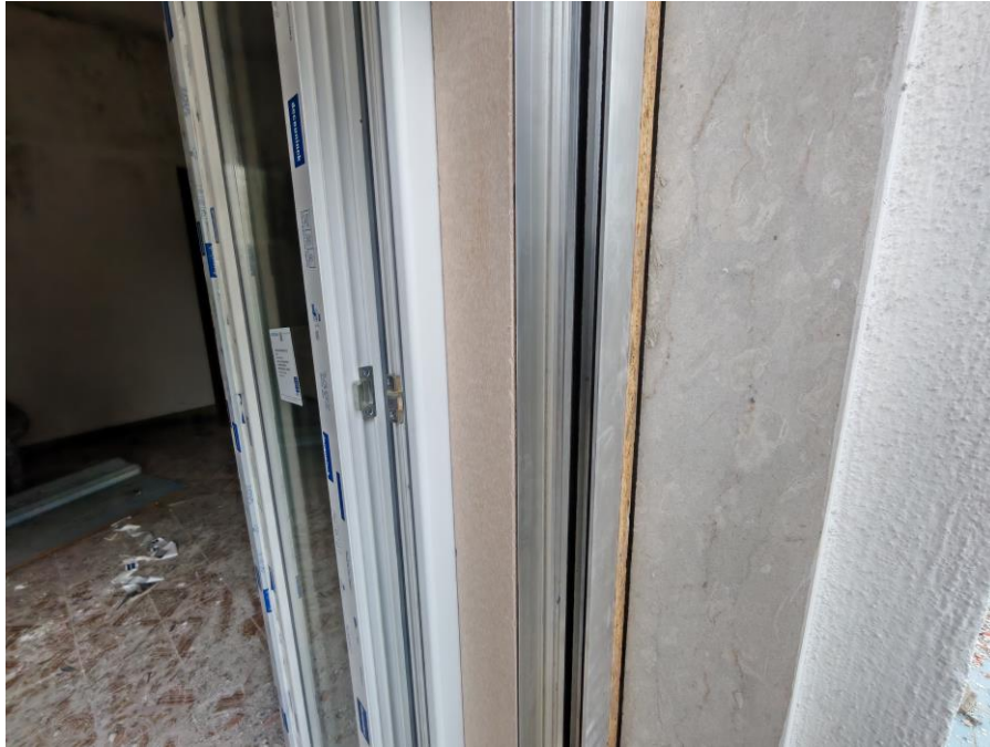
Vista particolare esterna del montaggio degli infissi in cui si evince lo stato d'uso e la mancanza delle rifiniture.