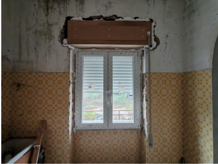
Viste generale e particolare interne del montaggio degli infissi in cui si evince lo stato d'uso e la mancanza delle rifiniture.