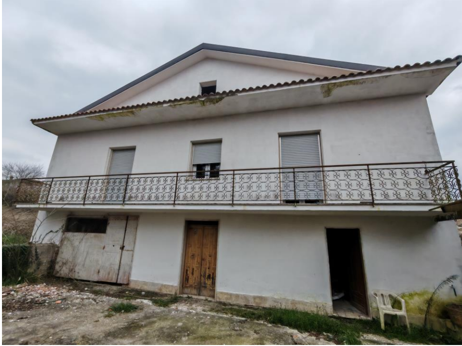
Vista generale della porzione di fabbricato alla C.da Felci con accesso da Via Felci, snc adibita ad abitazione e parte della corte oggetto della presente Esecuzione Immobiliare in cui si evincono gli infissi posti in opera a piano primo. (Prospetto lato ovest)