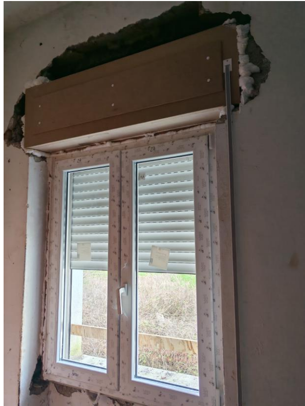
Vista generale interna del montaggio degli infissi in cui si evince lo stato d'uso e la mancanza delle rifiniture.