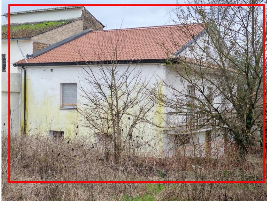
Vista generale esterna della porzione del fabbricato evidenziata in rosso con accesso da Via Felci, snc adibita ad abitazione oggetto della presente Esecuzione Immobiliare in cui si evincono gli infissi posti in opera a piano primo. (Prospetto lato nord)