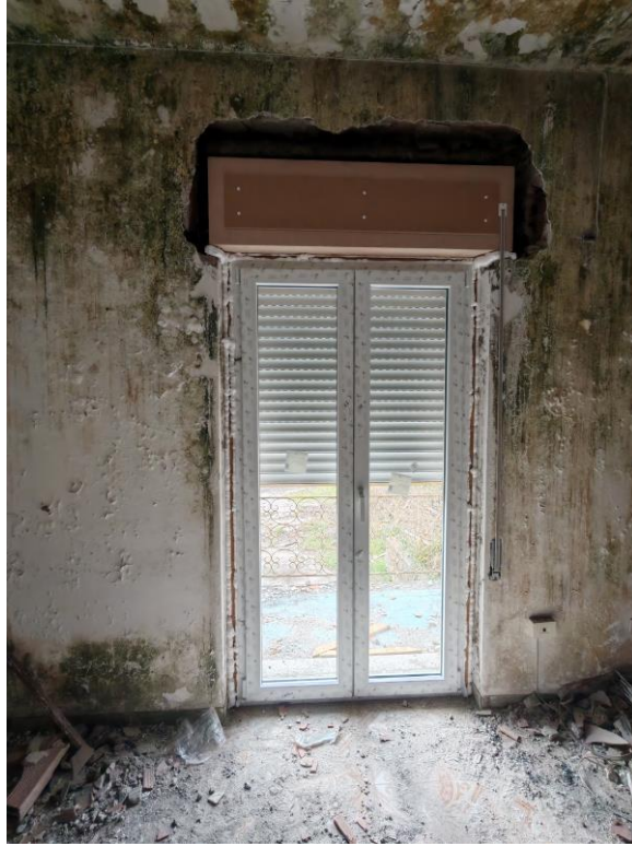
Vista generale interna del montaggio degli infissi in cui si evince lo stato d'uso e la mancanza delle rifiniture.