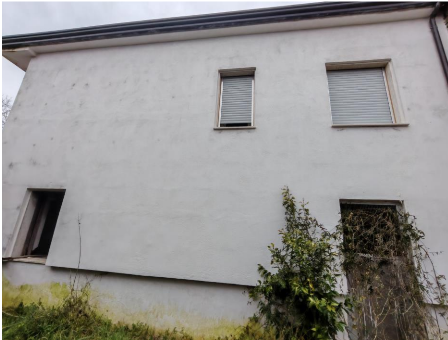
Vista generale della porzione di fabbricato alla C.da Felci con accesso da Via Felci, snc adibita ad abitazione oggetto della presente Esecuzione Immobiliare in cui si evincono gli infissi posti in opera a piano primo. (Prospetto lato sud)