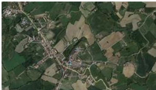
Mappa Mondavio (PU)

I beni sono ubicati in zona semicentrale in un'area residenziale, le zone limitrofe si trovano in un'area agricola (i più importanti centri limitrofi sono Marotta a circa 20 Km). Il traffico nella zona è locale, i parcheggi sono sufficienti. Sono inoltre presenti i servizi di urbanizzazione primaria e secondaria, le seguenti attrazioni storico paesaggistiche: Rocca Roveresca.