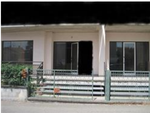
Accesso esposizione da Via Kennedy

Coerenze: Dall'esame dell'estratto di mappa si evince che l'intero lotto su cui insiste il bene in oggetto confina a NORD con le particelle Foglio 6 nn. 288 - 648, a EST con le particelle Foglio 6 nn. 610 - 611 - 284 - 253 - 68 - 476, a SUD con Via Kennedy e le particelle Foglio 6 nn. 478 - 252 e a OVEST con le particelle Foglio 6 nn. 416 - 418 - 420 - 423. All'interno del lotto il bene in oggetto confina con le unità immobiliari censite al NCEU al Foglio 6 particella 289 sub. n. 1 graffato 5, sub. n. 2 graffato 7, sub. 4, parti comuni censite al NCEU al Foglio 6 particella 289 sub. n. 8, salvo altri.