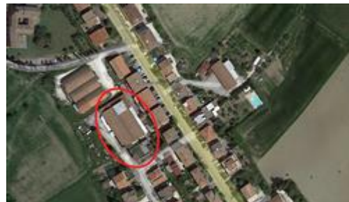
Mappa con localizzazione dei beni in questione