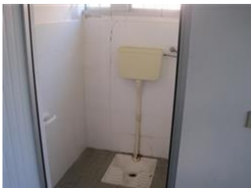
Servizi igienici opificio