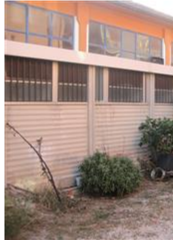
Deposito laterale realizzato a confine addossato al capannone