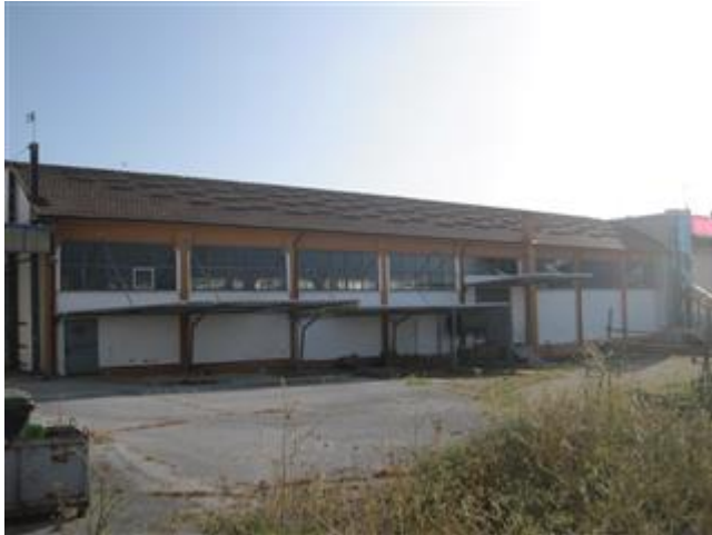
Opificio e scoperto esclusivo