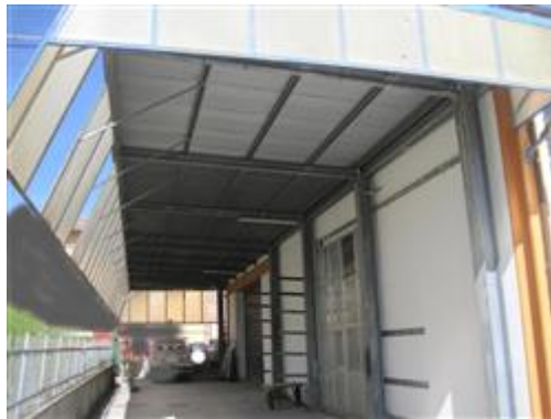
Tettoie metalliche sul retro del capannone