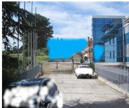
Accesso opificio e uffici