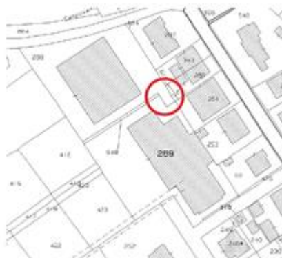
Anomalia riscontrata sul confine del lotto a Nord/Est