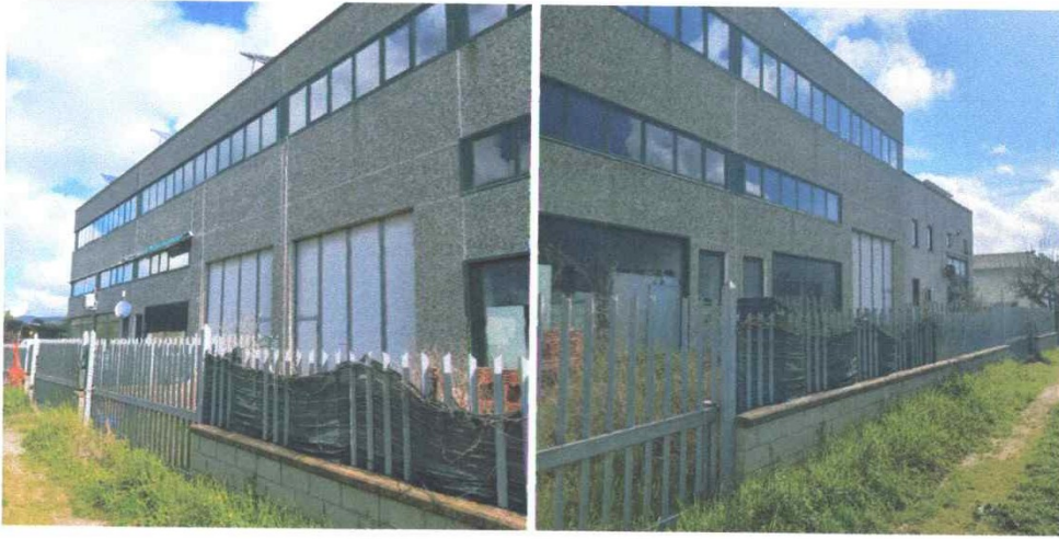
Veduta magazzino-piano terra