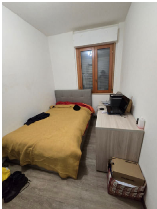
09 – CAMERA DA LETTO SINGOLA