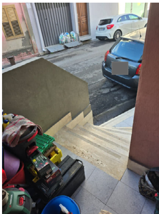
04 – INGRESSO APPARTAMENTO