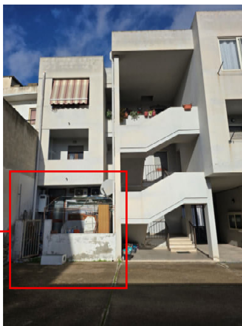
FOTO 15 - CORTILE/VERANDA SUL RETRO