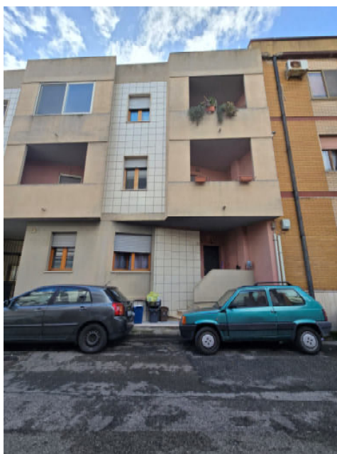
03 – FACCIATA DELL'EDIFICIO