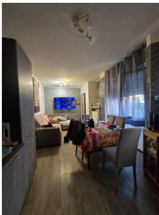
06 – PRANZO SOGGIORNO