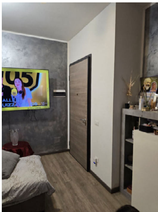
05 – INGRESSO SOGGIORNO