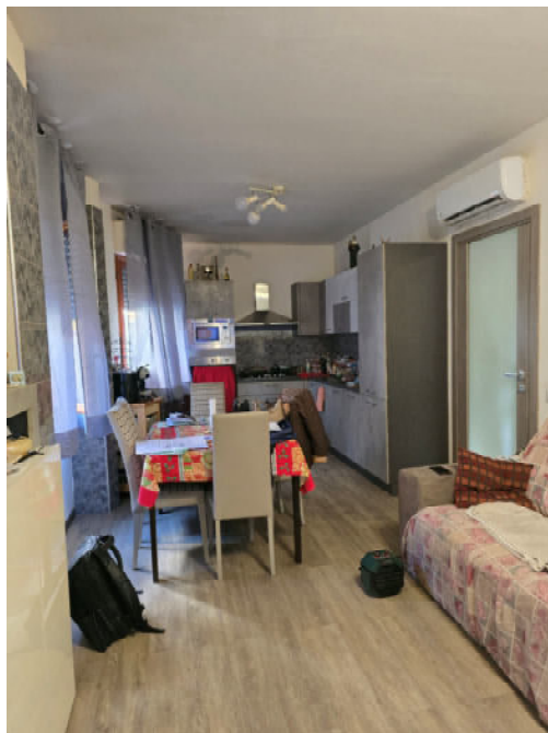
07 – PRANZO E ANGOLO COTTURA