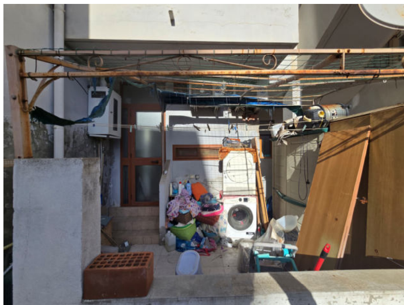
FOTO 14 - CORTILE/VERANDA SUL RETRO