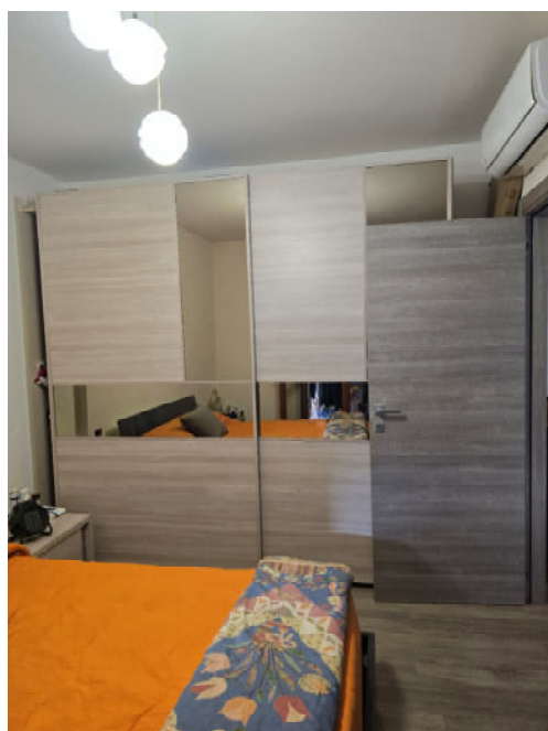
12 – CAMERA DA LETTO MATRIMONIALE