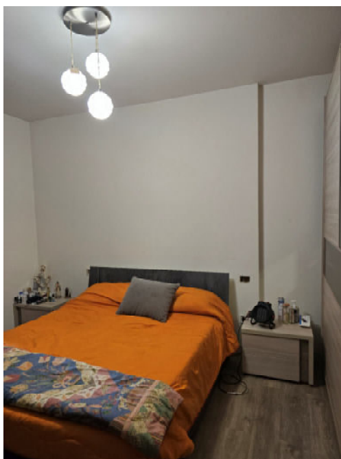
11 – CAMERA DA LETTO MATRIMONIALE