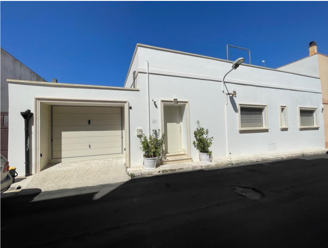
Prospetto principale su via Fiume