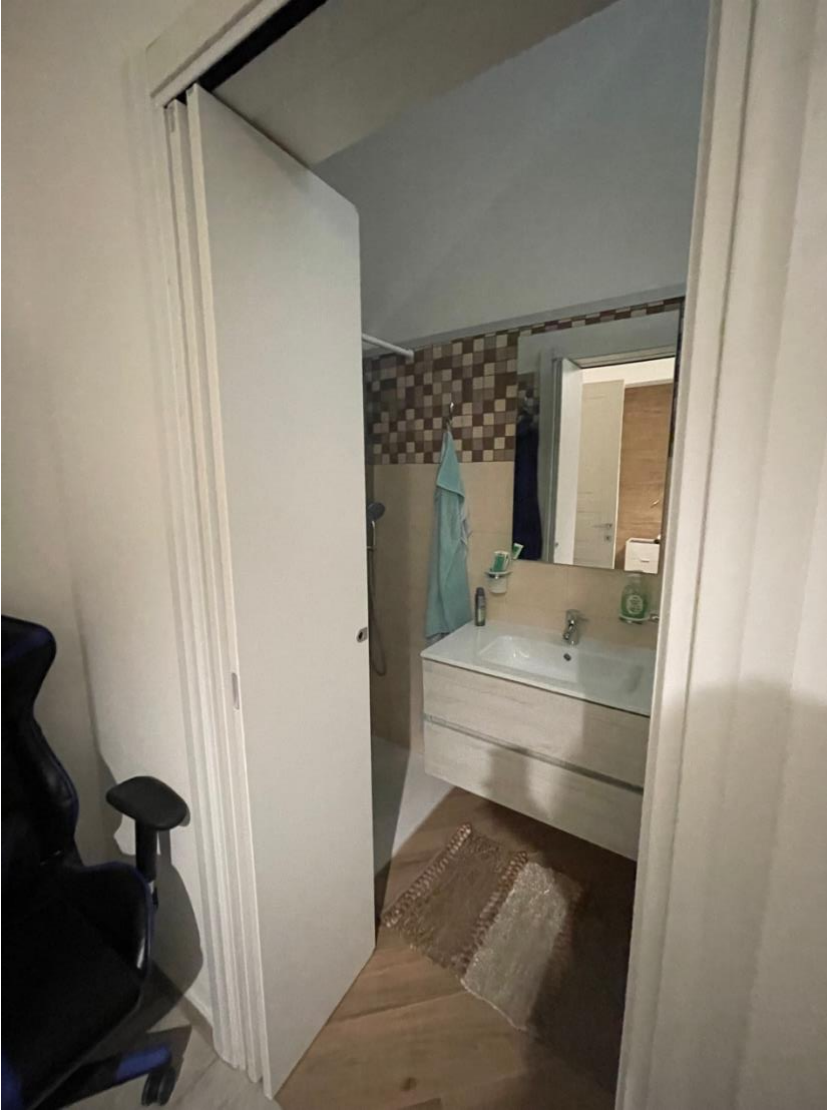
Wc (vano 2)