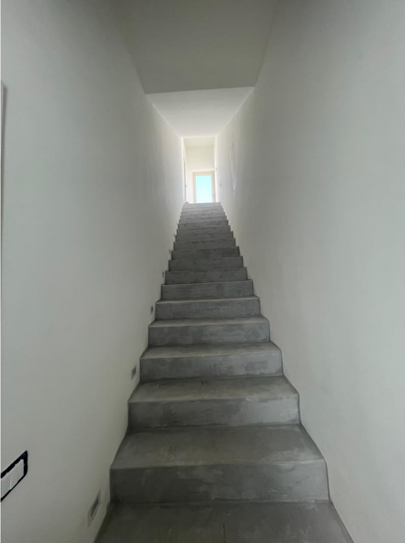
Scala di collegamento alle terrazze di copertura