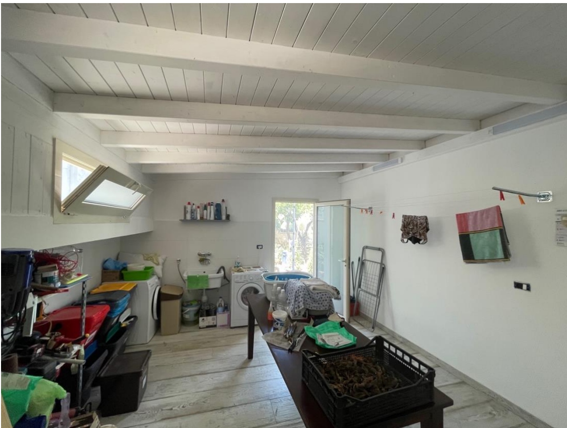
Vano non autorizzato