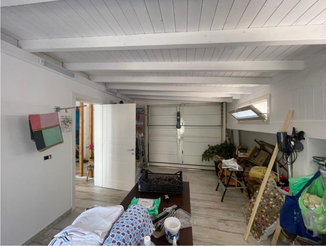
Vano non autorizzato