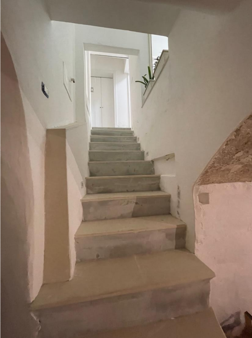
Scala di collegamento al piano interrato