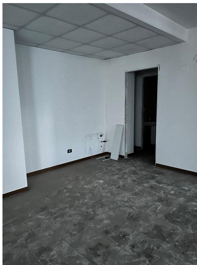
Foto n. 1_Vista interno ufficio