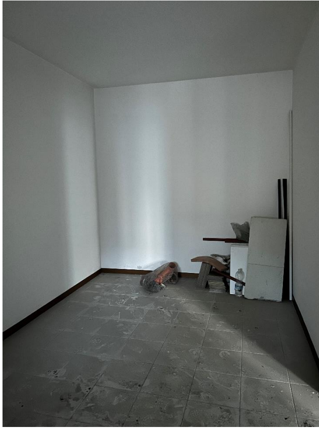
Foto n. 7-8_Viste interno ufficio