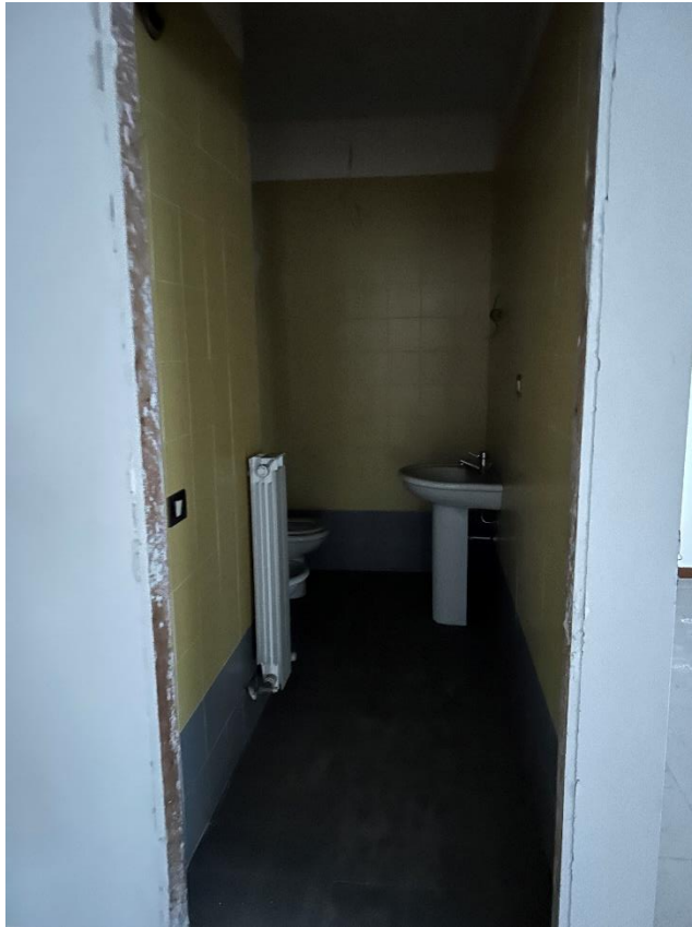
Foto n. 5-6_Viste w.c.