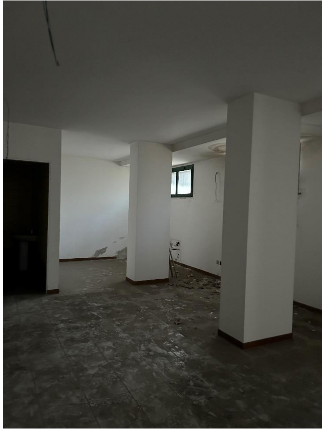
Foto n. 3-4_Viste interno ufficio