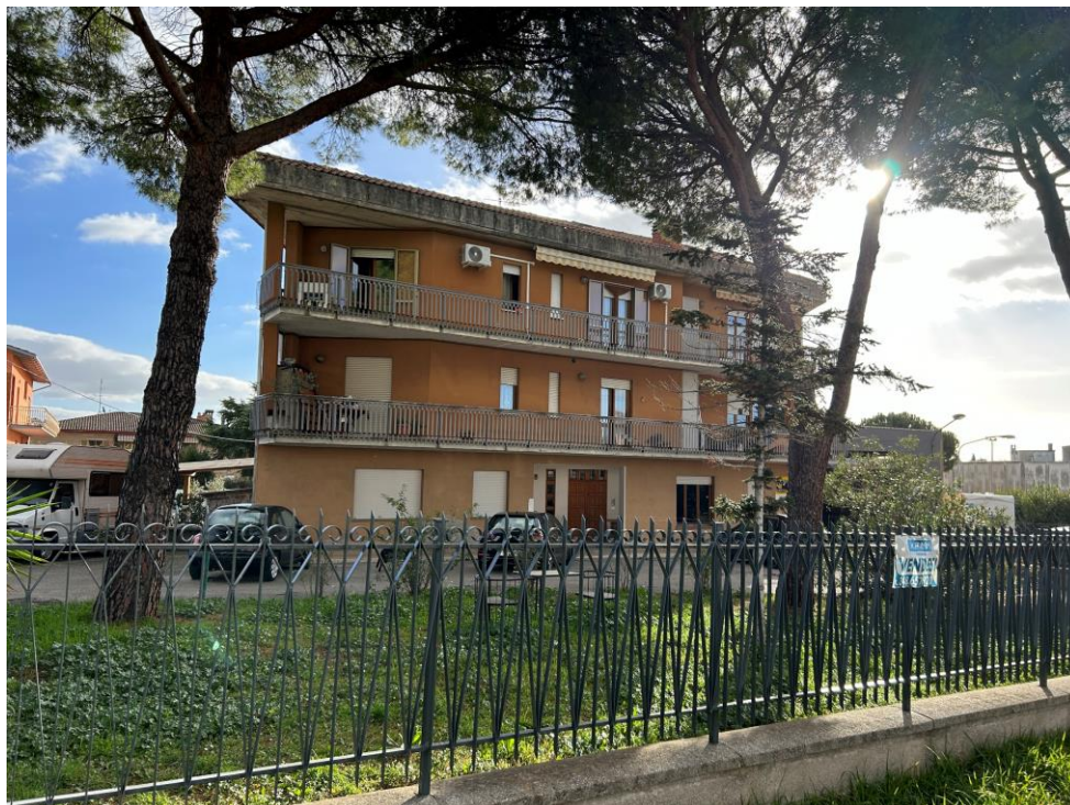
Foto n. 1_Vista frontale edificio