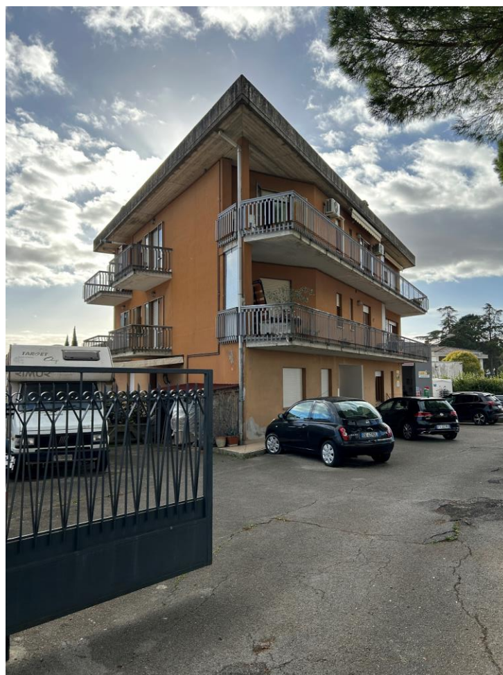
Foto n. 2_Vista frontale/laterale edificio