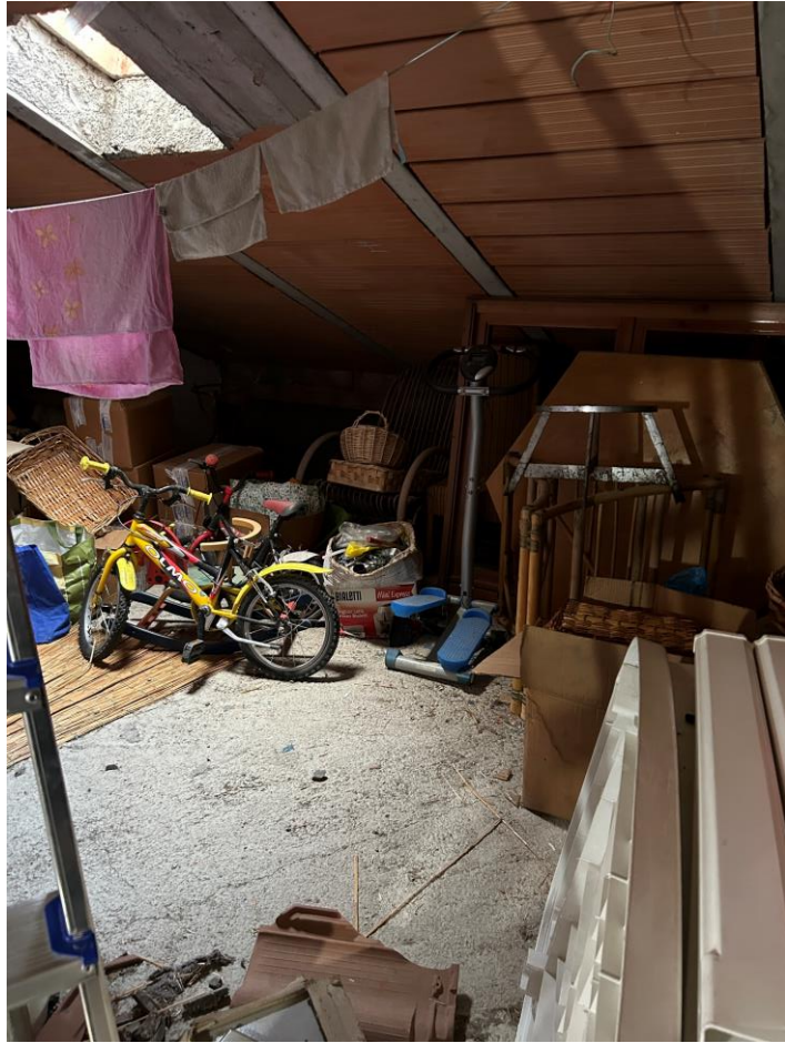
Foto n. 3_Vista interno soffitta