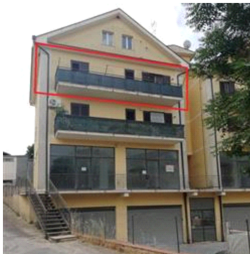
Prospetto principale del fabbricato con in evidenza l'alloggio pignorato

Coerenze: l'alloggio pignorato confina a nord con il cortile antistante dell'edificio, a sud con il cortile retrostante, a est con la stradella privata appartenente sempre alla corte del fabbricato ed a ovest con il corpo scala comune e con altro alloggio (part. 33).