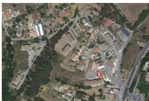
foto aerea della zona in cui ricadono l'alloggio e i posti auto pignorati

L'edificio, di cui fa parte il cespite pignorato, è ubicato in una zona periferica, a nord del centro abitato. Tale zona è caratterizzata da un gruppo di edifici contornato da strade interne, nati per iniziativa privata e che si sviluppano ad ovest rispetto all'asse viario principale denominato viale Generale Gaeta. Questi insediamenti tuttavia non costituiscono dei tessuti urbani veri e propri, in quanto, non avendo innescato processi di urbanizzazione adiacenti, sono rimasti di fatto isolati. In tale zona la tipologia edilizia prevalente è quella della casa in linea e gli edifici sono prevalentemente allineati alle strade interne. Il traffico è limitato, i parcheggi sono buoni. I collegamenti verso tutte le direzioni sono favoriti dal collegamento diretto di viale Generale Gaeta con il centro abitato. Per quanto riguarda le attrezzature la zona è subordinata alla città consolidata, ciò nonostante è bene precisare che nelle immediate vicinanze è presente l'Ospedale. Nel complesso la qualità edilizia ed urbana è discreta.