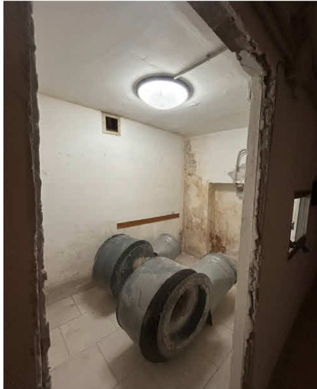
FOTO 15 Locale deposito al PS1 - SUB 101: piccolo vano adiacente l'ingresso