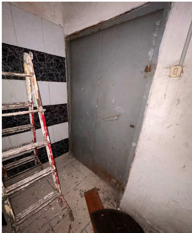
FOTO 6 Porta d'accesso all'u.i. pignorata al PS1 - SUB 101