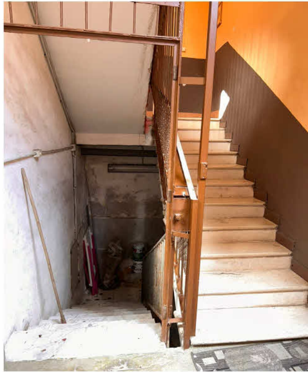
FOTO 5 Vano scala