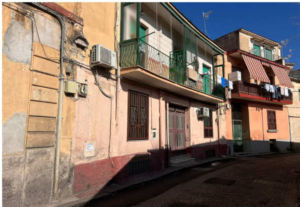
FOTO 1 Veduta del fabbricato in cui è ubicato il bene da Vicoletto detto Improta