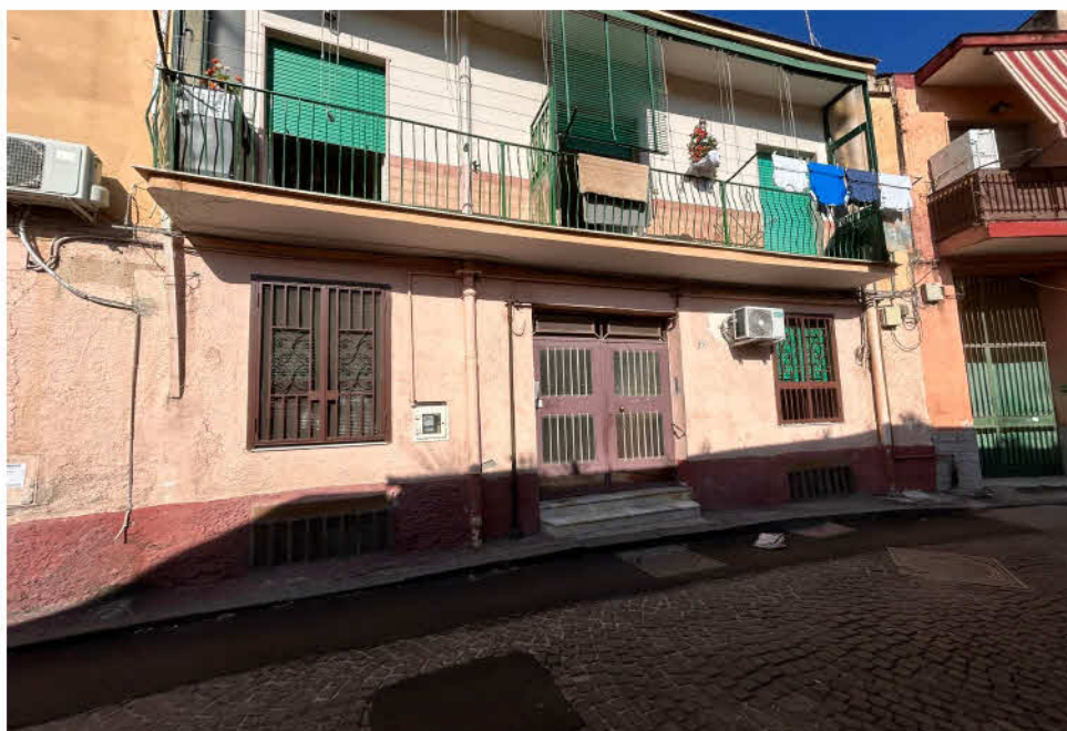
FOTO 2 Veduta del fabbricato in cui è ubicato il bene da Vicoletto detto Improta