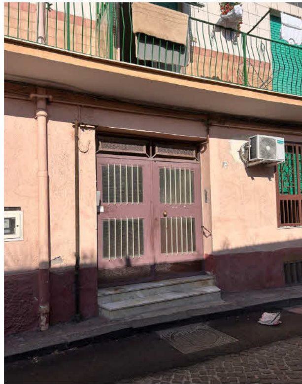
FOTO 3 Portone d'accesso al fabbricato da Vicoletto detto Improta n°25