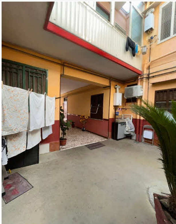
FOTO 4 Corte interna del fabbricato