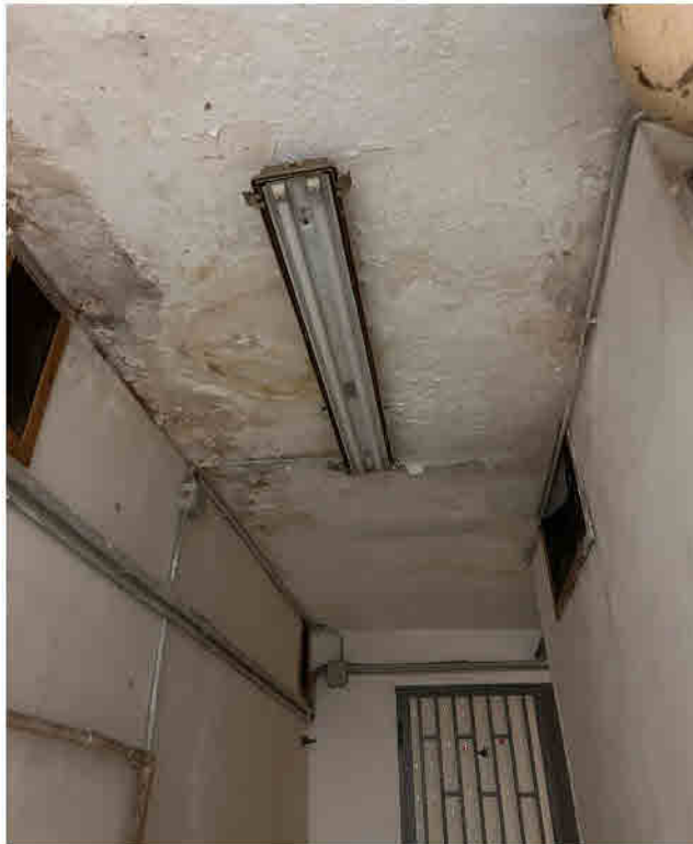
FOTO 18 Locale deposito al PSI - SUB 101: particolare dei fenomeni infiltrativi a soffitto