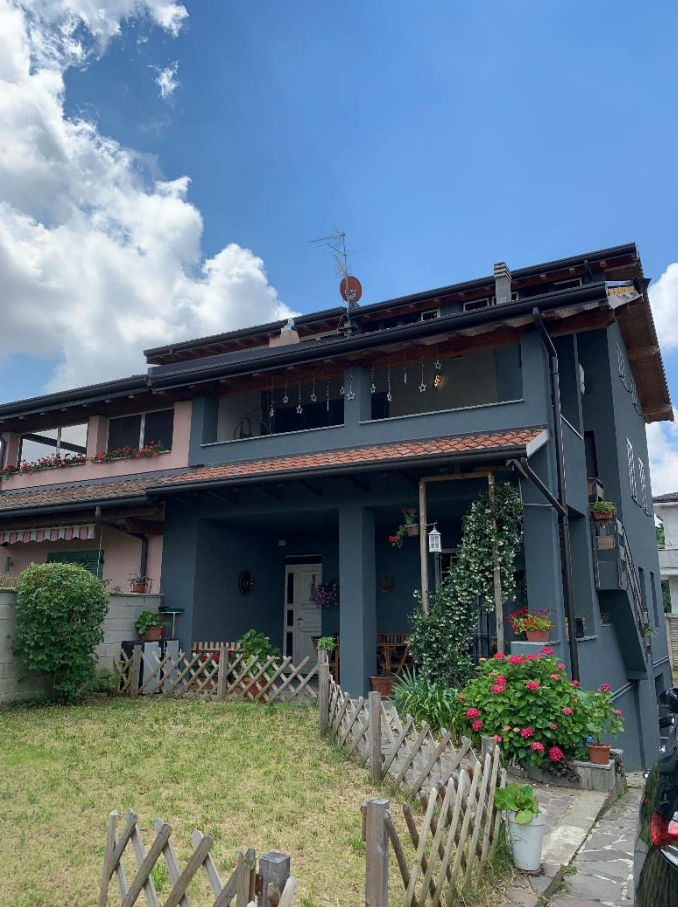
01-Edificio visto dall'esterno lato via Leoncavallo.