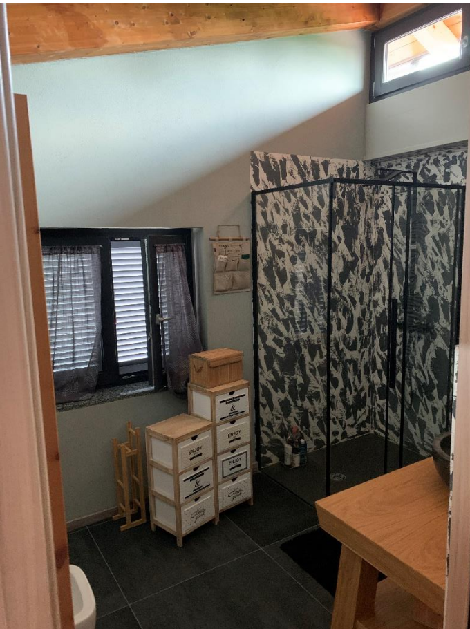
14-Bagno secondo livello