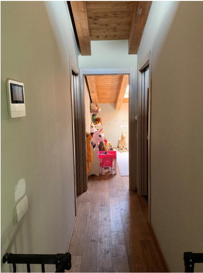
13-disimpegno camere secondo livello