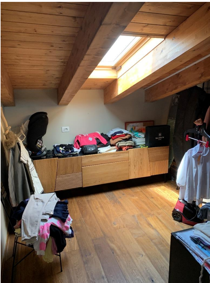
18-Cabina armadio secondo livello