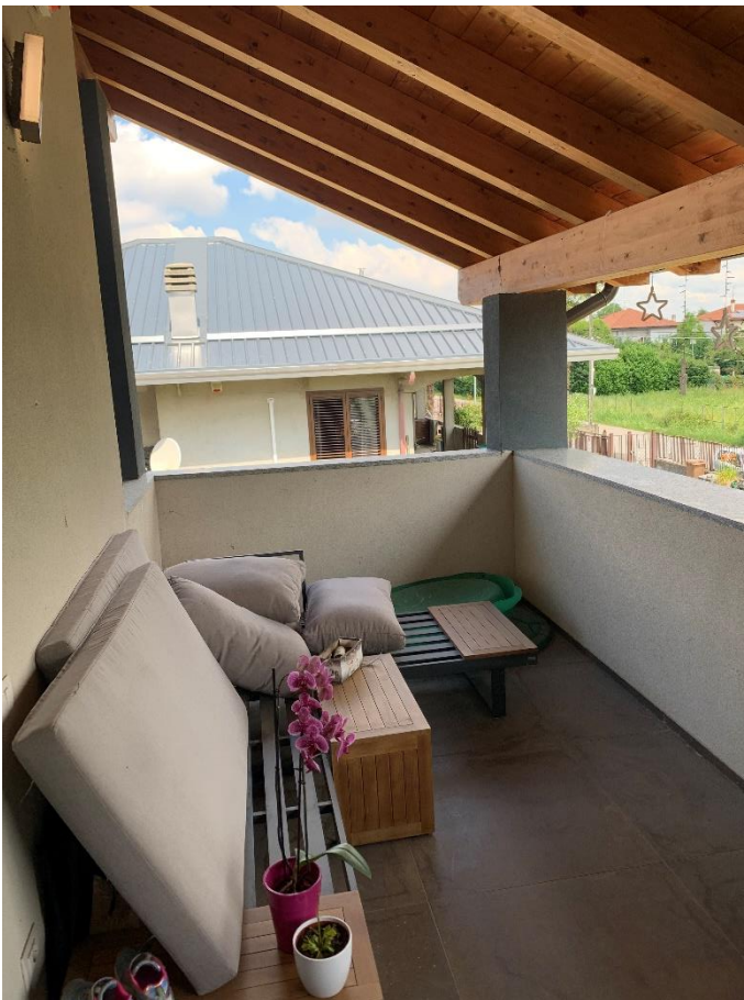
06- Terrazzo verso Via Leonacavallo