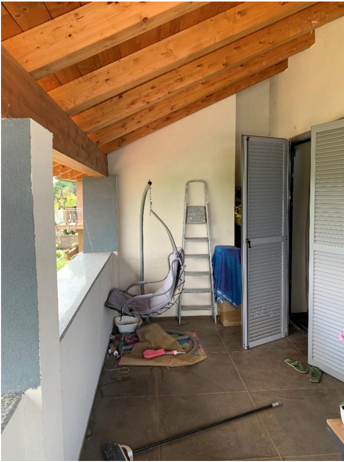
07-Terrazzo verso la Via Leoncavallo