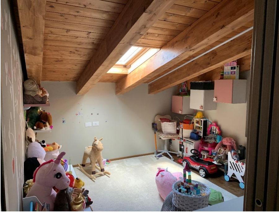
15-Camera 1 secondo livello