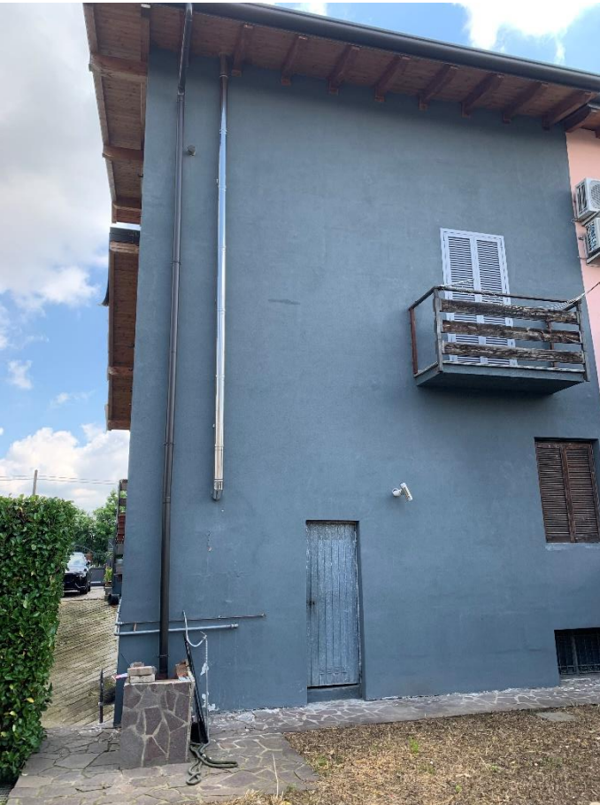
02-Edificio visto dal retro.