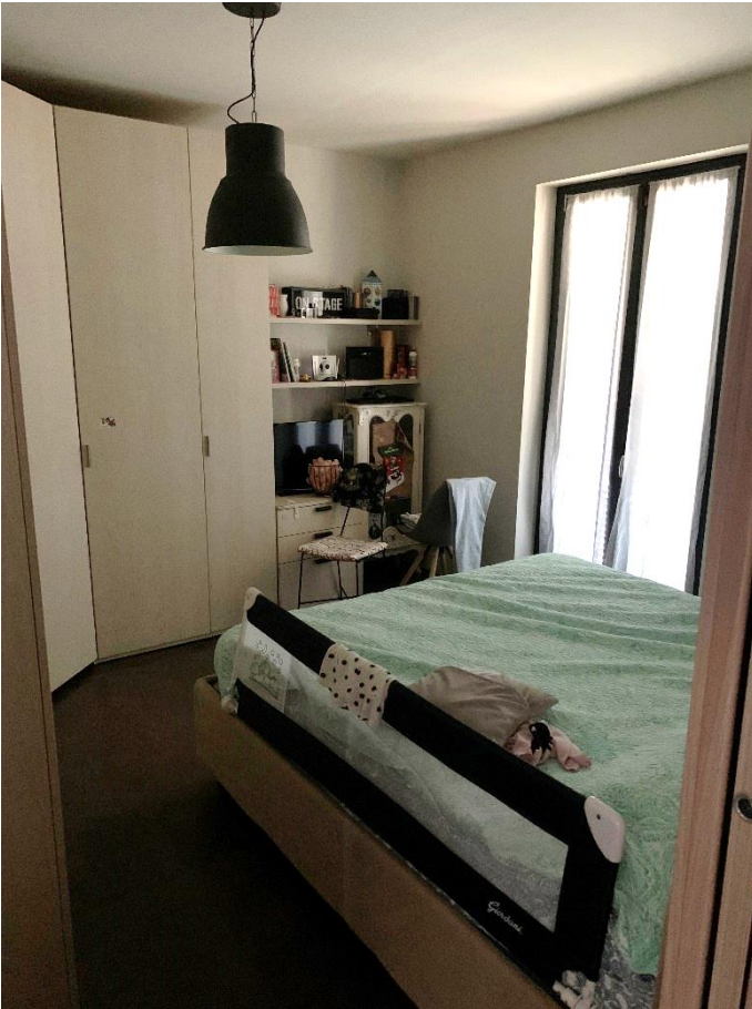
09-Camera matrimoniale primo livello