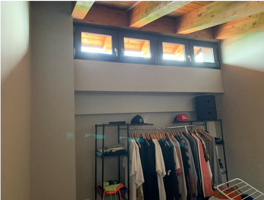
16-Camera 2 secondo livello