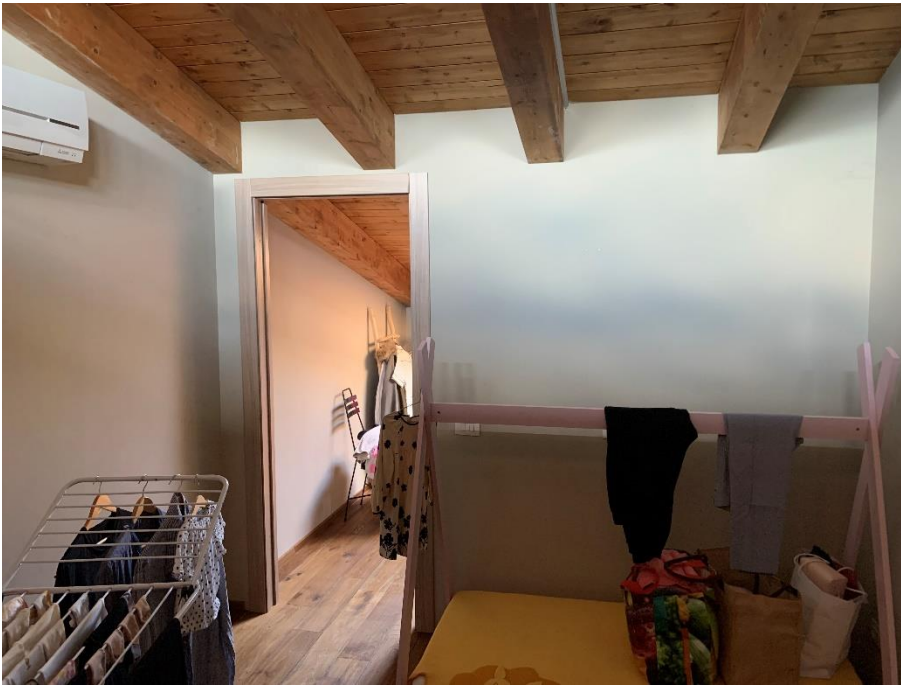
17-Camera 2 secondo livello