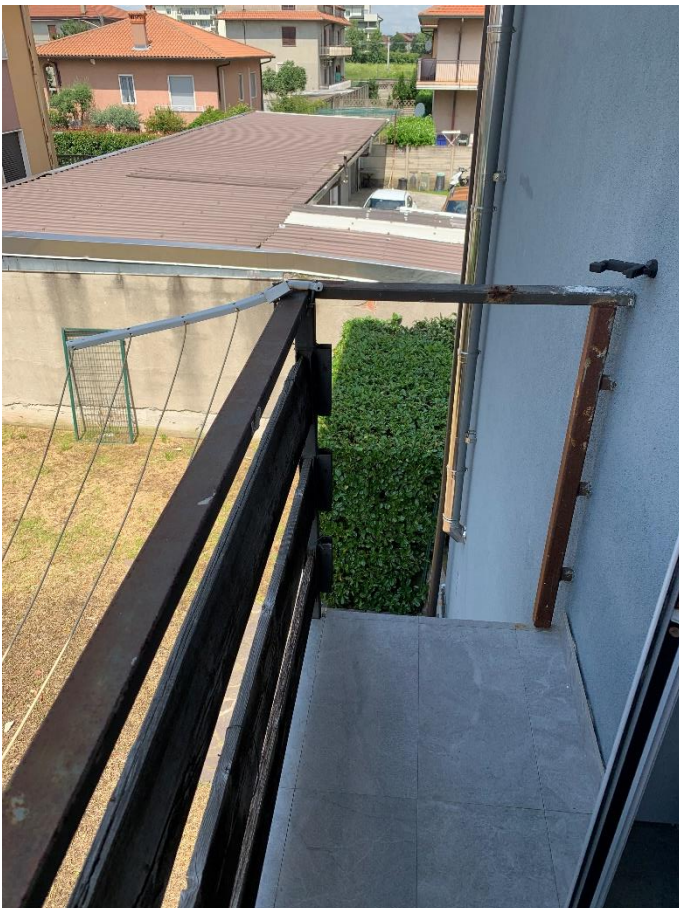
10-Balcone zona retro edificio dalla camera matrimoniale.