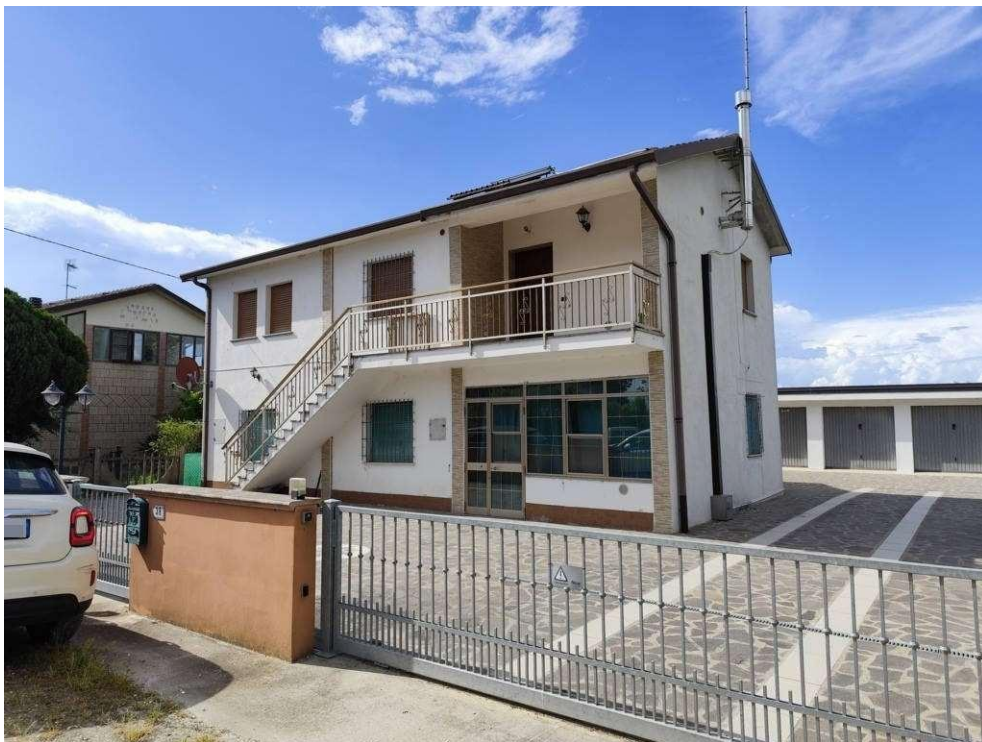
0.2 – prospetto sud su via Bonaglia Traversa Sesta