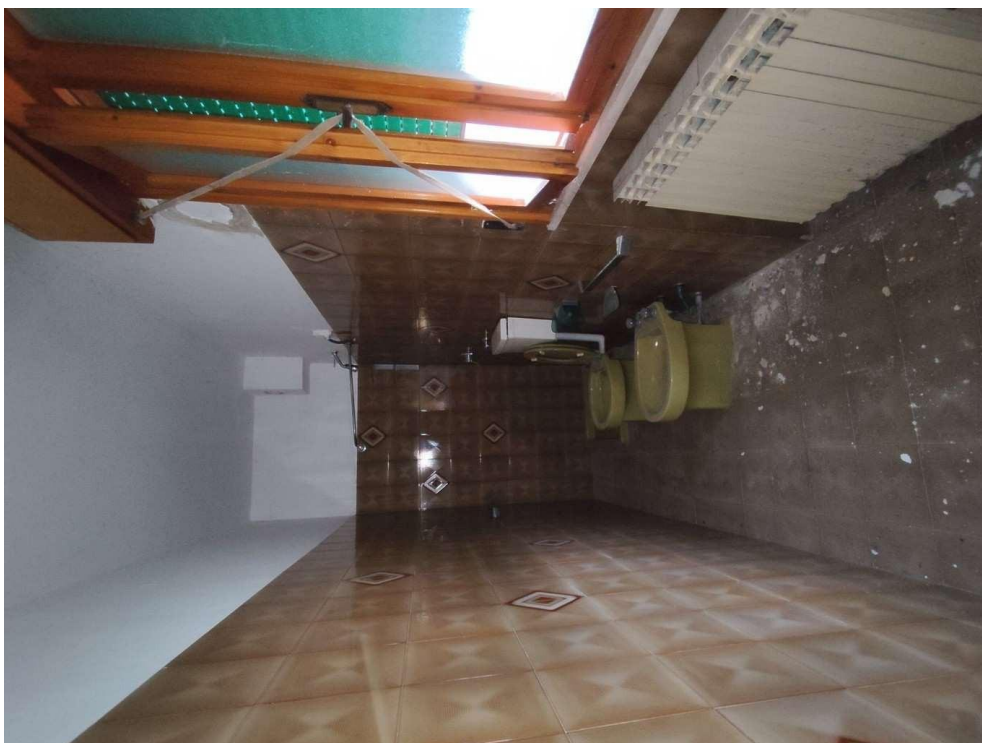
1.16 – bagno - vista 3