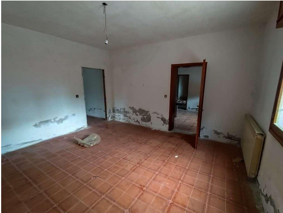
1.11 – letto 2 - vista 2