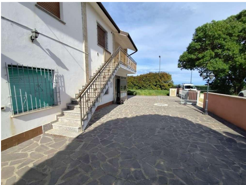
0.4 – corte comune lato sud