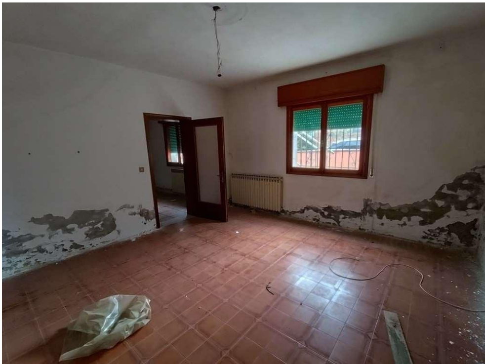
1.10 – letto 2 - vista 1