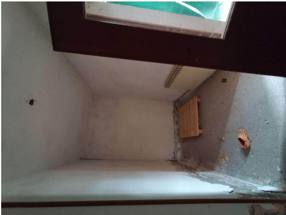
1.4 – ingresso - vista 2