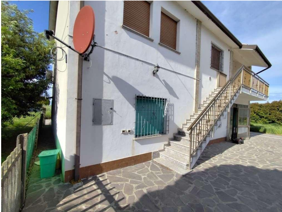
0.3 – prospetto sud