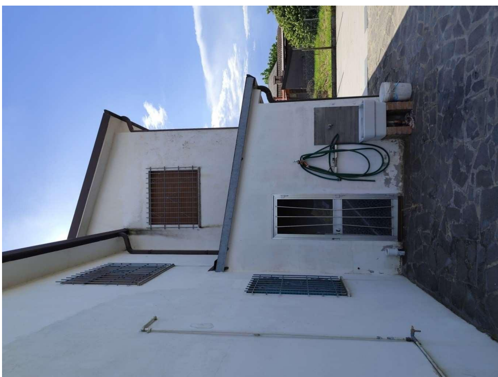
0.8 – ripostiglio esterno