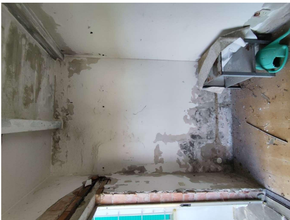
2.2 - ripostiglio - vista 2