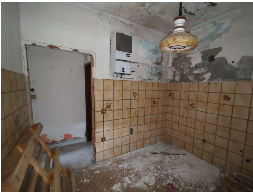
1.13 – cucina - vista 2