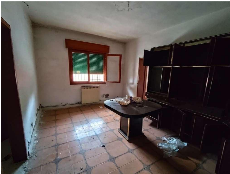
1.7 – soggiorno - vista 2