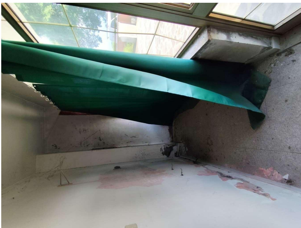
1.2 – veranda- vista 2