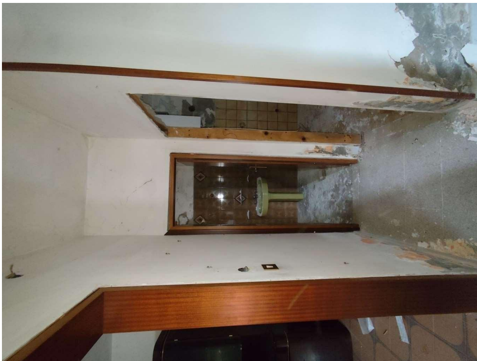
1.5 – ingresso - vista 3