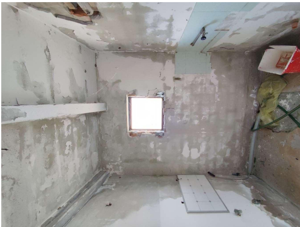
2.1 - ripostiglio - vista 1