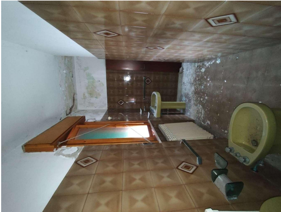
1.15 – bagno - vista 2