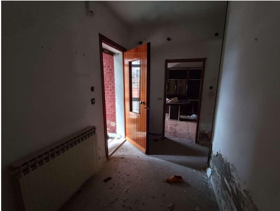
1.3 – ingresso - vista 1