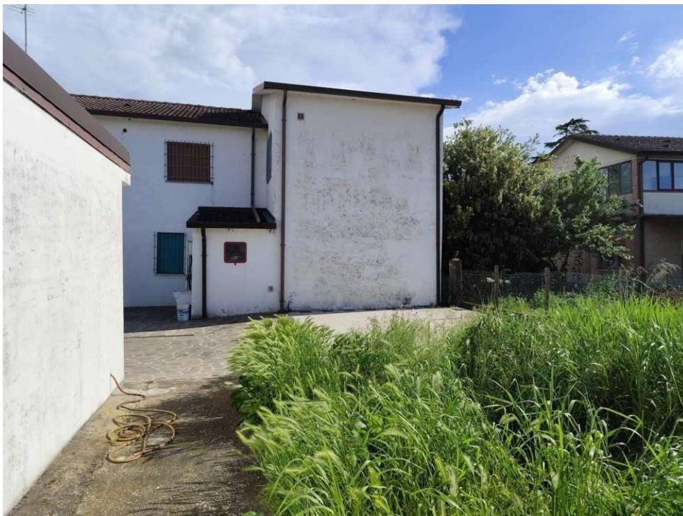
0.7 – vista da nord