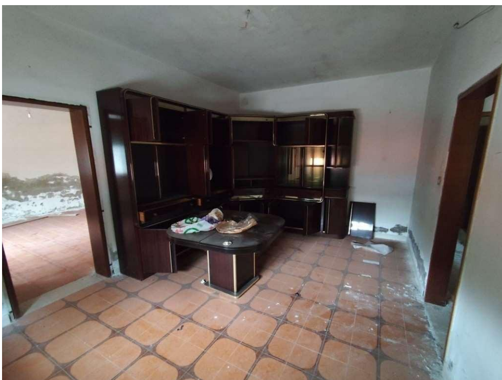
1.6 – soggiorno - vista 1