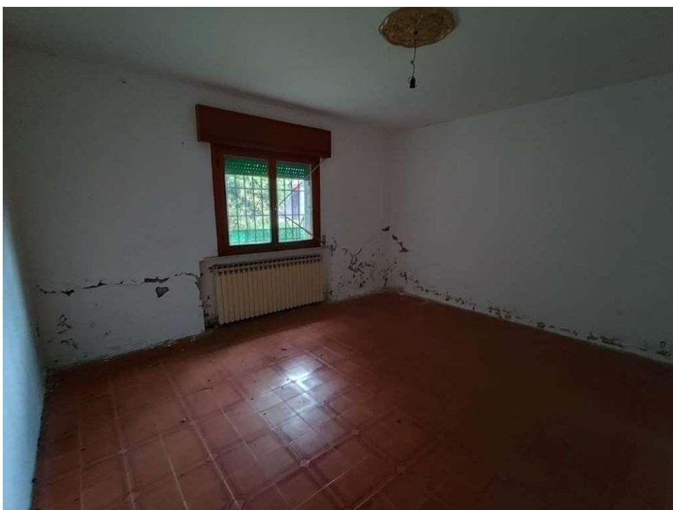
1.8 – letto 1 - vista 1