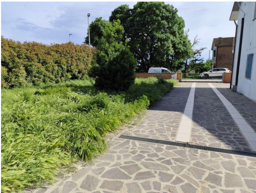
0.5 – corte comune ad est