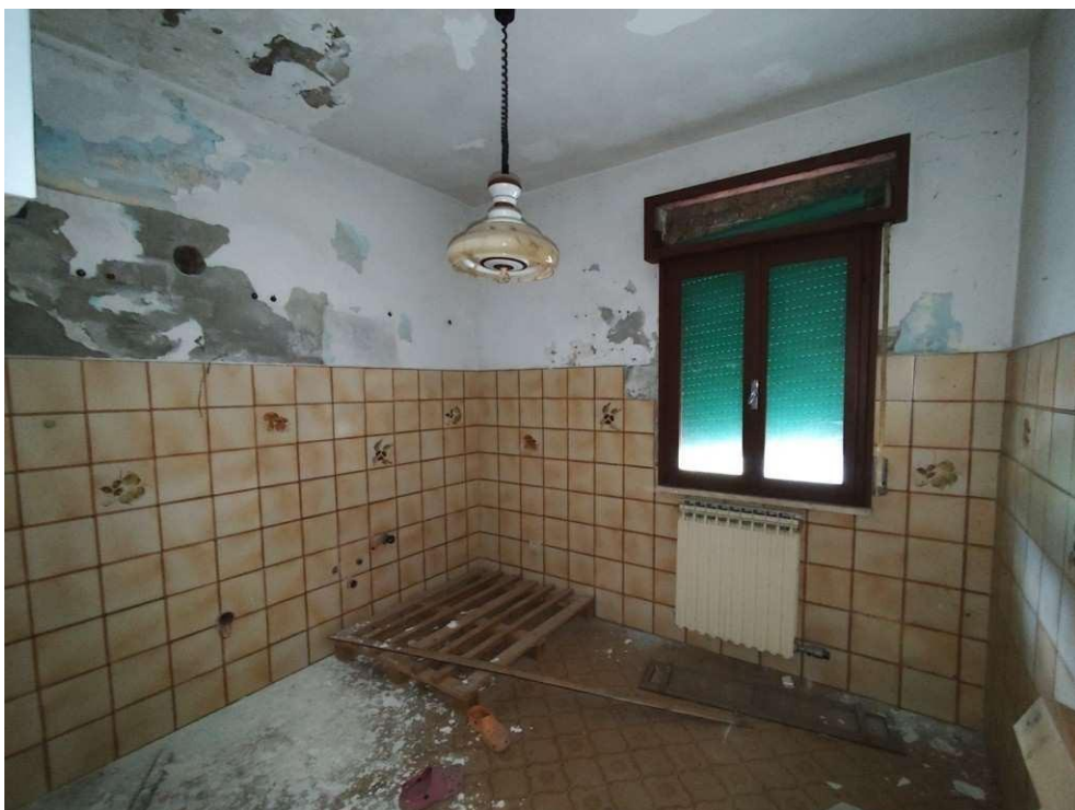
1.12 – cucina - vista 1