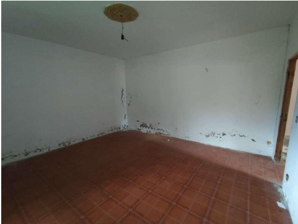
1.9 – letto 1 - vista 2