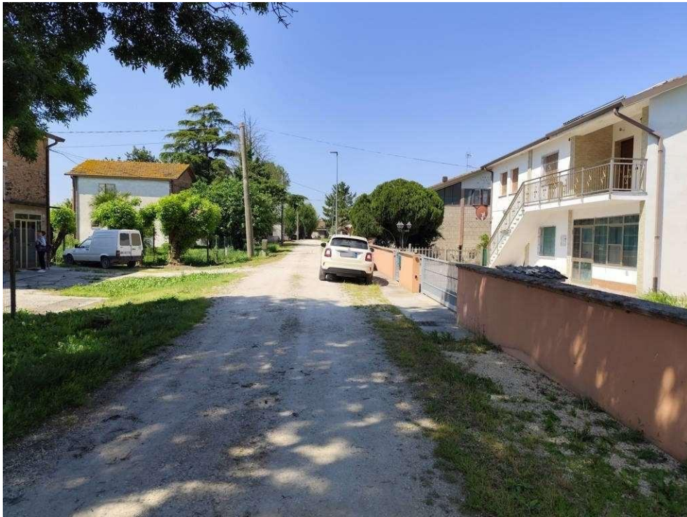
0.1 – via pubblica