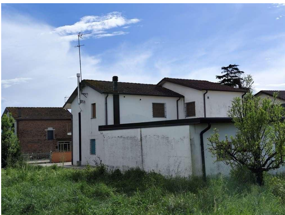
0.6 – vista da nord