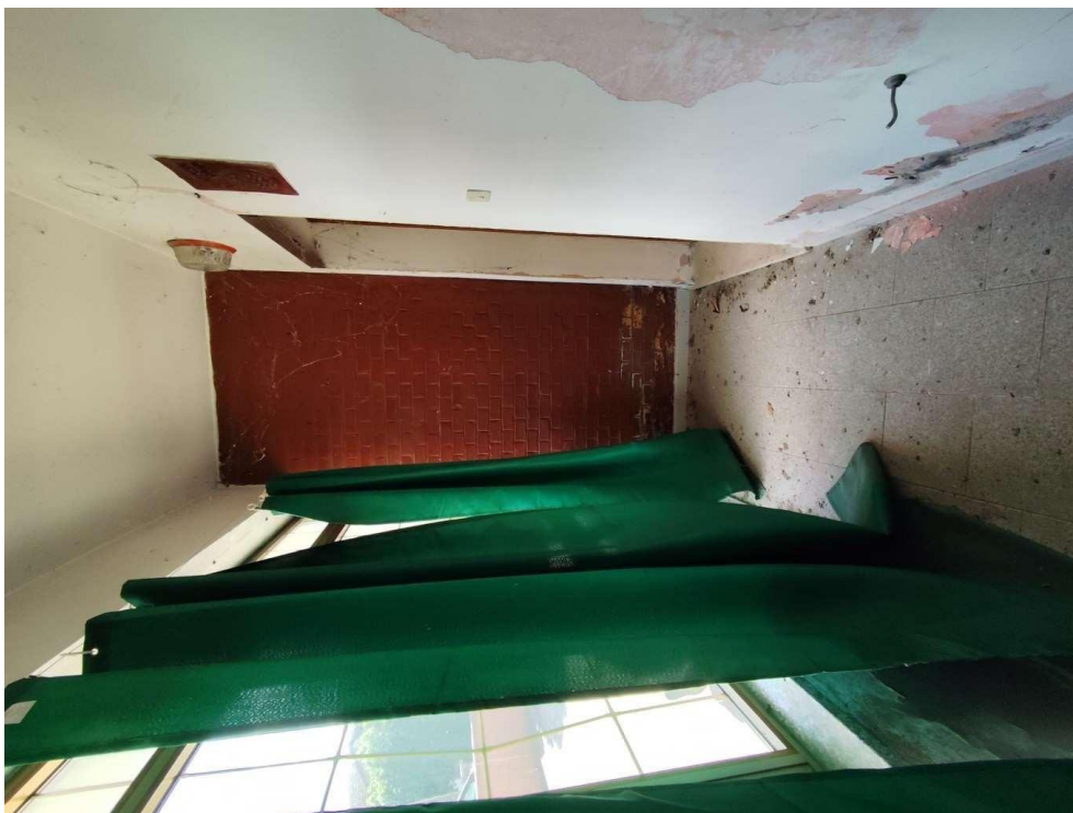
1.1 – veranda- vista 1