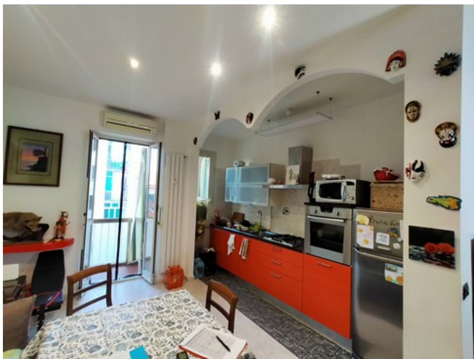
Locali soggiorno e zona preparazione cibi