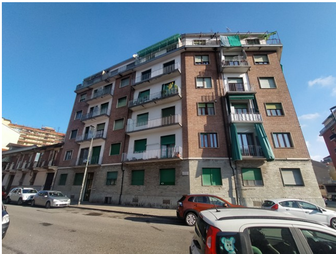
Immobile condominiale visto da Via Boito

L'intero edificio sviluppa 7 piani, 6 piani fuori terra (di cui uno arretrato), 1 piano seminterrato. Immobile costruito circa nel 1958