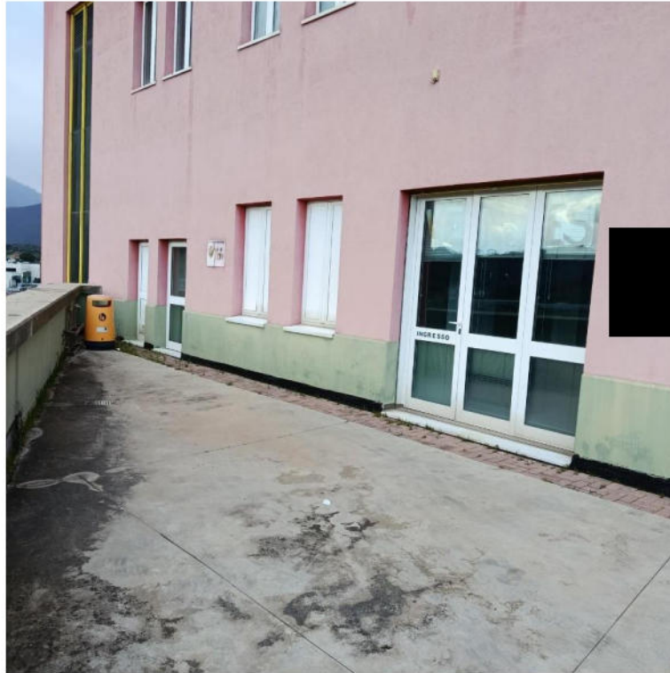
INGRESSO DA PIAZZALE CARRABILE