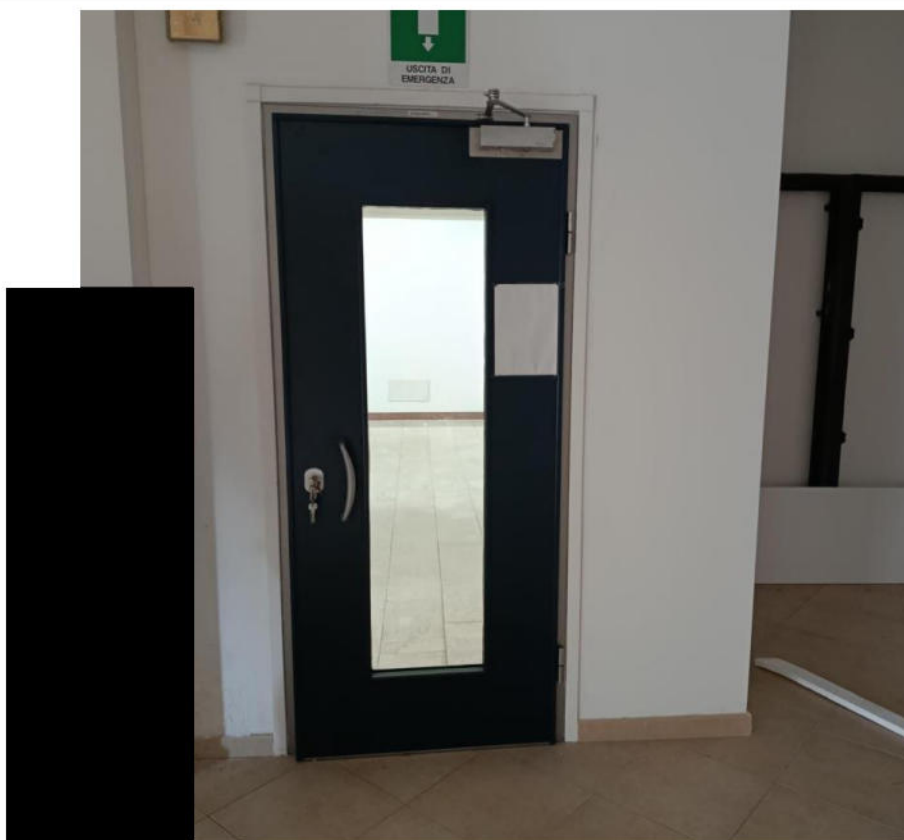
PORTA DI ACCESSO (SU SUB 37)