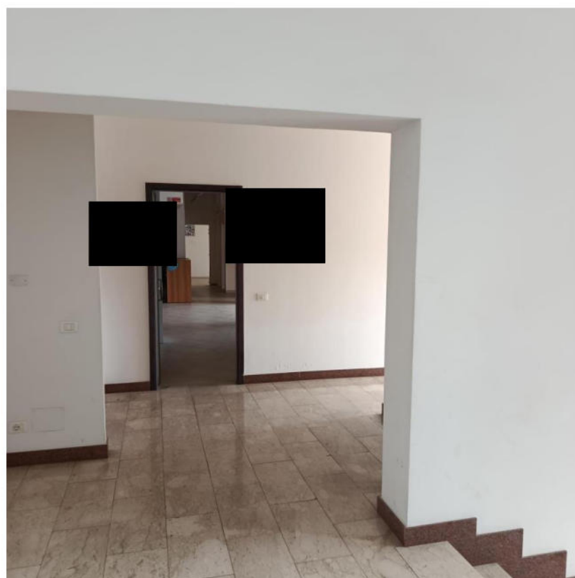
INGRESSO VISTO DA PIANEROTTOLO