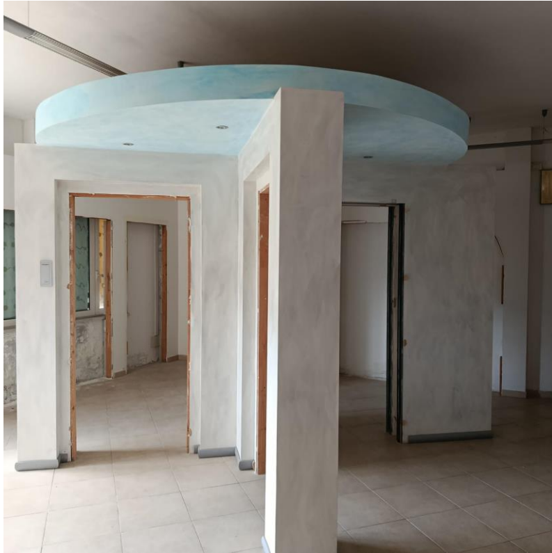
INTERNO UIU ESECUTATA