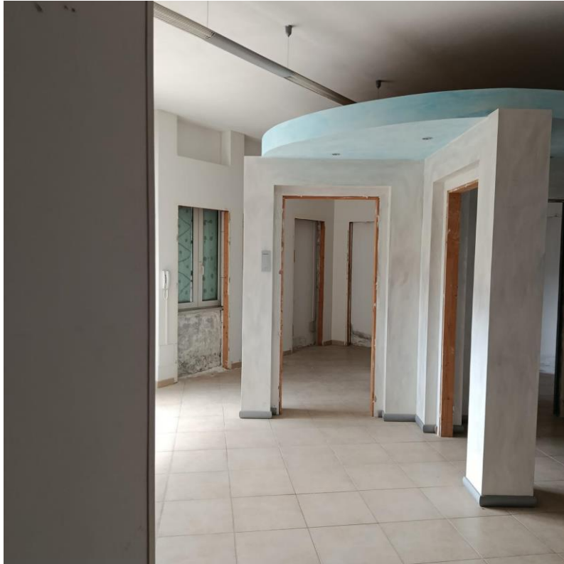
INTERNO UIU ESECUTATA