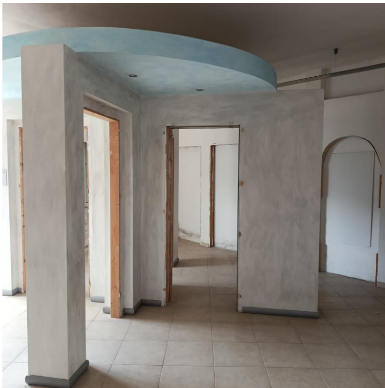
INTERNO UIU ESECUTATA