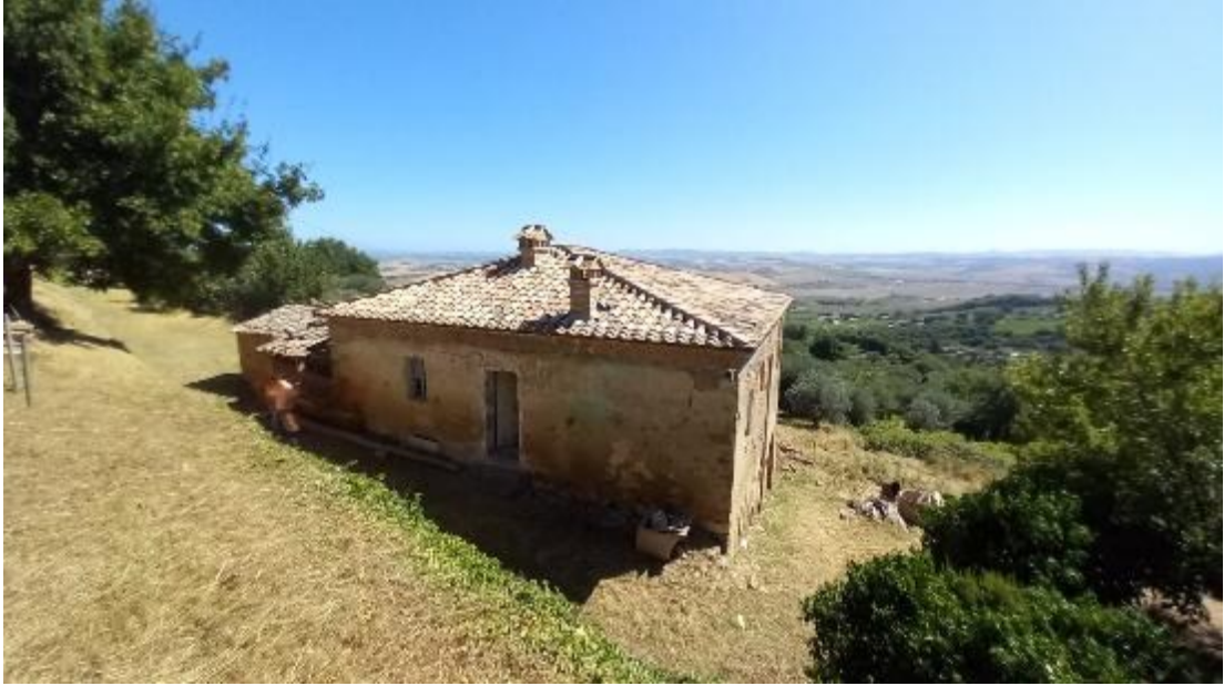
Vista sud ovest