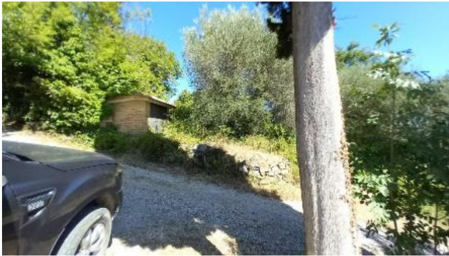
Accesso da strada vicinale