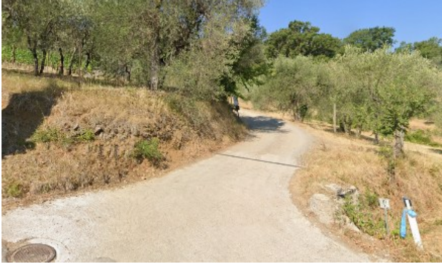
Ingresso da S.P. del Brunello ( km 7.600)