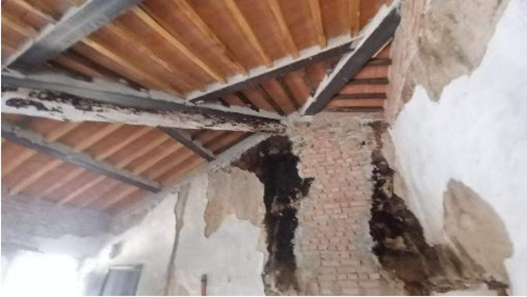
Dettaglio restauro copertura piano terra