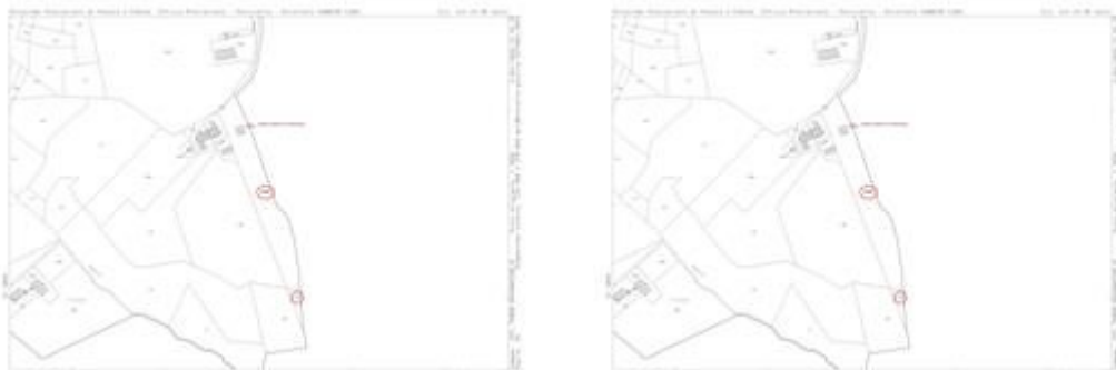
Estratto di mappa