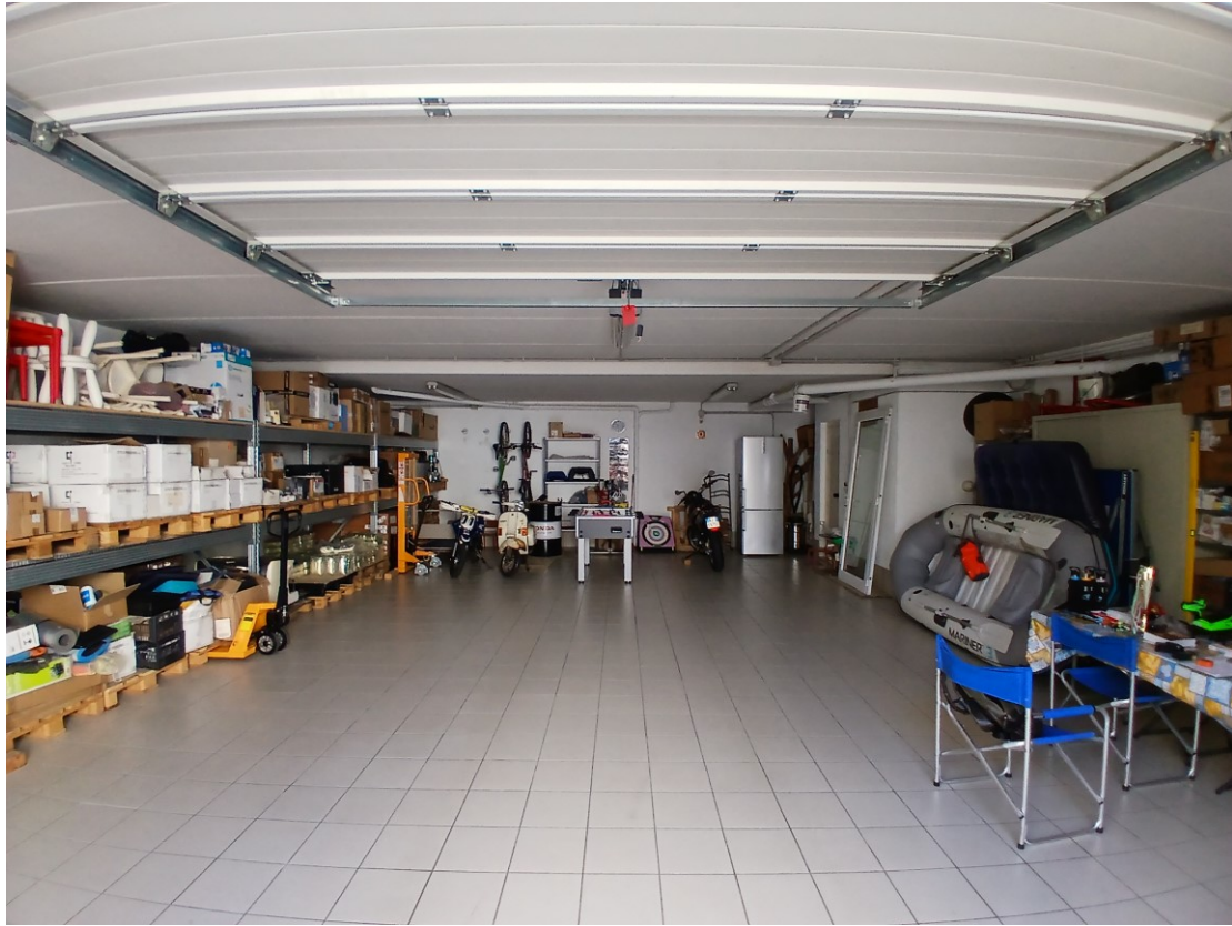
Foto 5 Vista Interna Locale di piano interrato