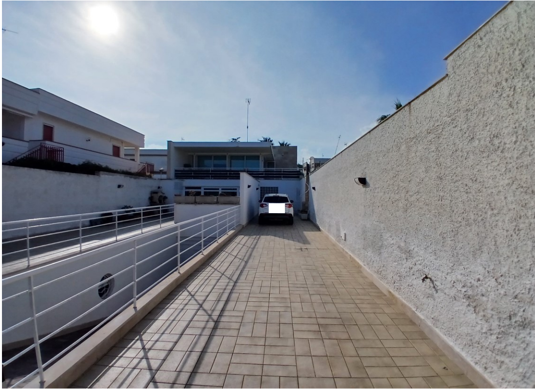
Foto 4 Vista Esterna Accesso Carrabile