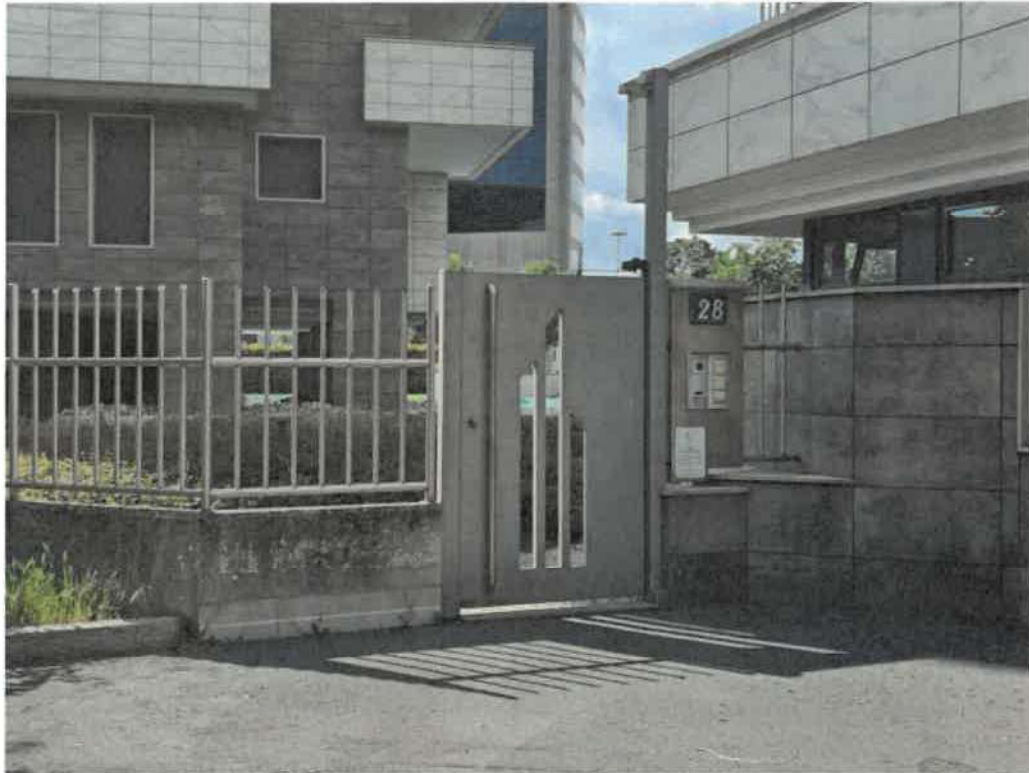
Portoncino su strada