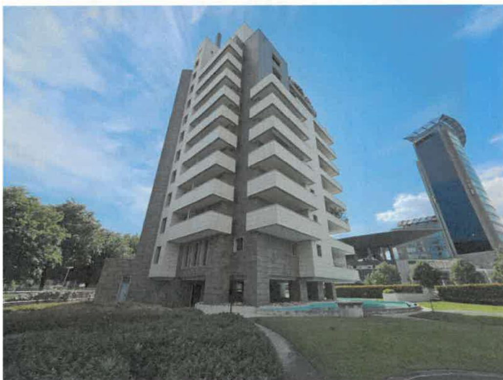
Viste esterne del complesso immobiliare