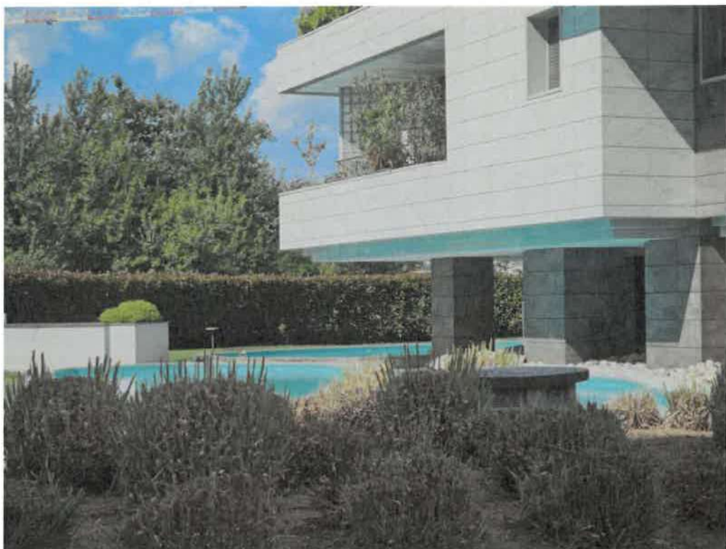
Parti comuni esterne