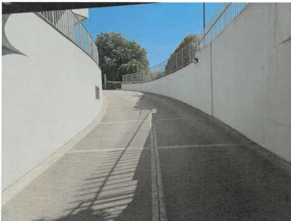
Rampa di accesso box