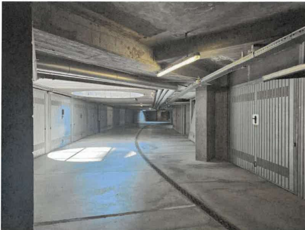
Corsello piano box