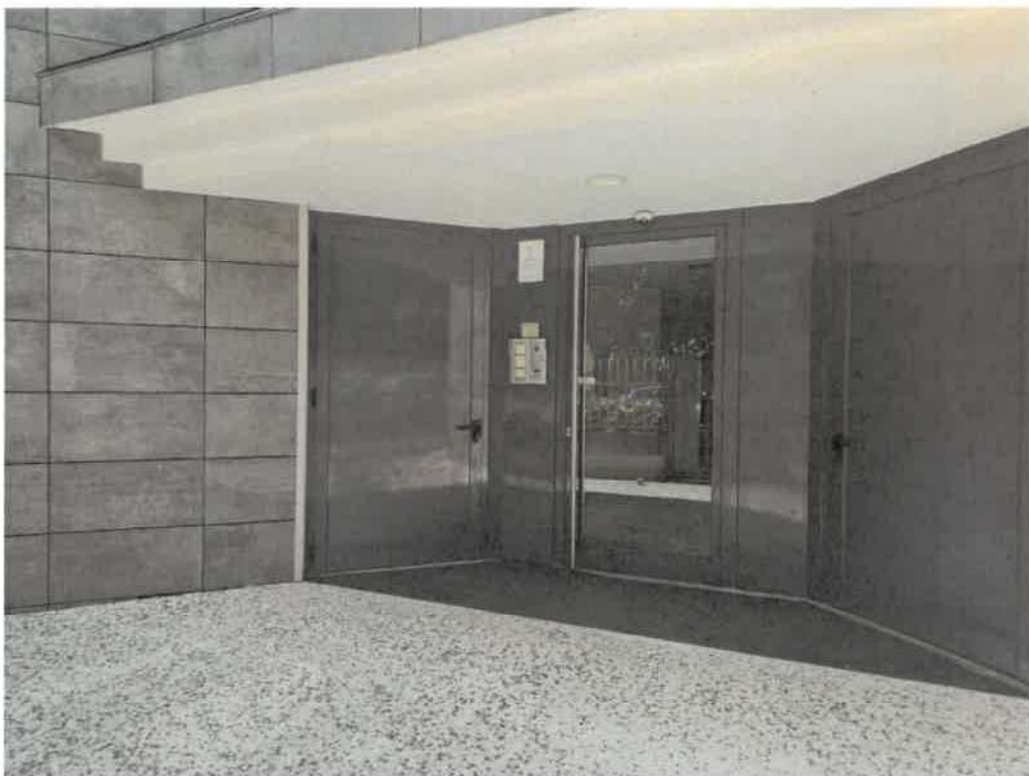
Portoncino di accesso al fabbricato (analogo per i civici 26 e 28)