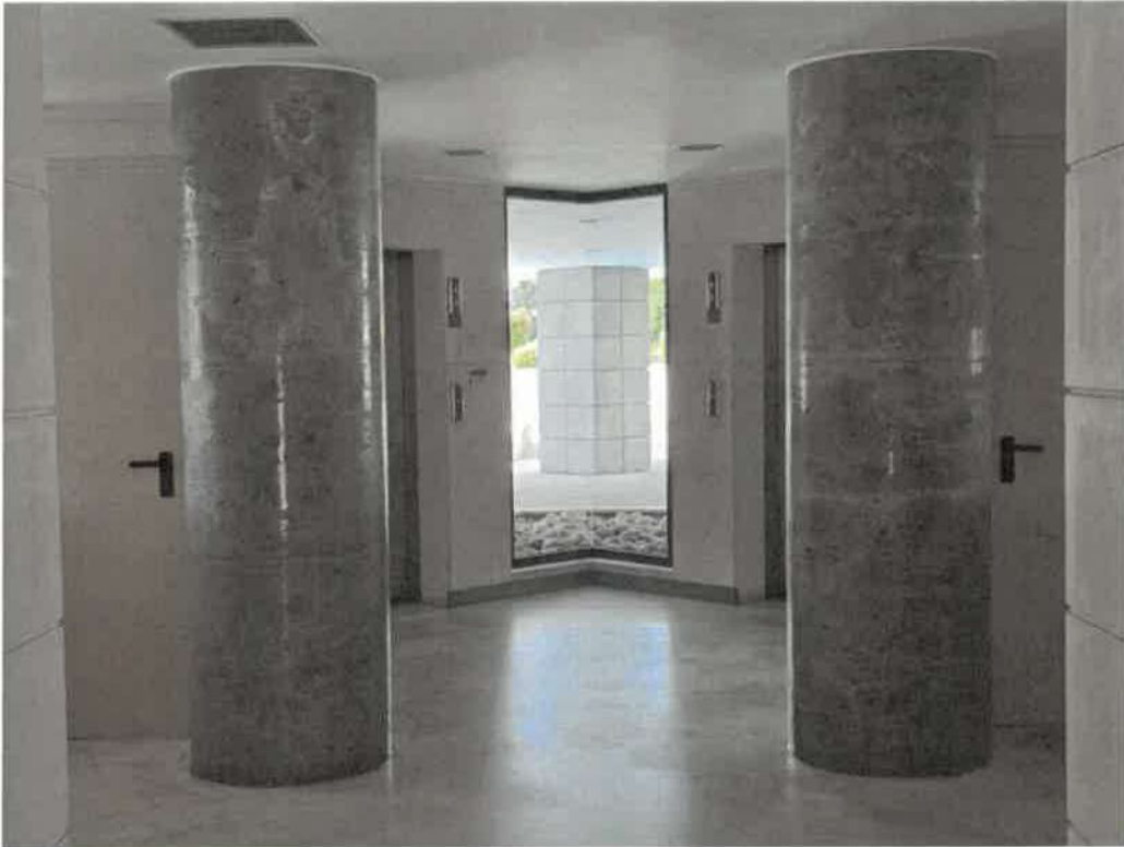
Androne di ingresso (analogo per i civici 26 e 28)