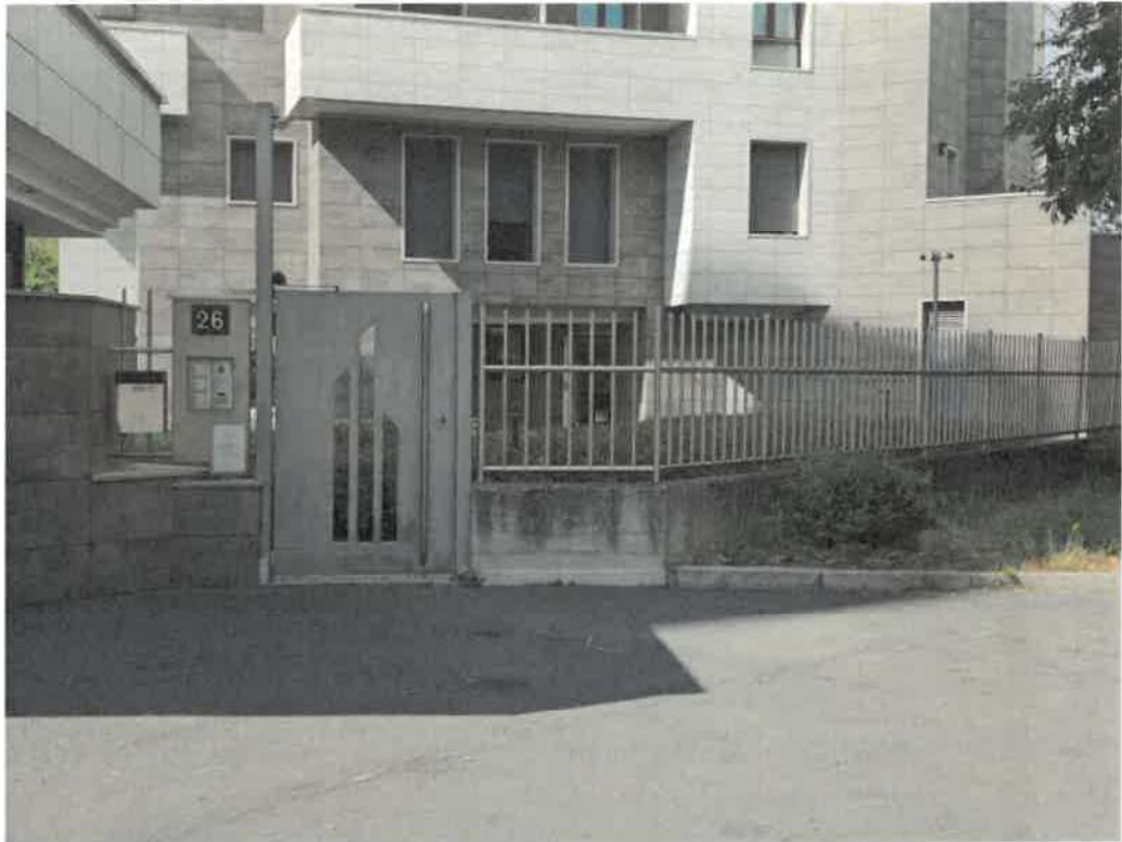
Portoncino di ingresso pedonale al complesso immobiliare