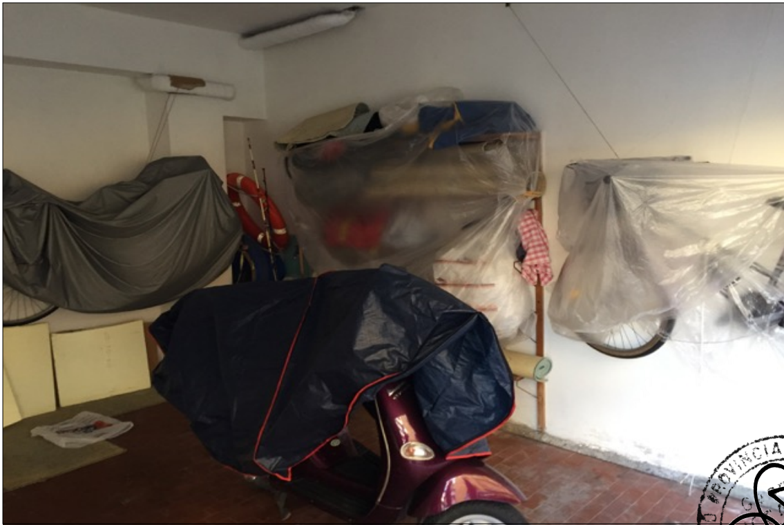
FOTO N° 29: Vista interna box auto n° 1 Via Privata Castagneto 58.