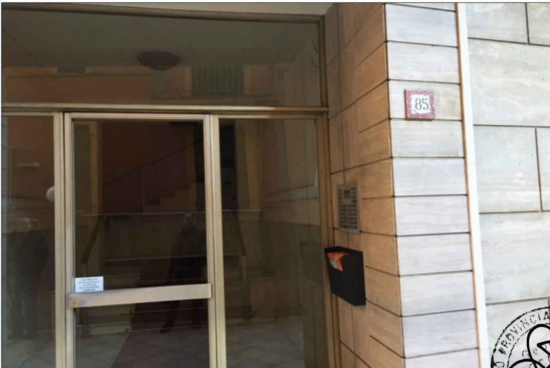
FOTO N° 6: Particolare del portone di accesso immobile Corso Assereto 85.