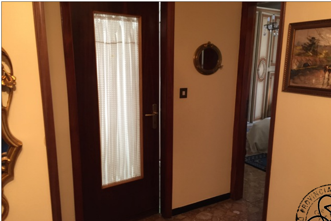
FOTO N° 10: Vista disimpegno appartamento interno 29 Corso Assereto 85.