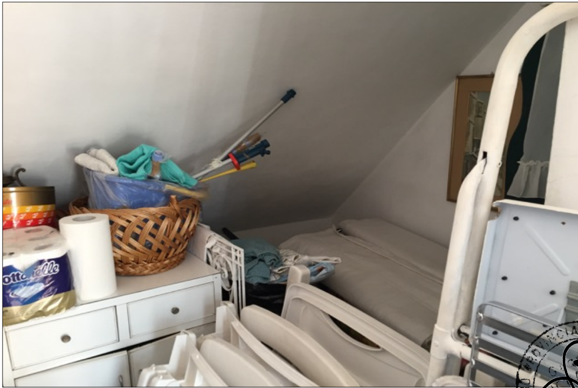
FOTO N° 21: Vista ripostiglio esterno appartamento interno 29 Corso Assereto 85.