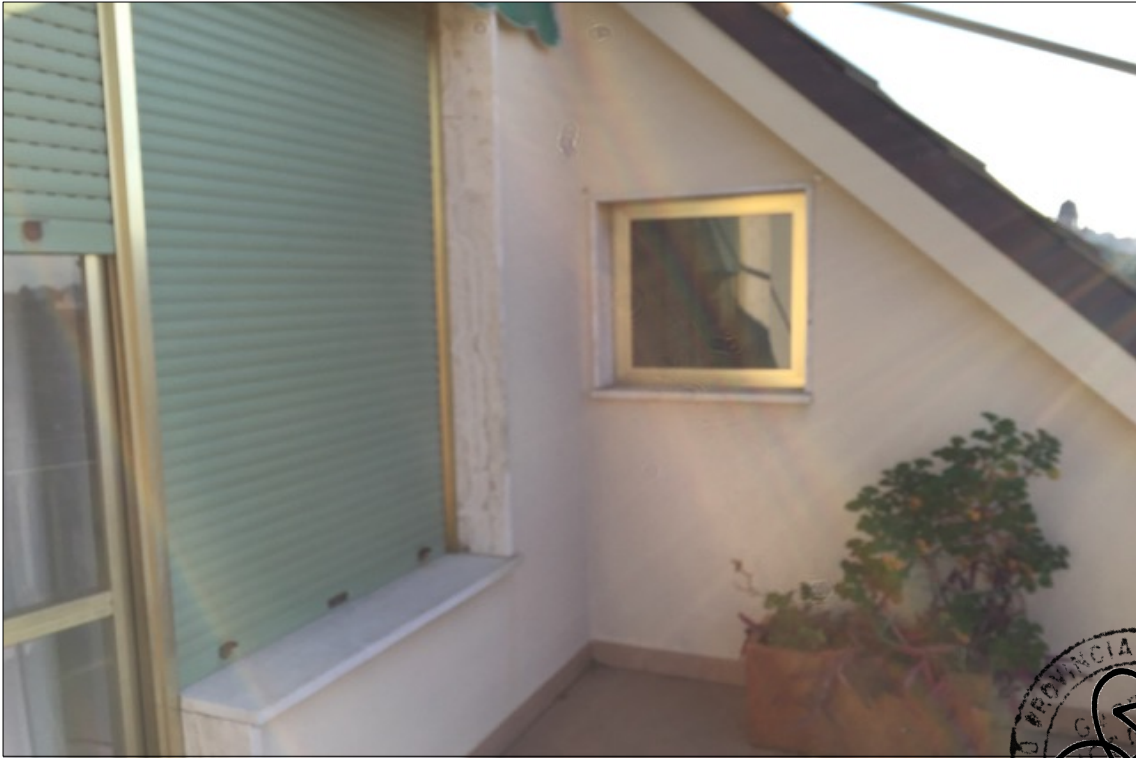
FOTO N° 23: Vista terrazzo Sud appartamento interno 29 Corso Assereto 85