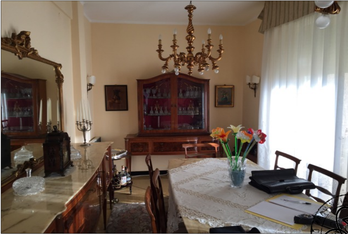
FOTO N° 11: Vista soggiorno appartamento interno 29 Corso Assereto 85.