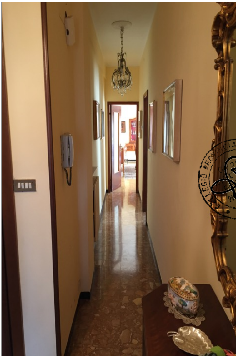
FOTO N° 9: Vista corridoio appartamento interno 29 Corso Assereto 85.