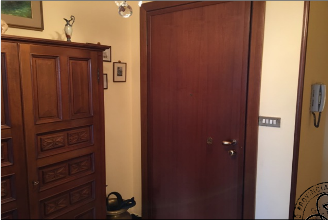
FOTO N° 7: Vista ingresso appartamento interno 29 Corso Assereto 85.