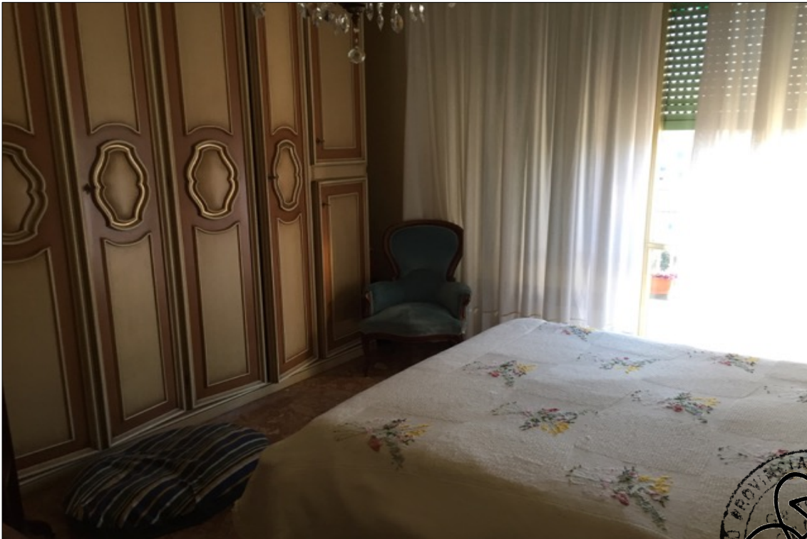
FOTO N° 14: Vista camera appartamento interno 29 Corso Assereto 85.