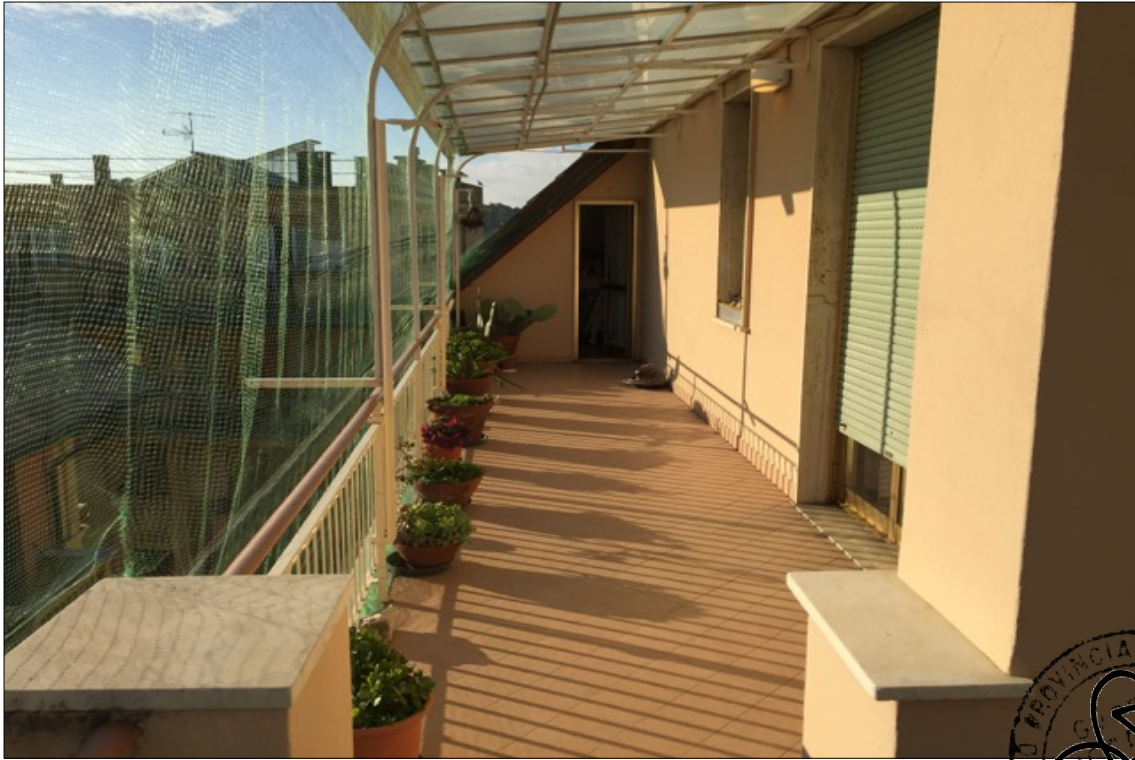
FOTO N° 19: Vista terrazzo Est appartamento interno 29 Corso Assereto 85.