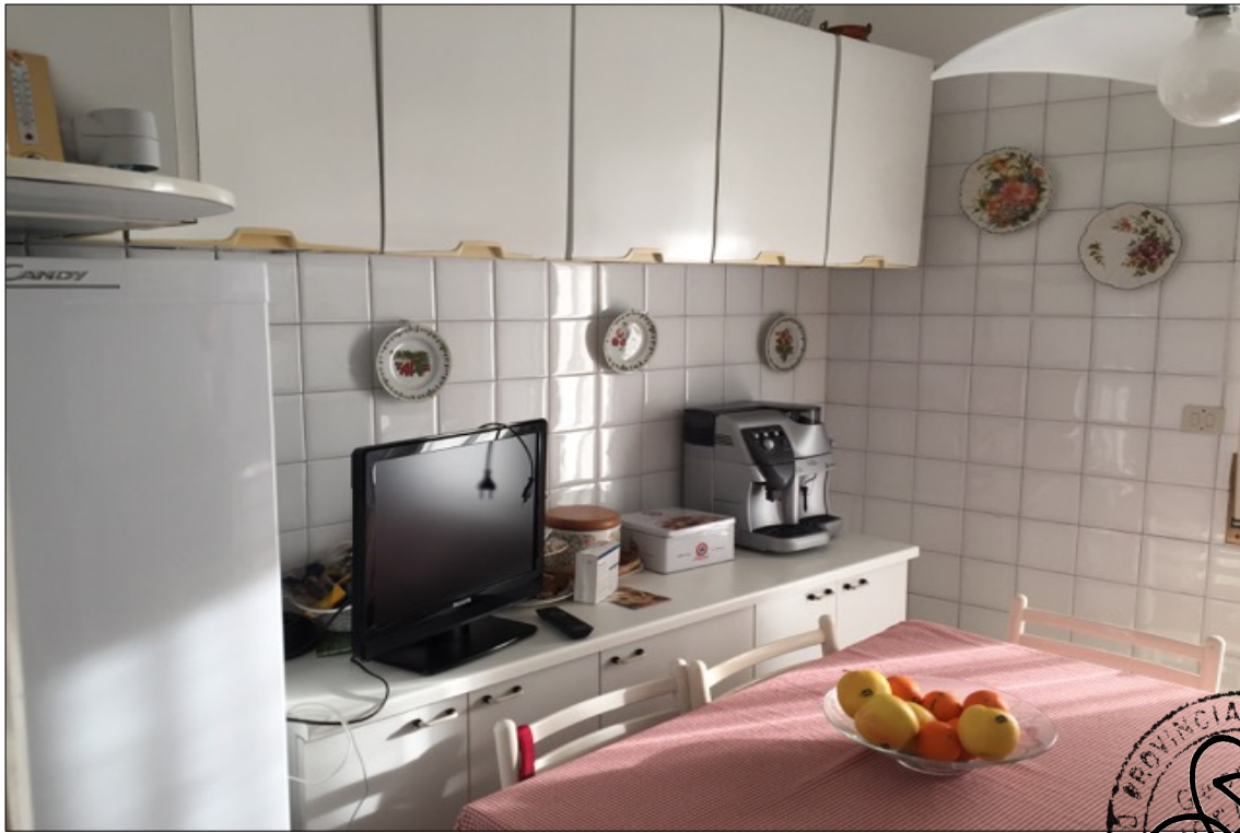
FOTO N° 15: Vista cucina appartamento interno 29 Corso Assereto 85.