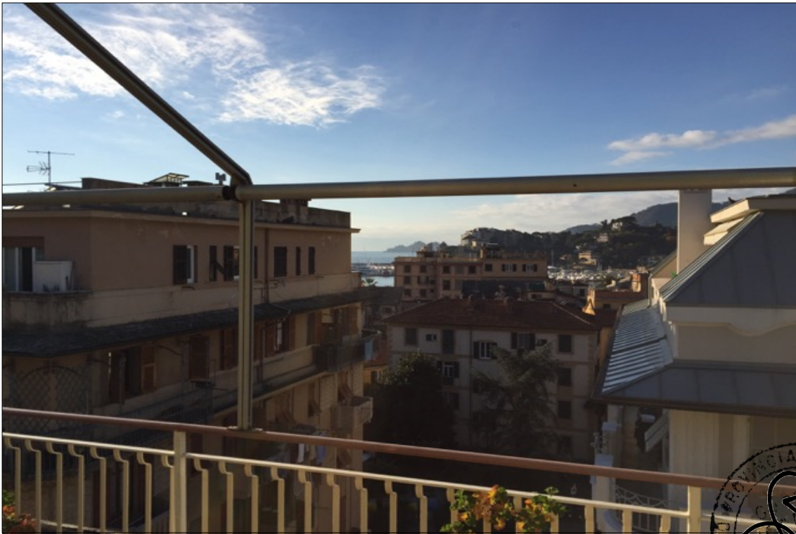
FOTO N° 25: Vista panoramica esterna da appartamento Corso Assereto 85.