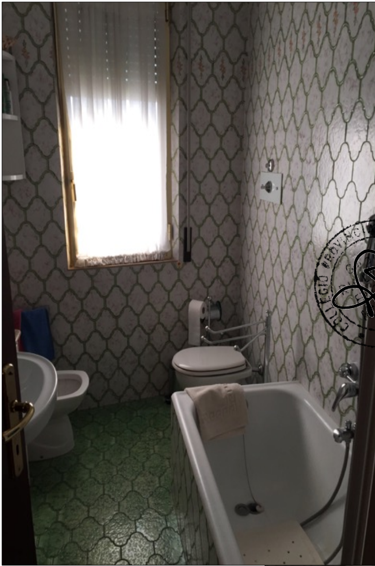
FOTO N° 17: Vista bagno appartamento interno 29 Corso Assereto 85.