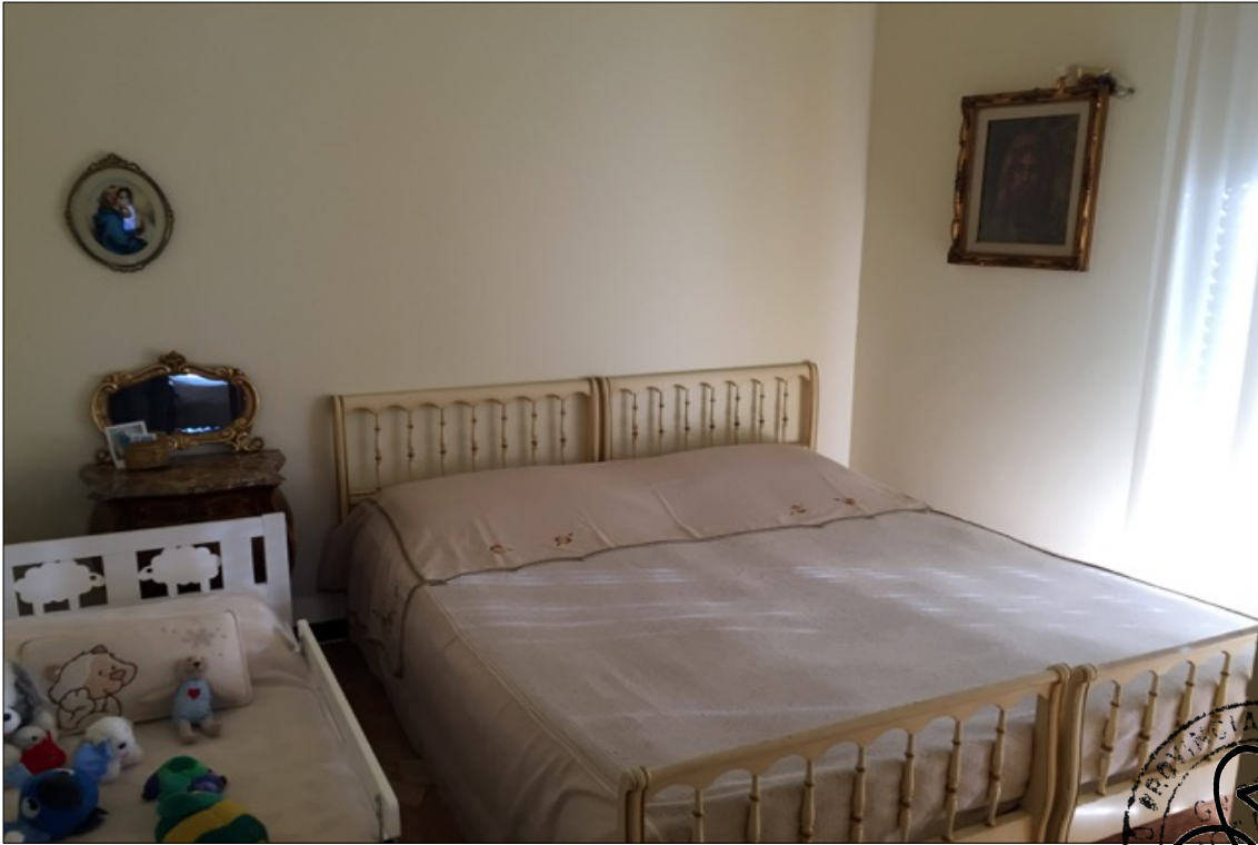
FOTO N° 13: Vista camera appartamento interno 29 Corso Assereto 85.