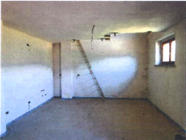
F.02 – Interno – Soggiorno/pranzo