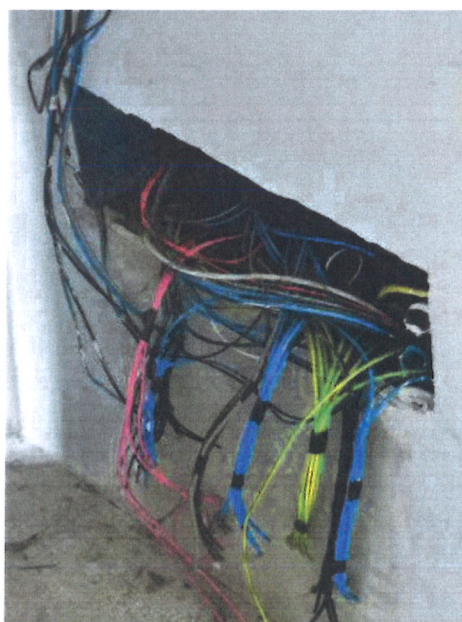
F.07 – Part. Impianto elettrico