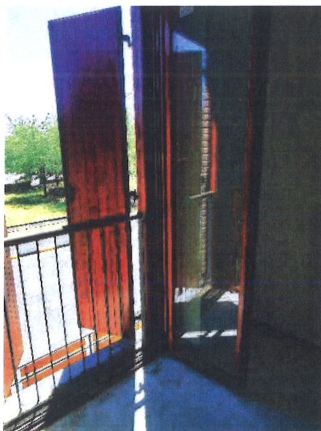
F14 – Serramenti interni/esterni