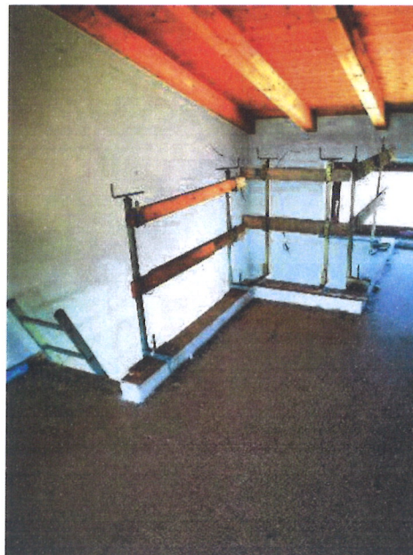
F.11 – Locale accessorio piano sottotetto