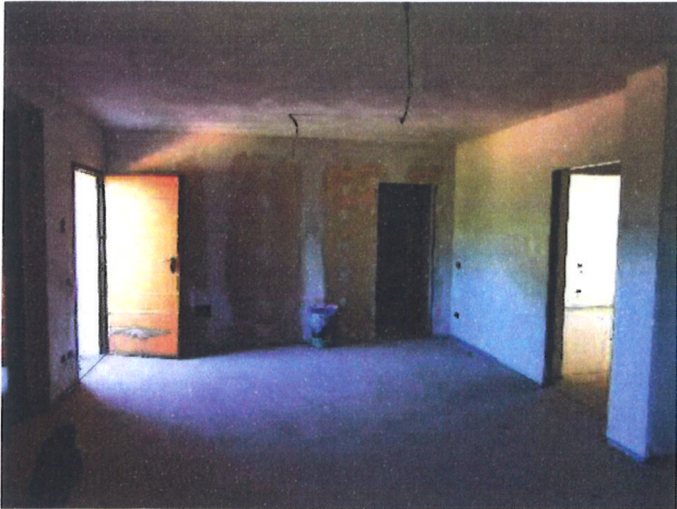
F.01 – Interno – Soggiorno/pranzo