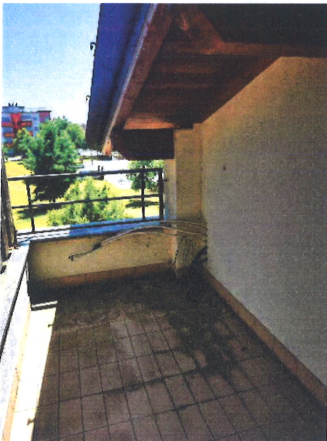
F.10 – Terrazza secondaria