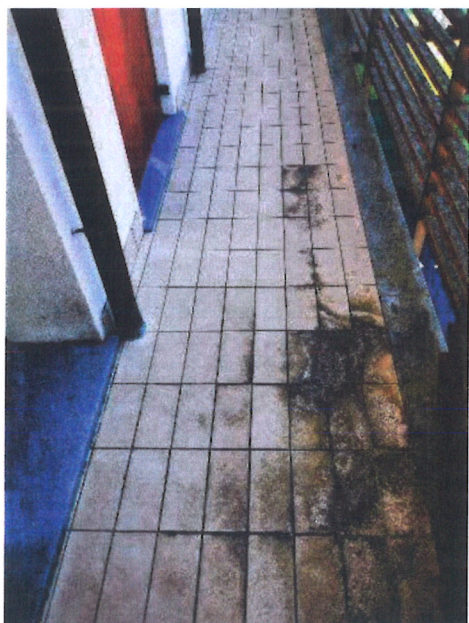
F13 – Ballatoio d'ingresso