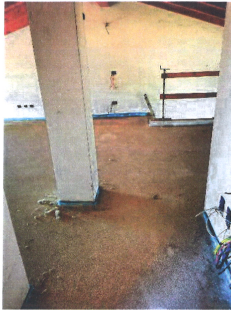
F.09 – Locale accessorio piano sottotetto