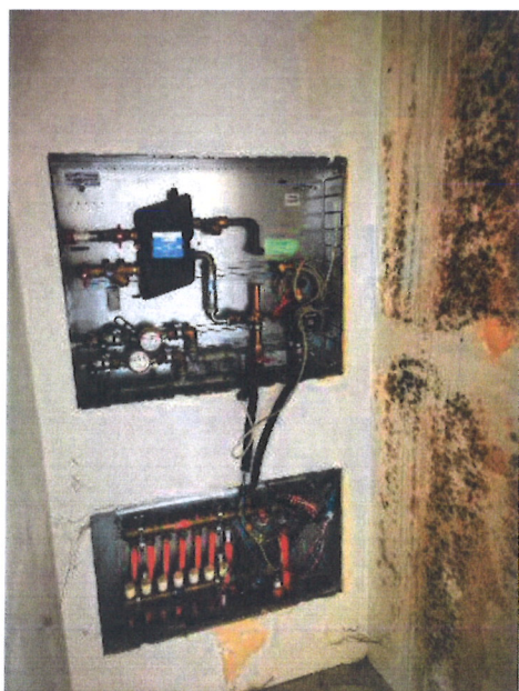
F.06 – Part. Impianto riscaldamento