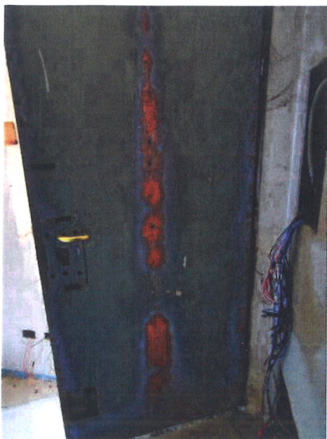
F.04 – Part. portoncino blindato