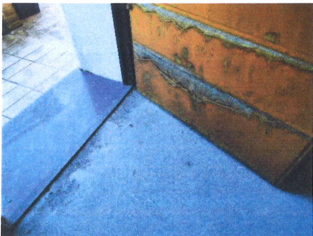
F.03 – Soglia d'ingresso e portoncino blindato