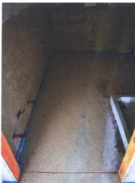
F.05 – Interno – Locale bagno