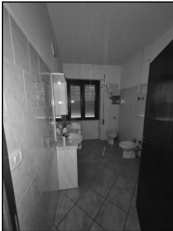
Foto 19 camera