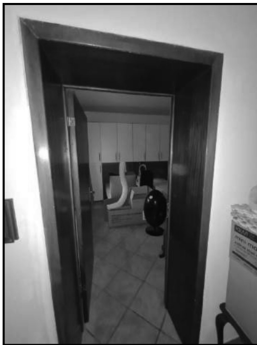
Foto 21 camera alla quale è stata scorporata una porzione di superficie e accorpata all'imm. 4

Foto 20 camera alla quale è stata scorporata una porzione di superficie e accorpata all'imm. 4