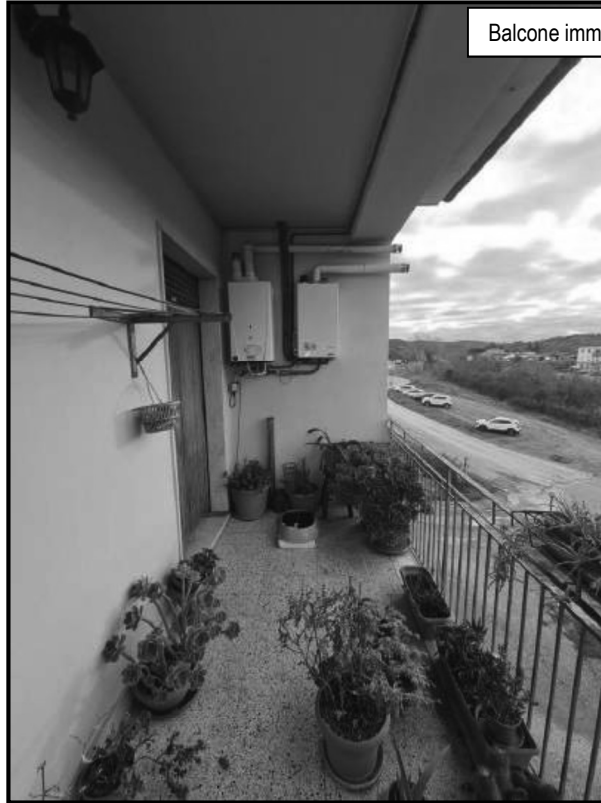
Balcone imm. 4 con caldaia

Foto 22 caldaia a servizio imm. 3 su balcone dell'imm. 4