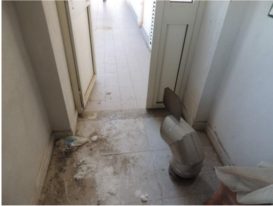
Locale di sgombero