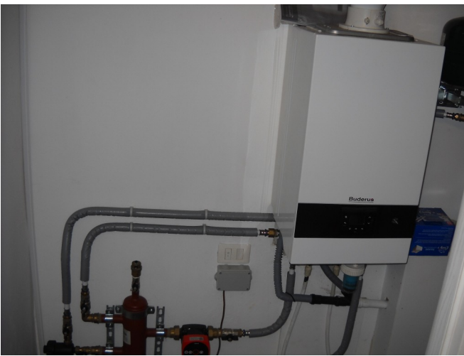
Caldaia piano secondo mansardato