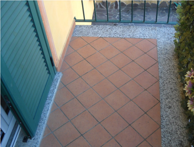
Balcone piano 1°