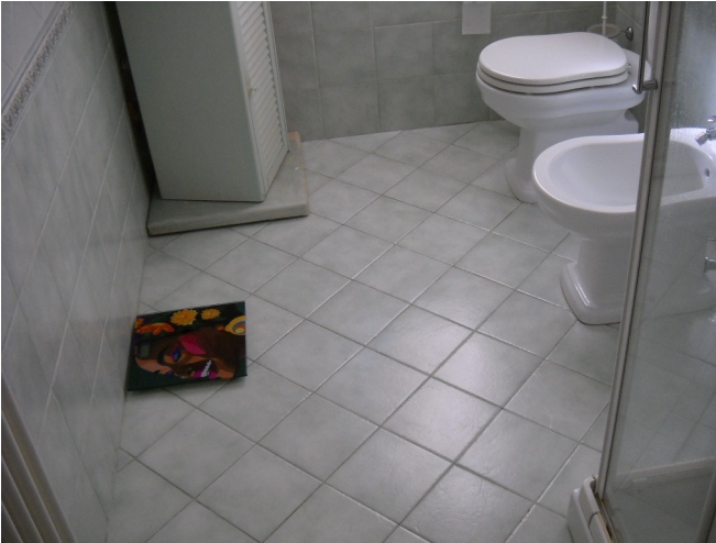
Bagno piano 1°