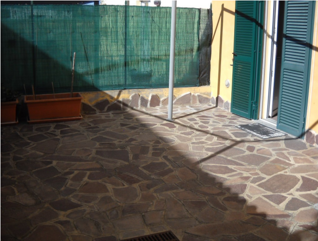
Cortile sul retro