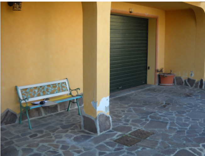
Cortile ed ingresso carroia lato strada