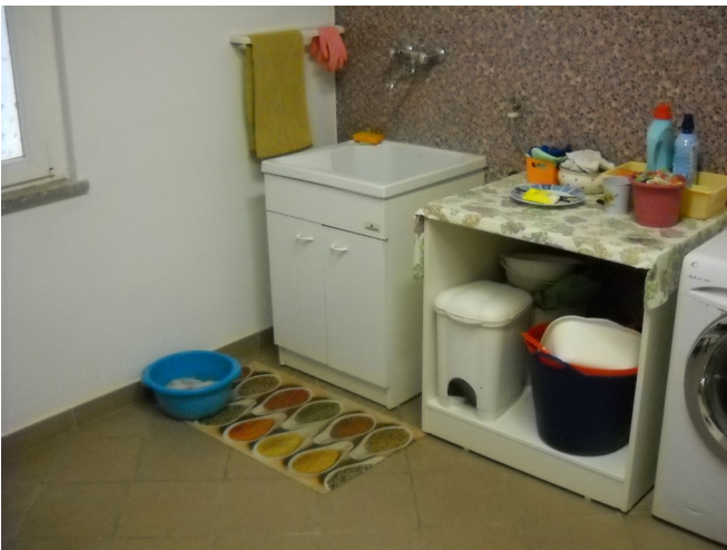
Lavanderia piano terreno