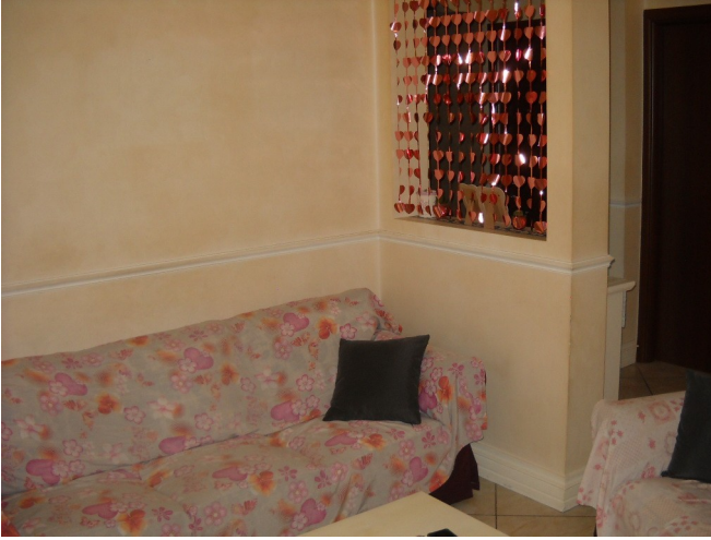
Divisorio soggiorno non rappresentato su planimetrie catastali