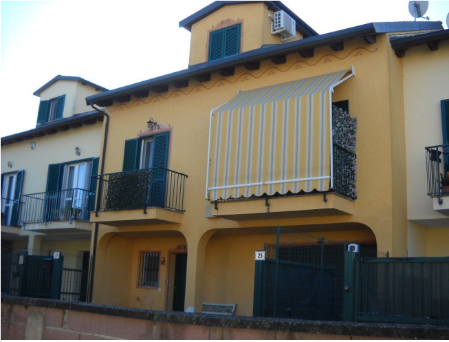
Prospetto lato strada