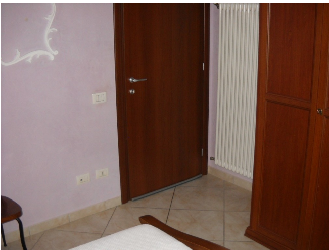
Camera matrimoniale piano 1°