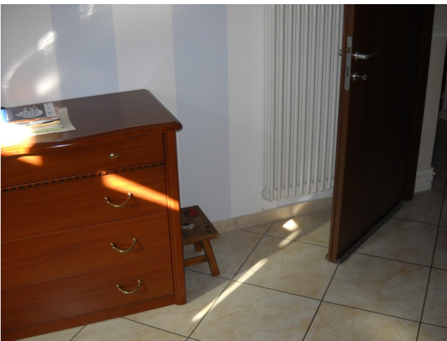
Camera piano 1°