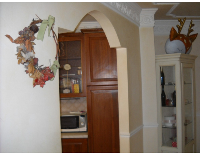
Divisorio cucina non rappresentato su planimetrie catastali