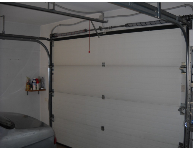
Baculante motorizzato rimessa piano terreno