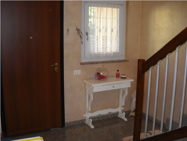
Ingresso piano terreno