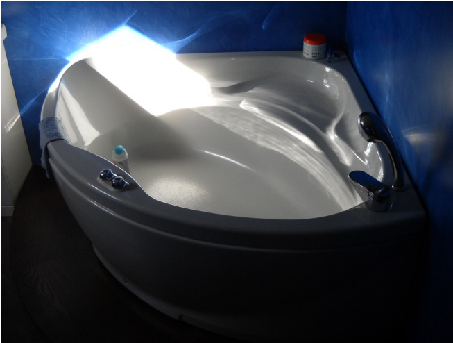
Bagno piano secondo mansardato non rappresentato su planimetrie catastali