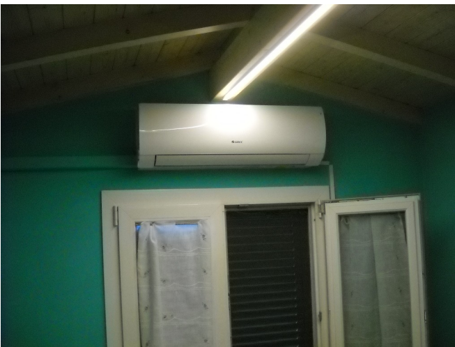
Finiture piano secondo mansardato