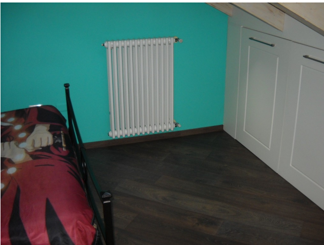
Finiture piano secondo mansardato