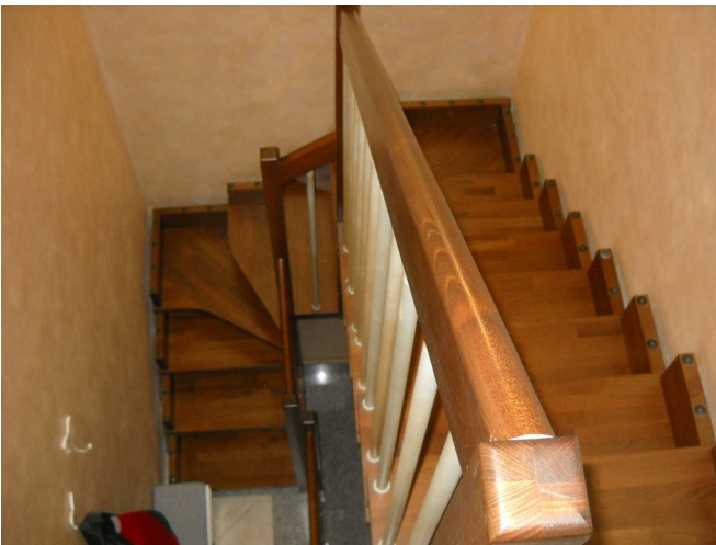
Scala collegamento piano 1° - piano 2°