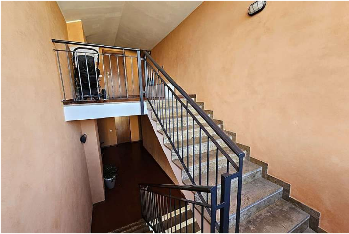
Tratto di scala dal secondo al terzo piano