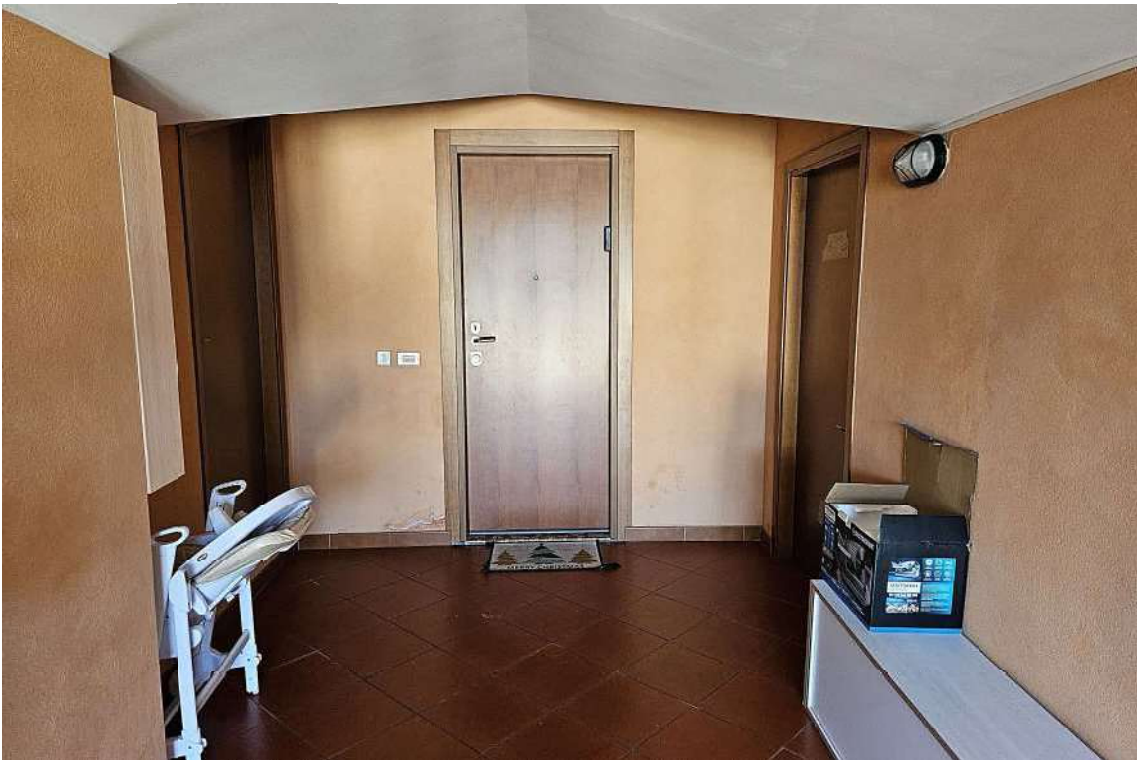
Ingresso all'unità immobiliare