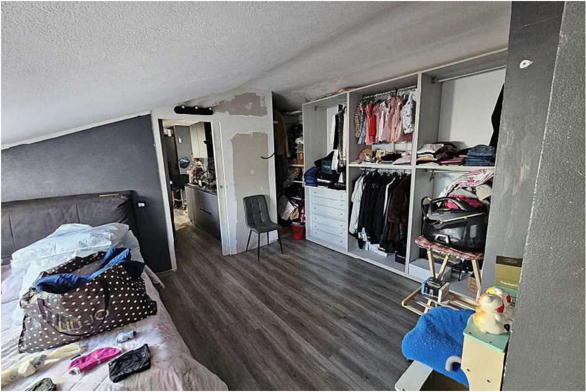
Camera da letto con visione del piccolo ripostiglio