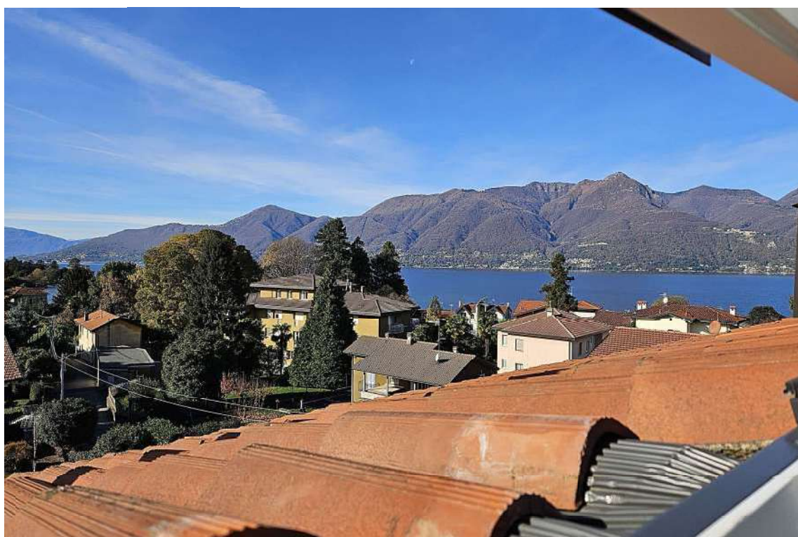
Vista dalle finestre tipo "velux"