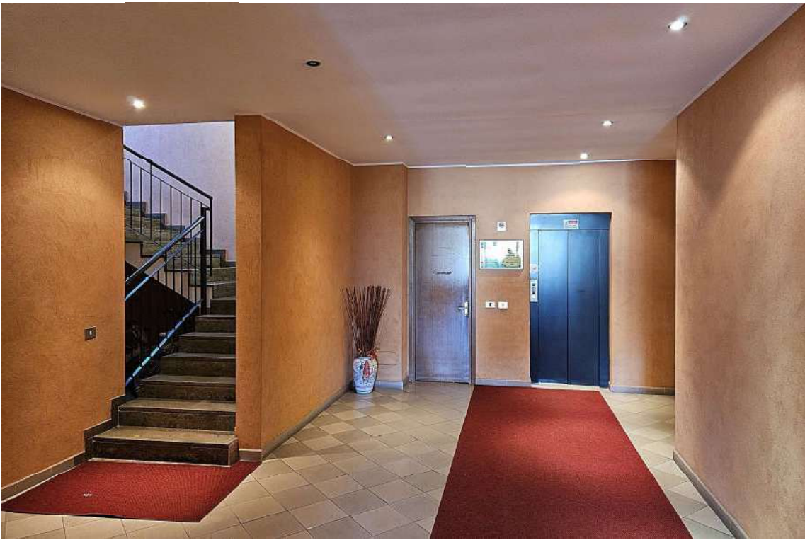
Ingresso al piano terra