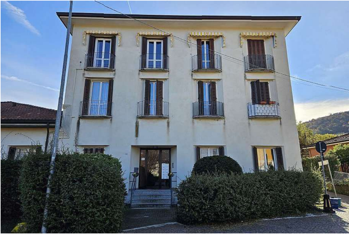
Ingresso alla palazzina