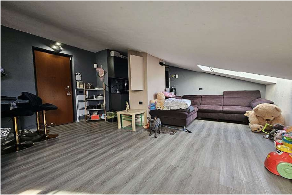
Soggiorno con cottura e ingresso