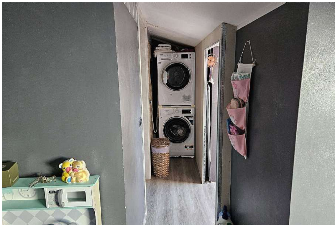
Disimpegno al bagno, cameretta e al ripostiglio lavanderia