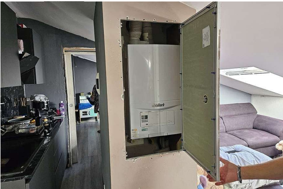
Caldaia per riscaldamento e produzione ACS