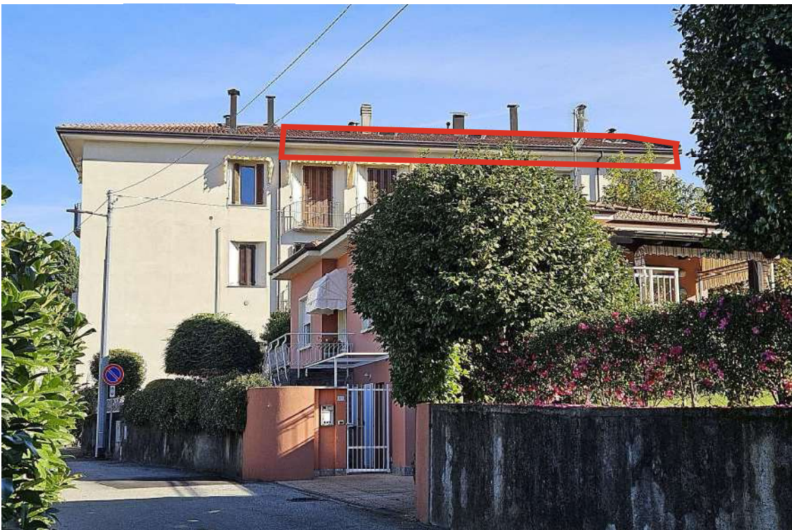
visione laterale della palazzina con identificazione della unità immobiliare