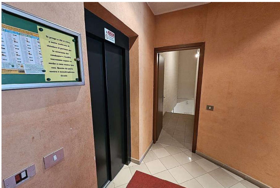
Accesso ai locali seminterrati