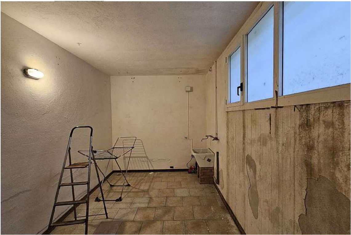
Vano comune - lavanderia