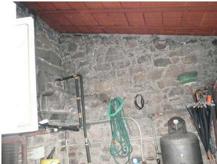
Centrale termica Interno