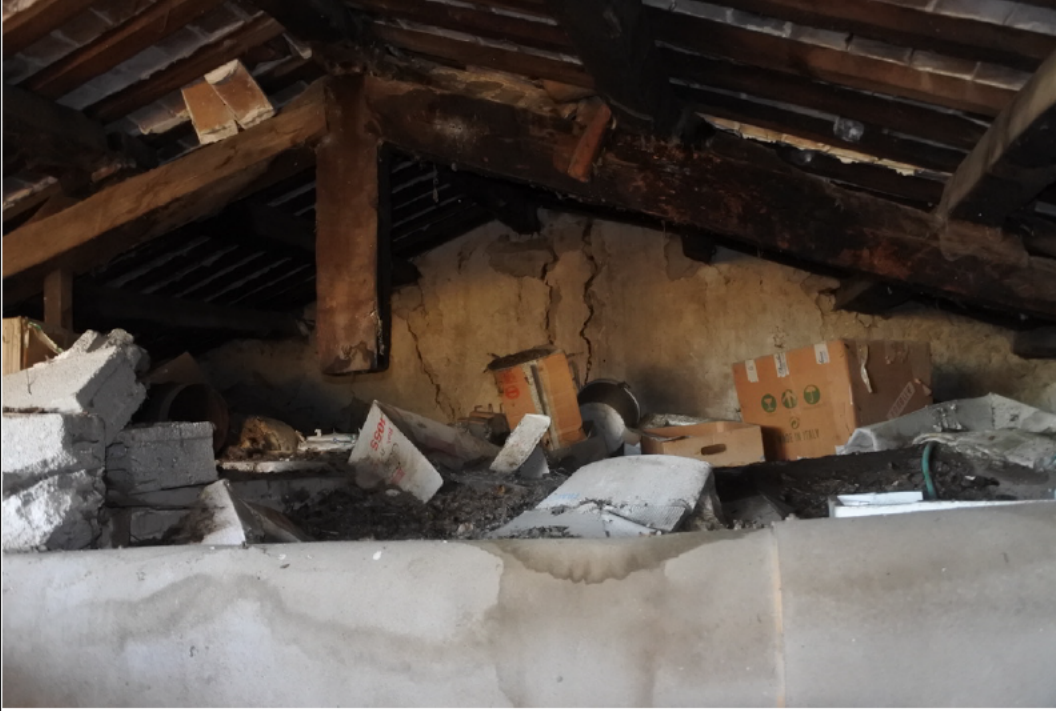
Tetto - interno