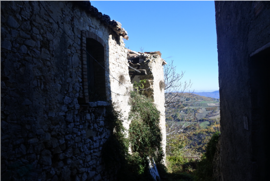
Porzione soggetta a crollo - esterno