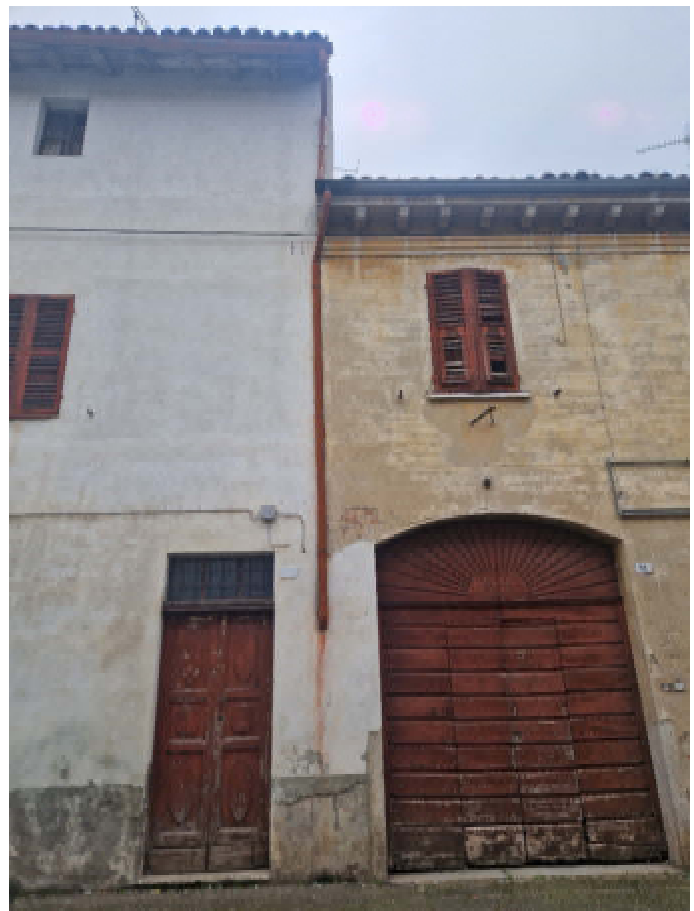
05: INGRESSO CARRAIO AI POSTI AUTO SU VIA CAVOUR