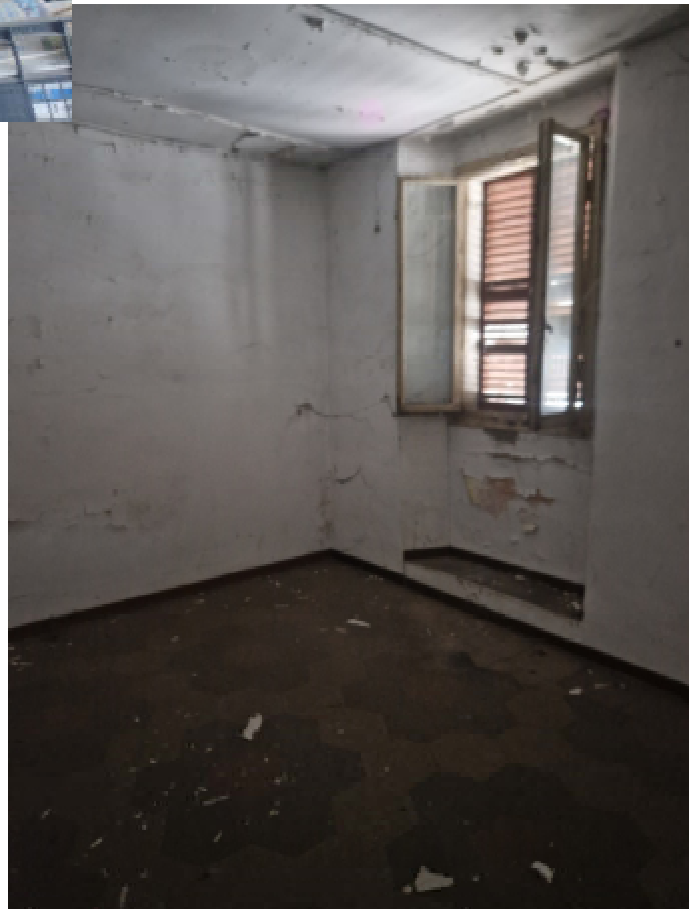
25: SUB16 DISIMPEGNO