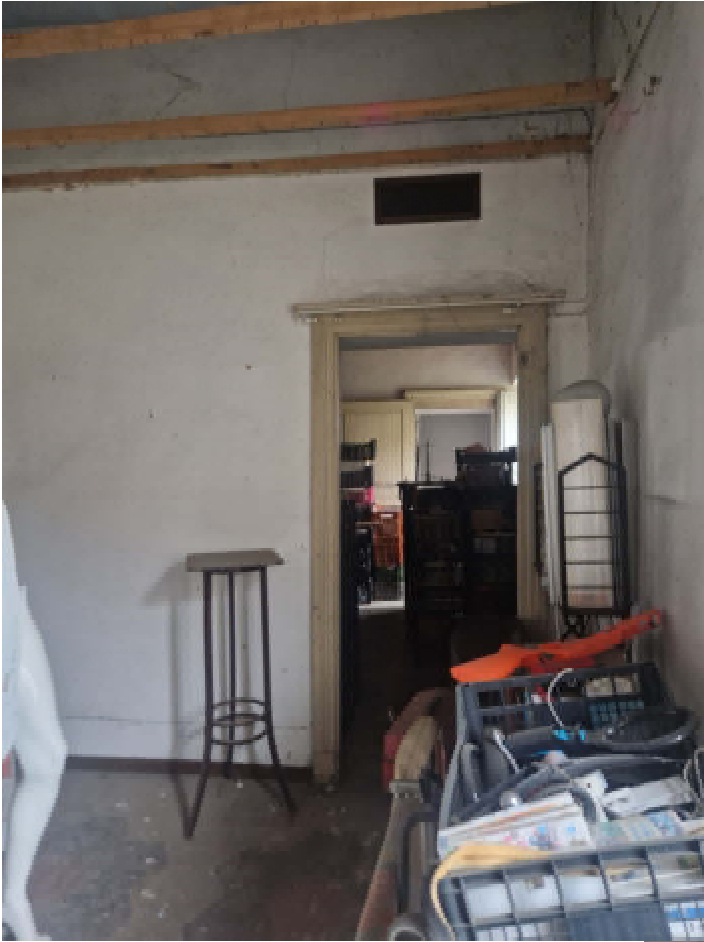
24: SUB 16 CAMERA