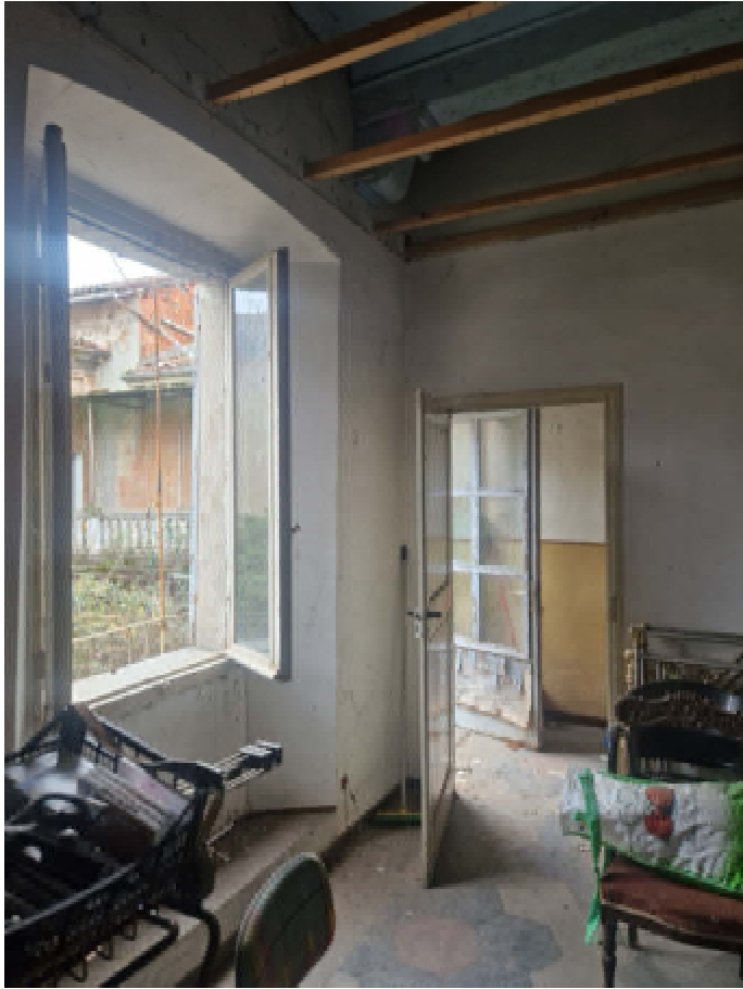
26: SUB16 DISIMPEGNO