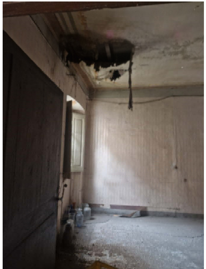
13: SUB 15 CAMERA