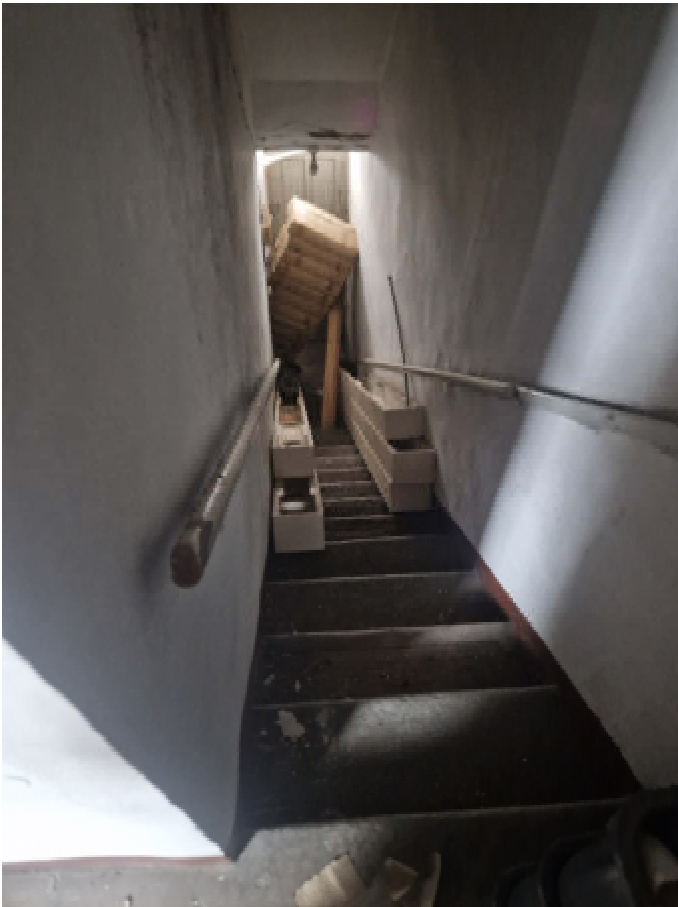
19: VISTA INTERNA SCALA DI ACCESSO ALLE UNITA' (BENE COMUNE) DA PIANO PRIMO