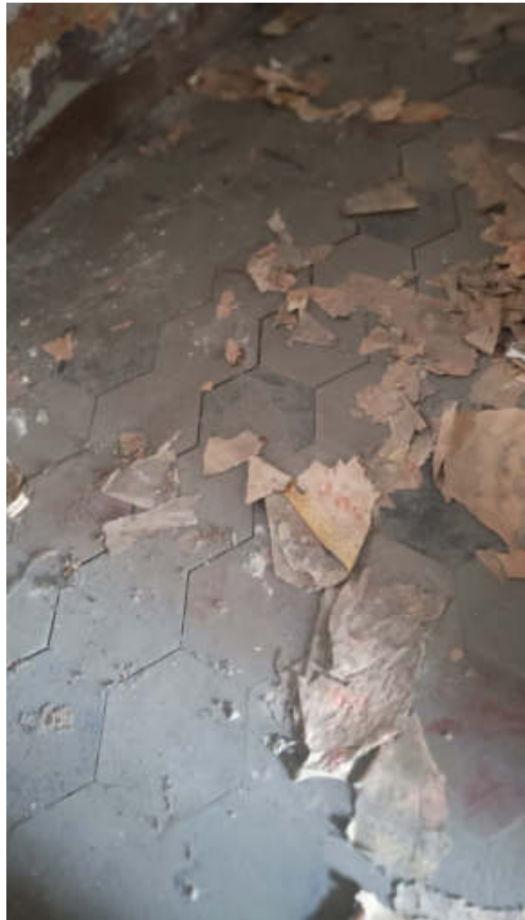
27: SUB 16 DISIMPEGNO DETTAGLIO PAVIMENTO