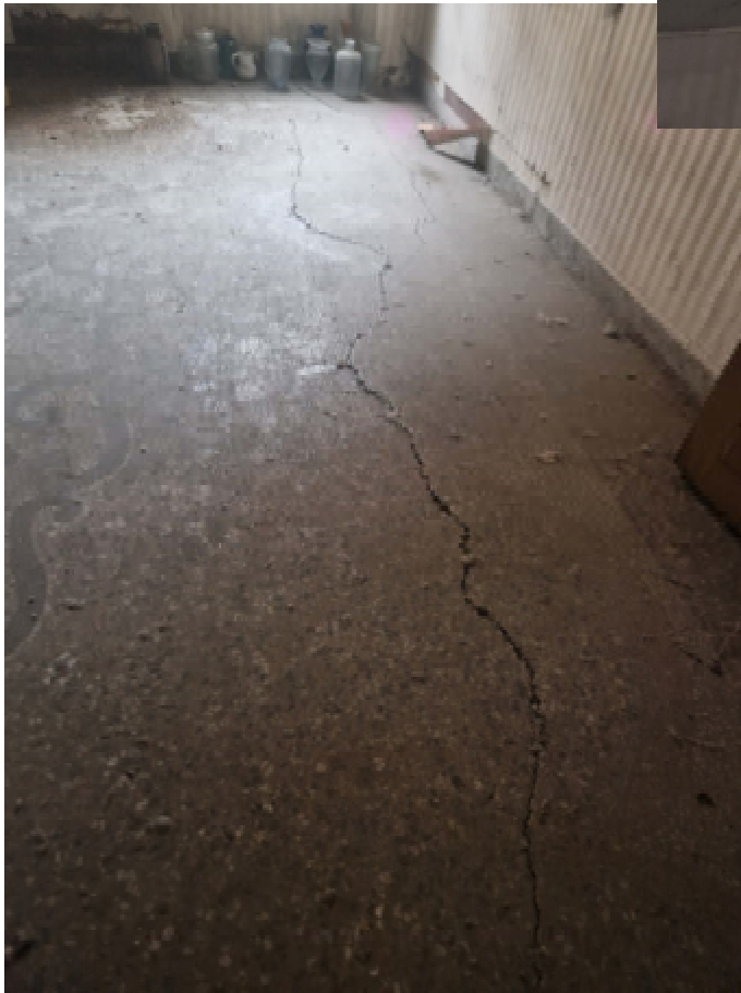
17: SUB 15 CAMERA DETTAGLIO PAVIMENTAZIONE