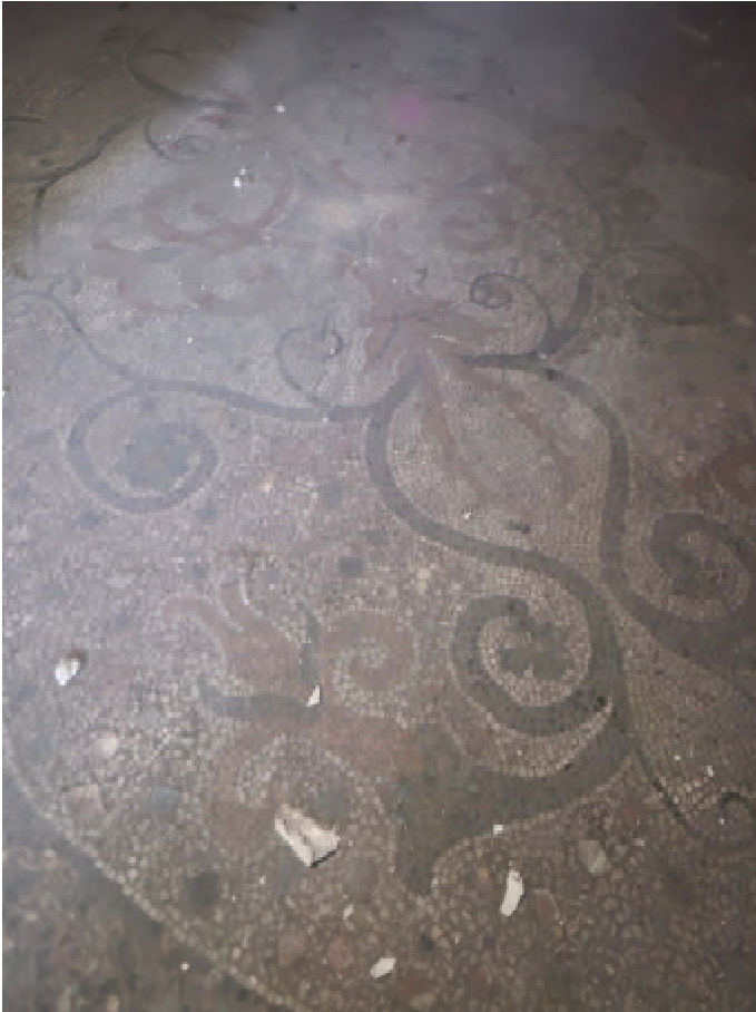
12: SUB 14 DETTAGLIO PAVIMENTO SOGGIORNO