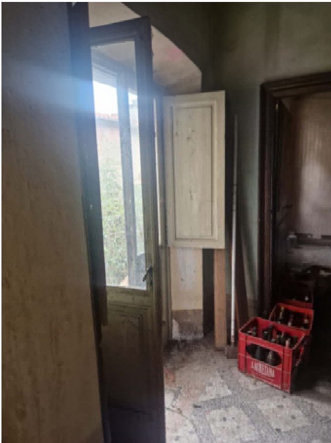
06/07: SUB 14 INGRESSO