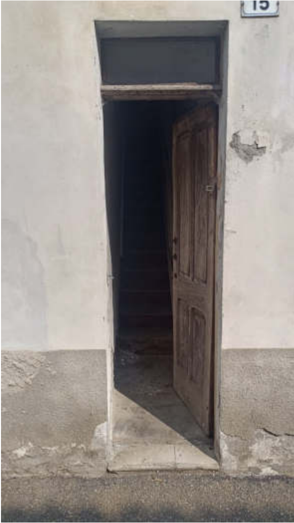
04: INGRESSO PEDONALE VIA CAVOUR