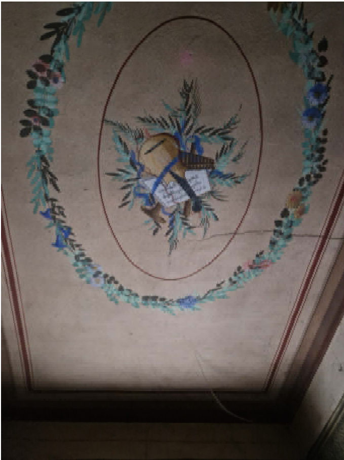
11: SUB 14 DETTAGLIO SOFFITTO SECONDO VANO