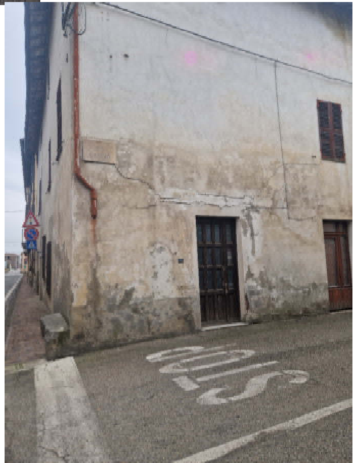
03: VISTA IMMOBILE VIA CAVOUR