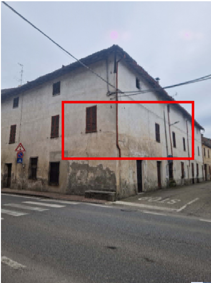
02: VISTA IMMOBILE VIA CAVOUR ANGOLO VIA VITTORIO EMANUELE