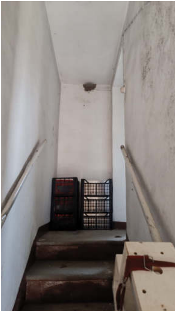
21: VISTA INTERNA SCALA DI ACCESSO ALLE UNITA' (BENE COMUNE) DETTAGLIO PIANEROTTOLO AL PIANO