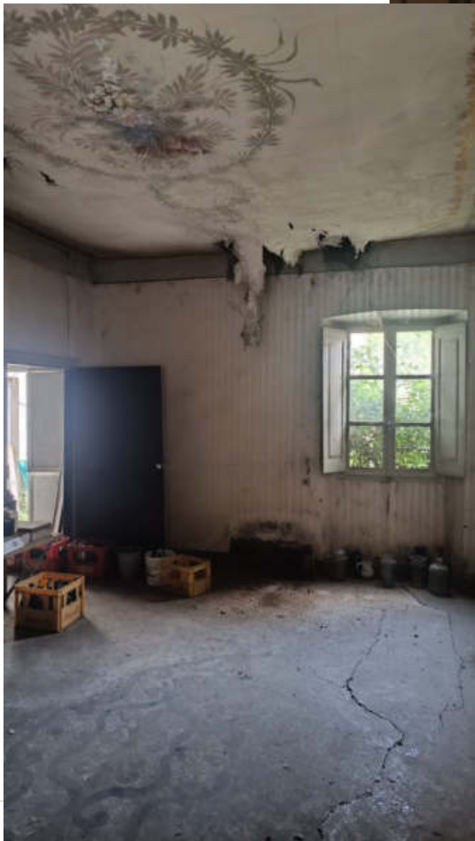
15: SUB 15 CAMERA