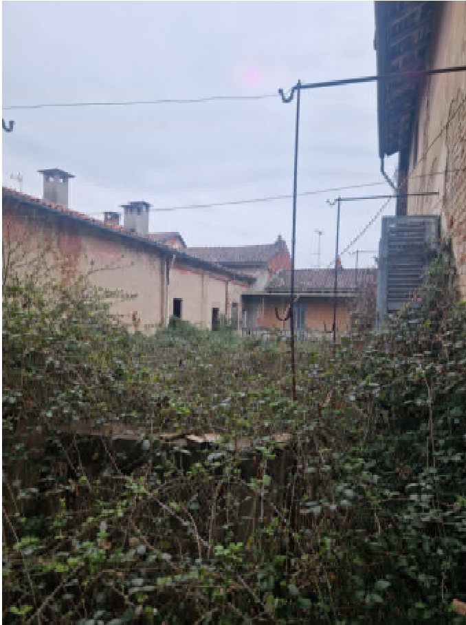
30/31: BALLATOIO ESTERNO DI DISTRIBUZIONE (BENE COMUNE)