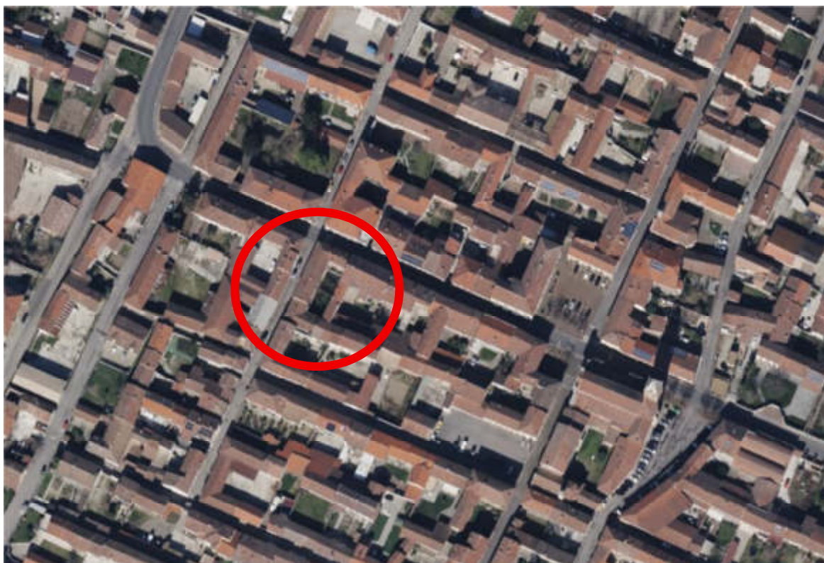
01: VISTA AEREA IMMOBILE