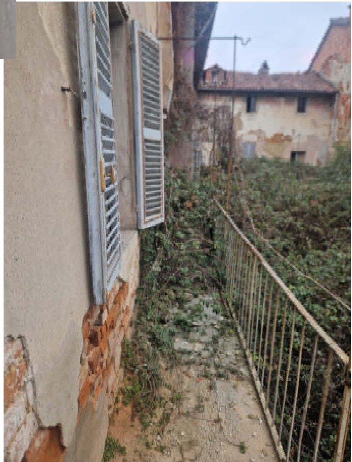
29: BALLATOIO ESTERNO DI DISTRIBUZIONE (BENE COMUNE)