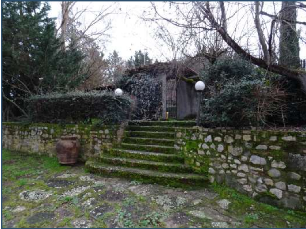
FOTO 10 ZONA DI INGRESSO PEDONALE AL RESIDENCE