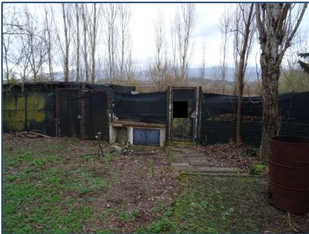
FOTO 19 TERRENO A CONFINE CON ALTRA PROPR. PART.277