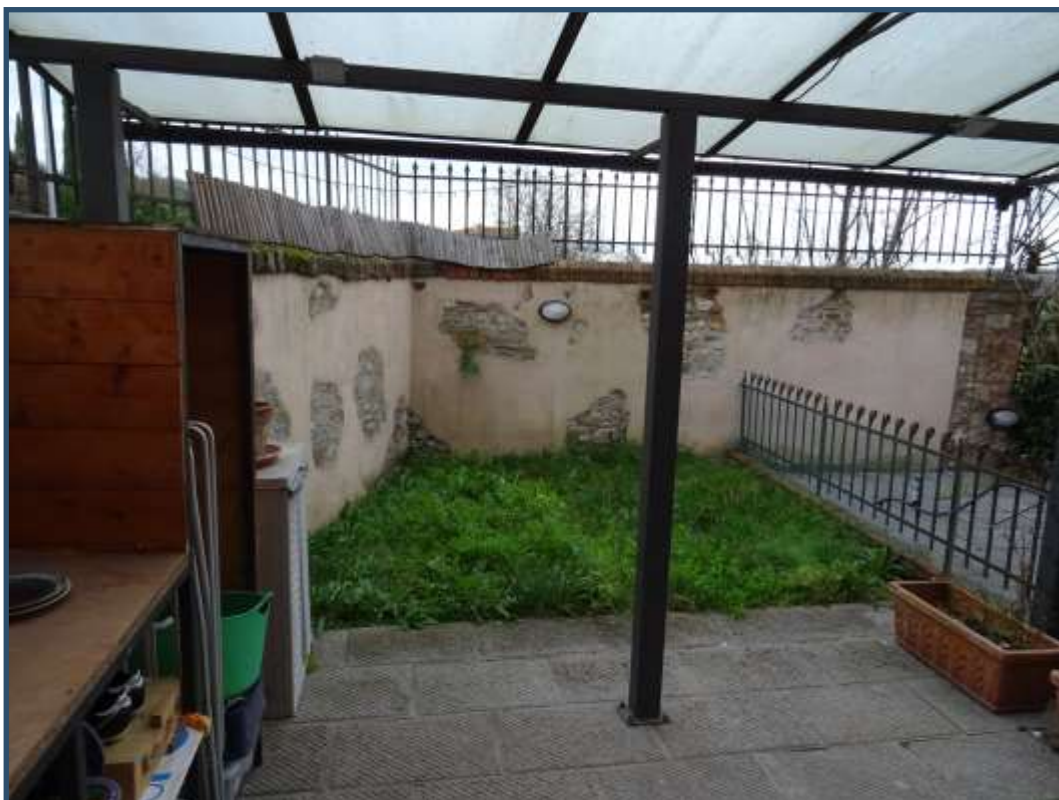
FOTO 28 RESEDE ESTERNO