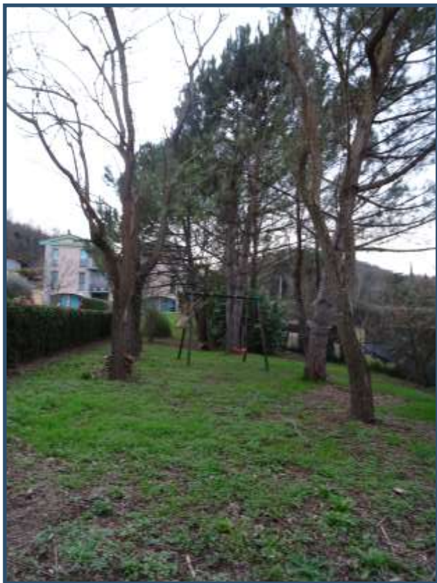
FOTO 18 TERRENO A CONFINE CON ALTRA PROPR. PART. 47