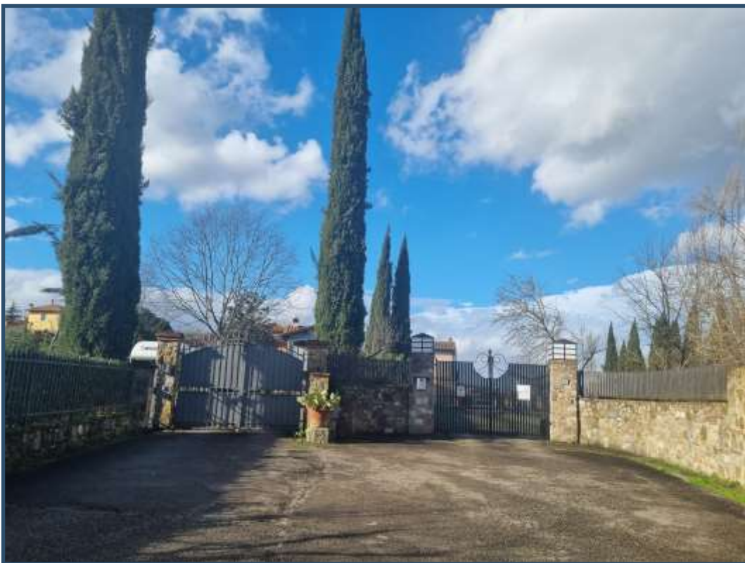
FOTO 2 SULLA DESTRA CANCELLO DI INGRESSO AL RESIDENCE