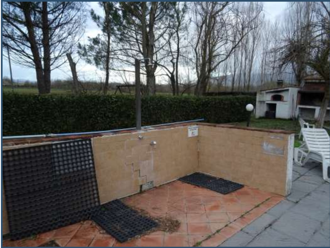
FOTO 16 ZONA DOCCE PISCINA