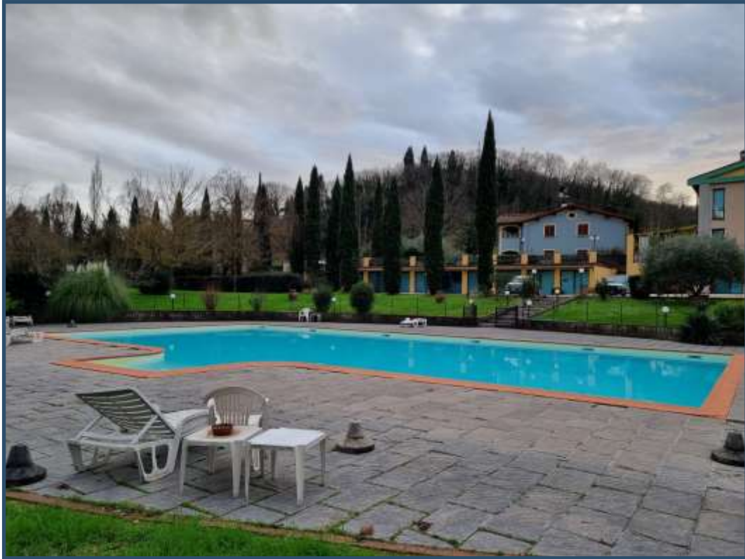
FOTO 14 PISCINA