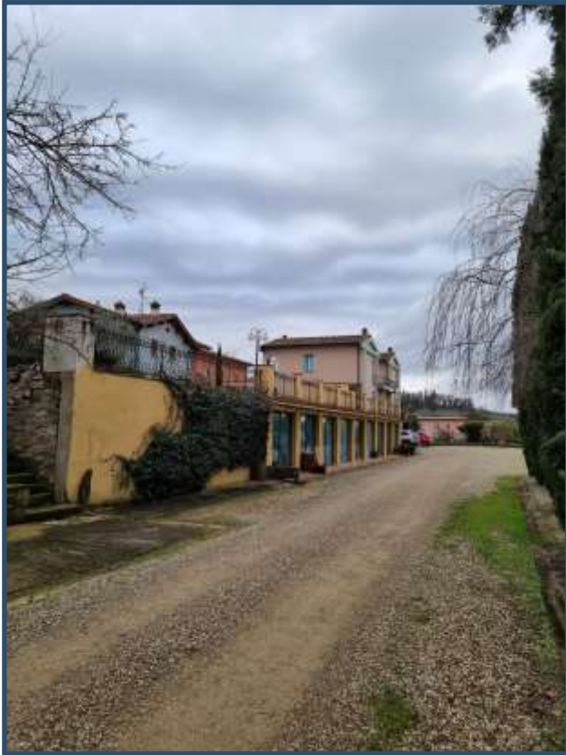
FOTO 8 EDIFICIO DEI GARAGE