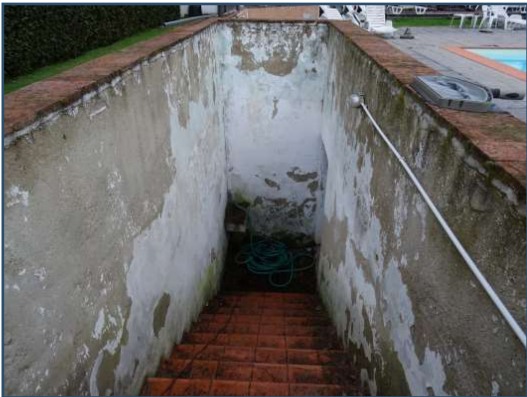
FOTO 15 ACCESSO AL LOCALE TECNICO DELLA PISCINA