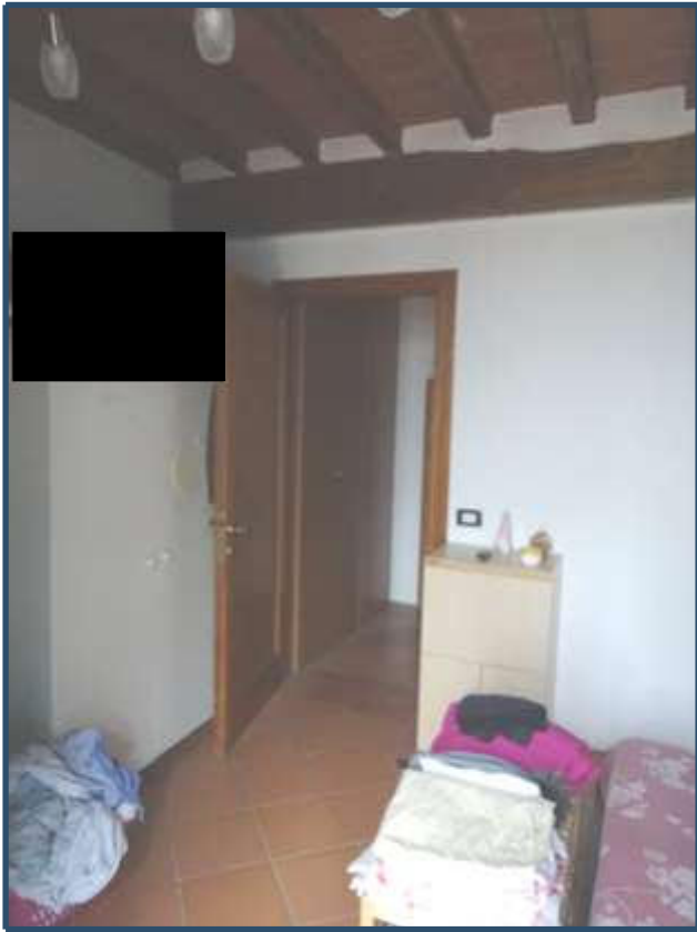
FOTO 26 CAMERA ACCESSO DA DIS.