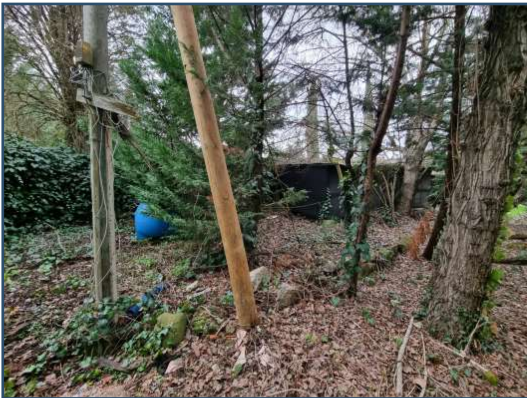
FOTO 13 TERRENO CIRCOSTANTE LA TETTOIA