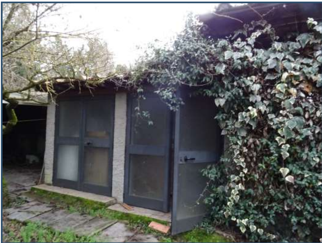
FOTO 11 RIPOSTIGLIO ESTERNO