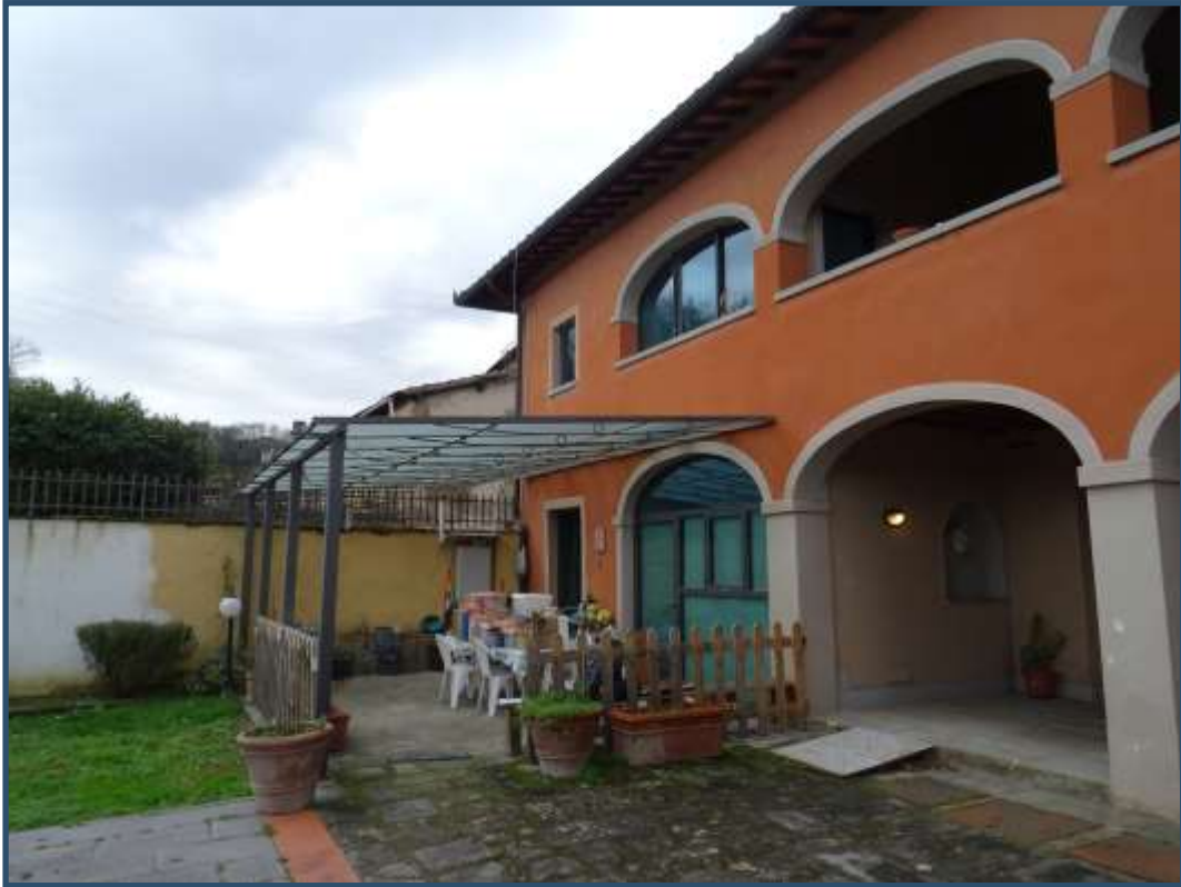
FOTO 30 RESEDE CON PERGOLATO FRONTE INGRESSO ABITAZIONE