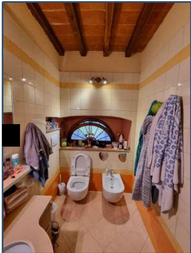
FOTO 25 BAGNO