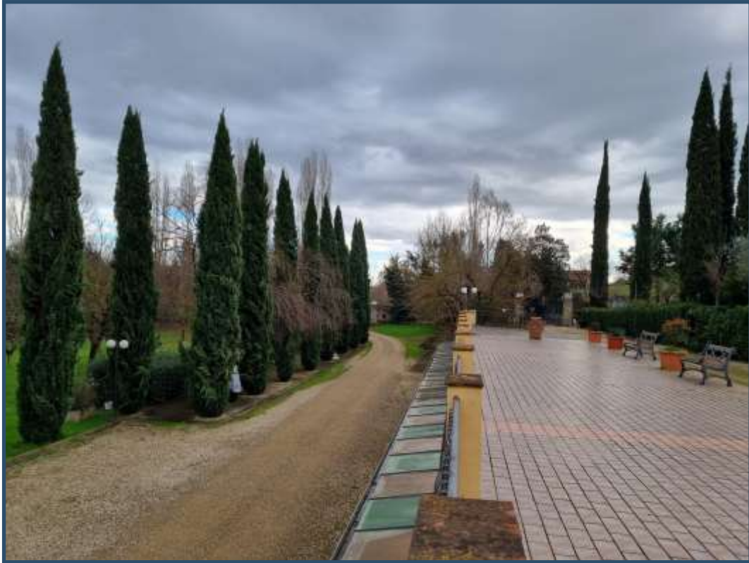
FOTO 6 VIALE DI INGRESSO AL RESIDENCE E TERRAZZA DI COPERTURA DEI GARAGES