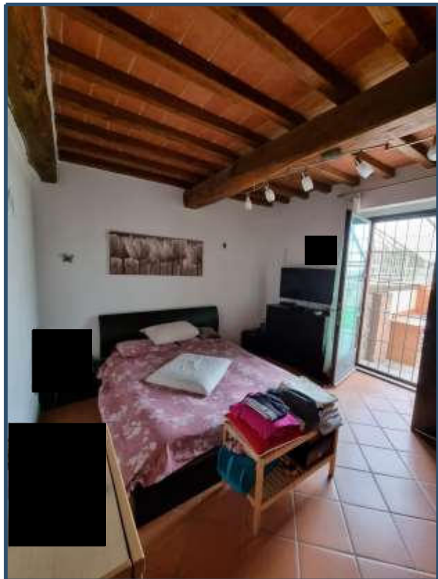
FOTO 27 CAMERA