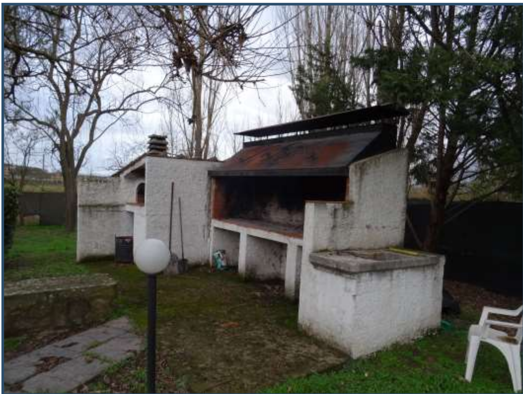
FOTO 17 ZONA BARBECUE