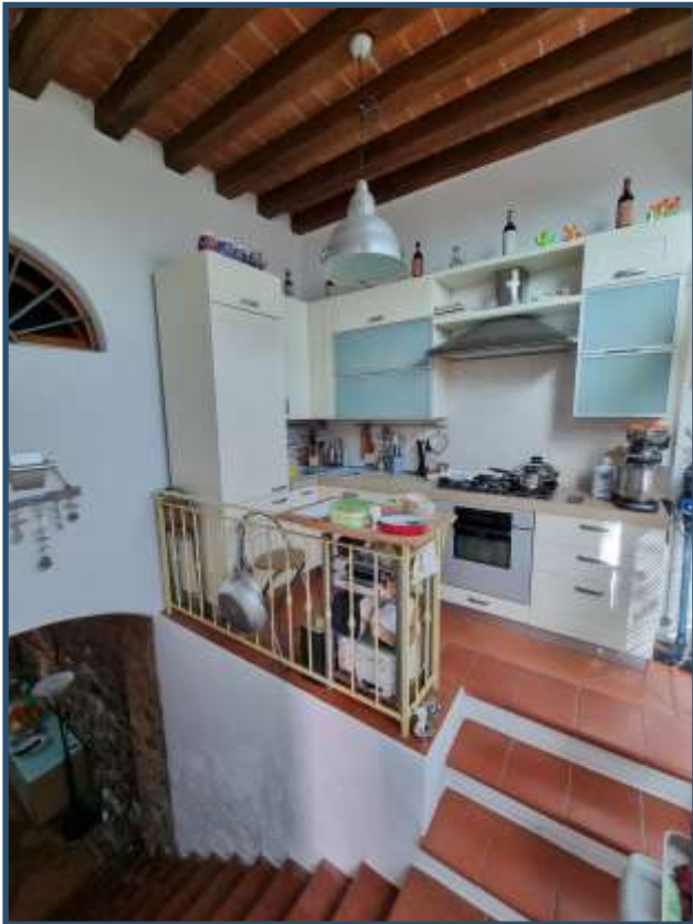
FOTO 22 CUCINA