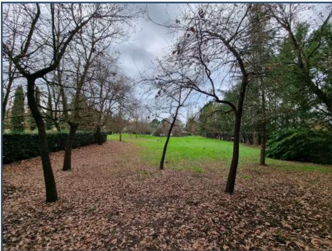
FOTO 7 TERRENO PART. 274