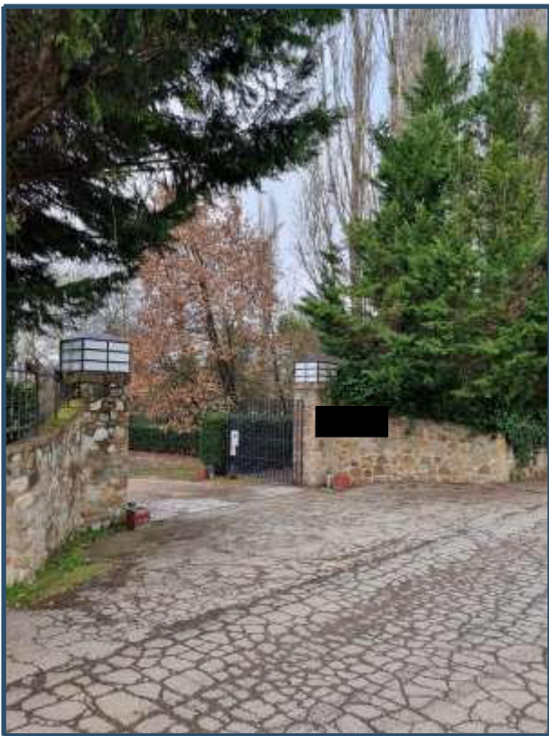
FOTO 4 INGRESSO DA VICINALE