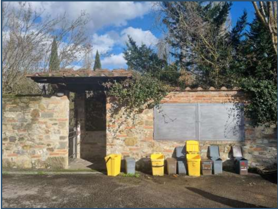
FOTO 3 INGRESSO PEDONALE