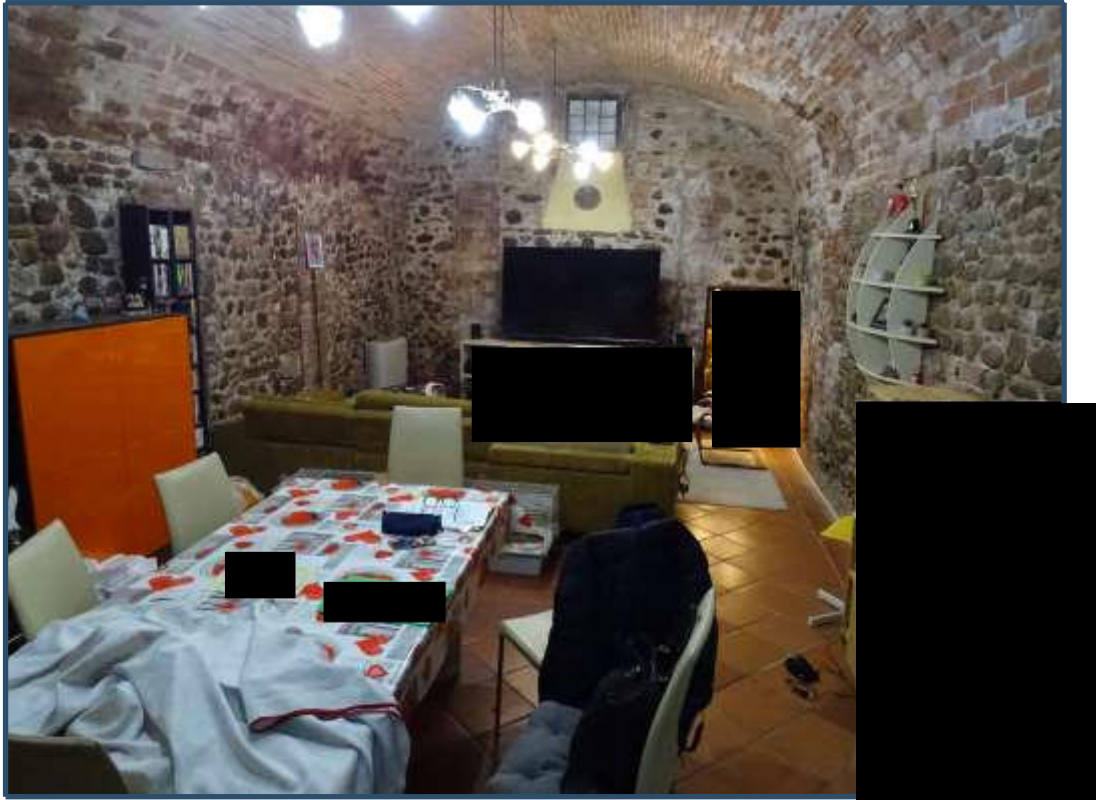
FOTO 20 CANTINA