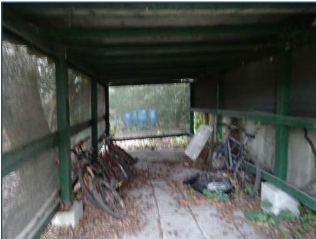
FOTO 12 TETTOIA ADIACENTE INGRESSO PEDONALE