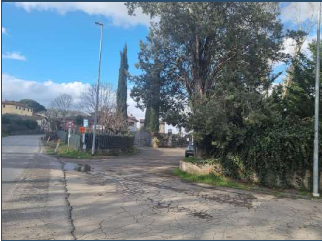
FOTO 1 INGRESSO DA S.R. 69 VAL D'ARNO