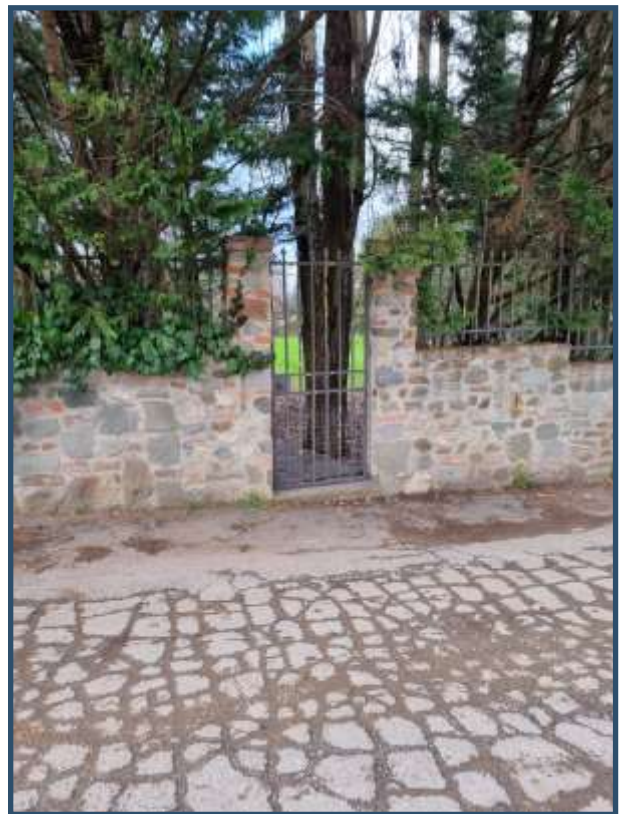
FOTO 5 INGRESSO PEDONALE DA VICINALE