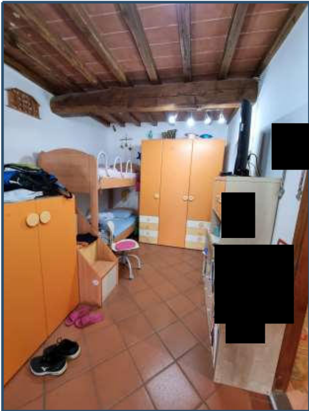
FOTO 24 SOGGIORNO