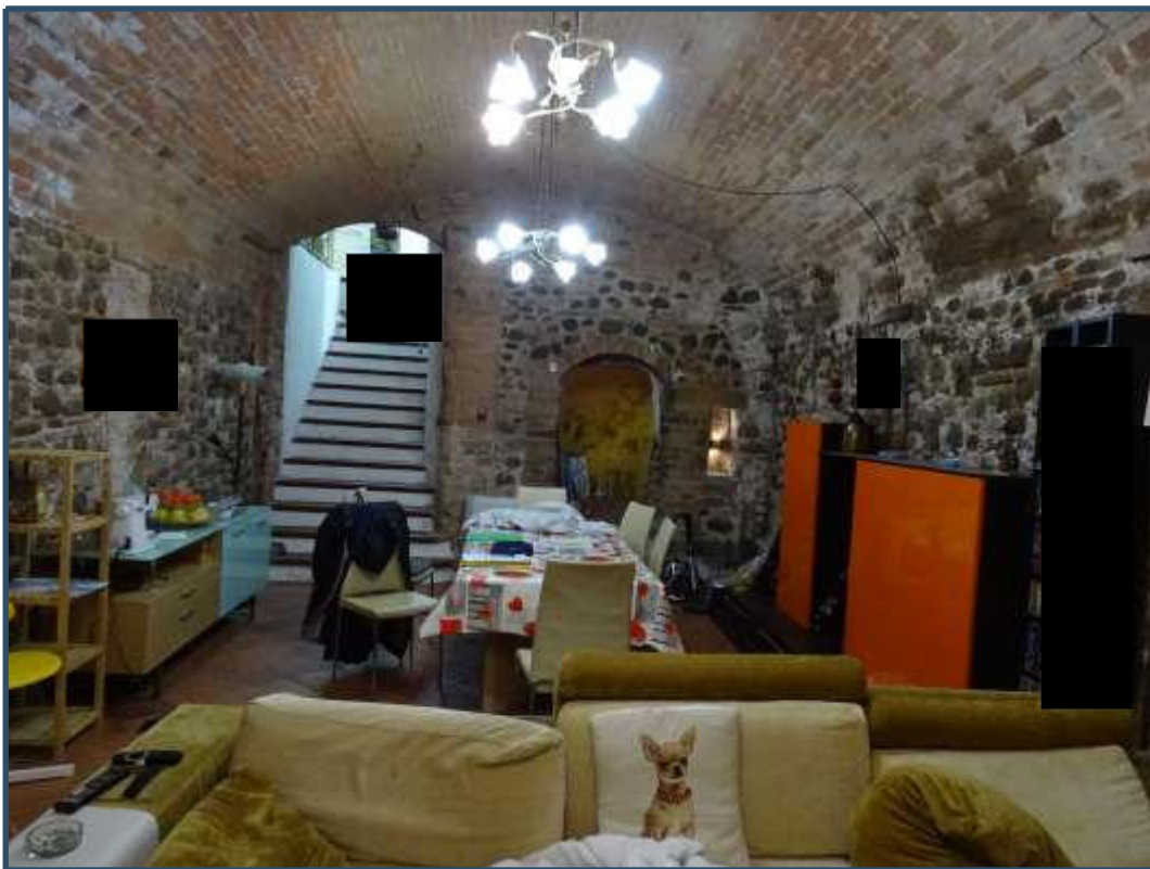
FOTO 21 CANTINA, SCALA DI ACCESSO, SULLA DESTRA IL FORNO