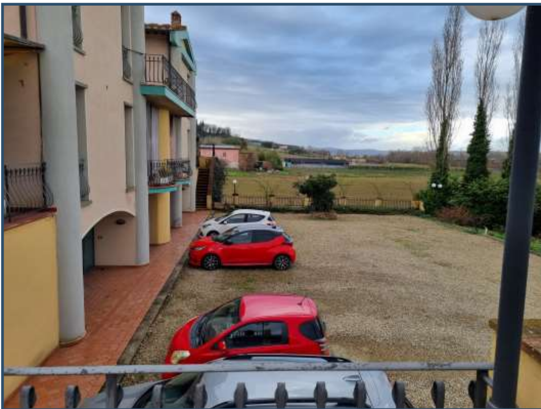
FOTO 9 PARCHEGGIO PRIVATO RESIDENCE